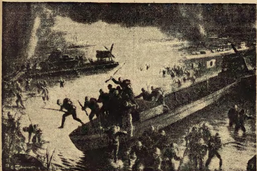
Rysunek wyjęty z amerykańskiego pisma „Life” przedstawiający atak wojsk japońskich w Singapur.

Nadesłane, a nie zamówione przez Redakcję reklamy będą zwracane autorom jedynie wówczas, gdy dołączone zostaną znaczki pocztowe na opłacenie przesyłki zwrotnej. Prenumerata miesięczna 4.50 zł., w odnośnym do domu 5 zł. Na prowincji dopłata portu. Konto czekowe: Warszawa 658.