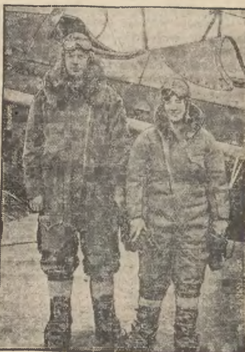
planuje lot arktyczny. Pragną oni przelecieć z Ameryki do Chin, lecąc nad Północnym Oceanem Lodowatym.

Rok zał. 1880. Naistarszy skład Tel. Nr 104-65.