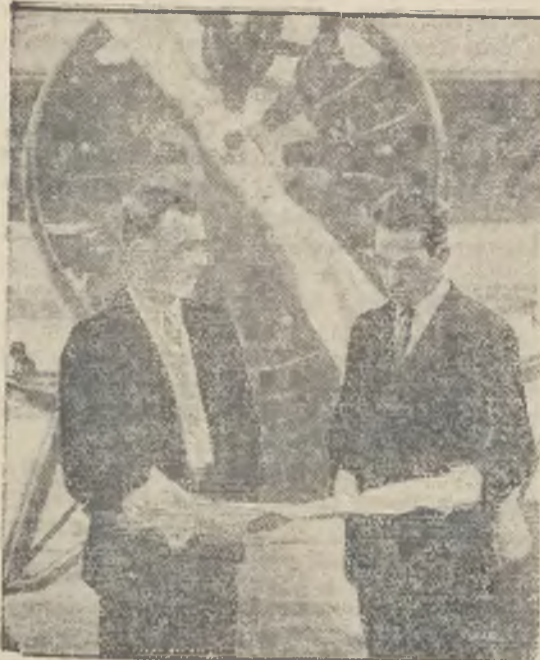
Dwaj lotnicy amerykańscy, Hugh Herndon (na lewo) i Clyde Pangborn zamierzają pobić rekord Posta i Gatty'ego, którzy oblecieli świat w 8 i pół dniach.