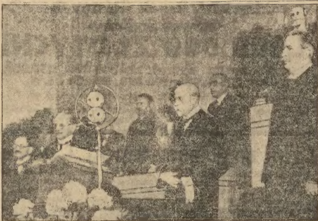
Prezydent Masaryk, wybrany w dniu 24 bm. prezydentem Czechosłowacji, wygłasza po wyborze przemówienie, transmitowane przez radio.