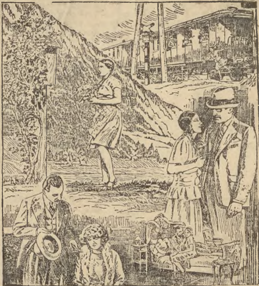
TRAGEDJA MAŁEJ WERONIKI. (Do artykułu na stronie 7-mej).

(Telefonem od naszego korespondenta). Warszawa, 5 kwietnia. (st) Z powodu przesilenia na stanowisku rumuńskiego Ministra spraw wojsk. zapowiedziany na jutro przyjazd do Warszawy gen. Samsonoviti, szefa sztabu generalnego armii rumuńskiej został odwołany.