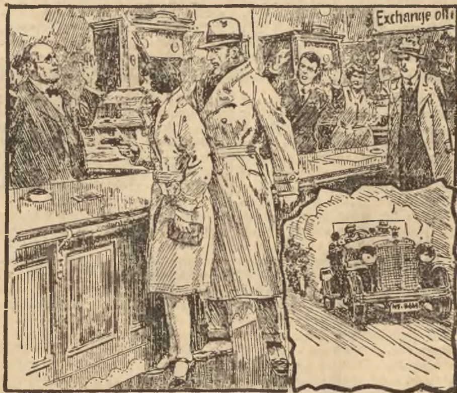
17-LETNIA BANDYTKA. (Do artykułu na stronie 6-tej).

Nowo-otworzony Dom Jedwabiu S. Weinman, Lwów, Legionów 29. zawiadania o dalszej ZUPEŁNEJ WYSPRZEDAŻY z powodu likwidacji 4728 wszystkich artykułów po izdanych na składzie w najmodniejszych deseniach i kolorach po ni byw le ni kich cenach.