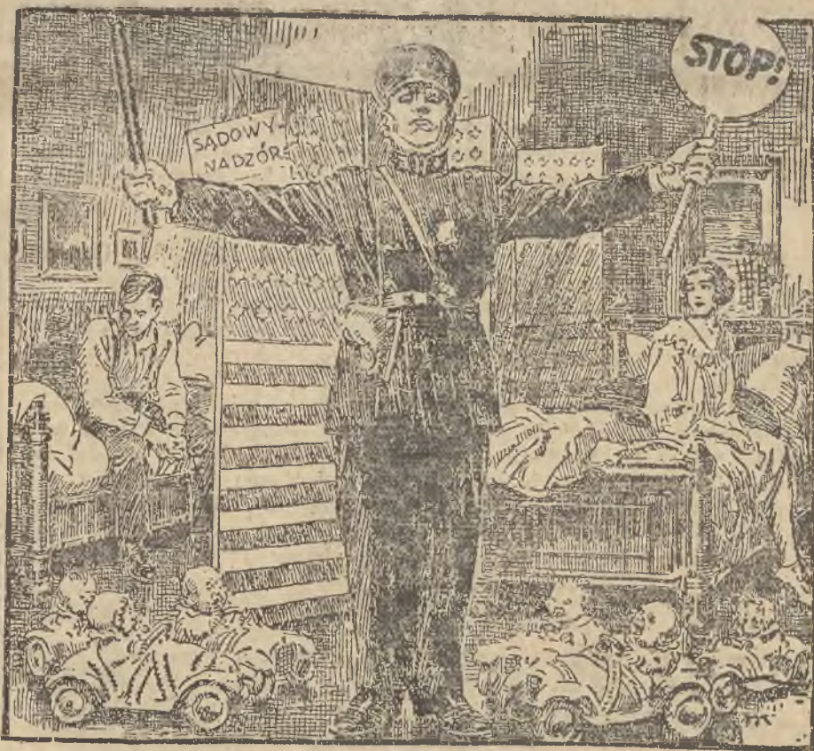
AMERYKA REGULATORKA LICZBY DZIECI. (Do artykułu na stronie 10-tej).

(Telefonem od naszego korespondenta.) Warszawa, 7. marca (ab) Jutro odbędzie się w Berlinie licytacja listów Szopena, oraz jego rękopisów muzycznych, wśród których znajduje się rękopis „Poloneza”. Rząd polski udziału w licytacji nie weźmie, gdyż nie uzyskał potrzebnych na ten cel 30 tys. zł.