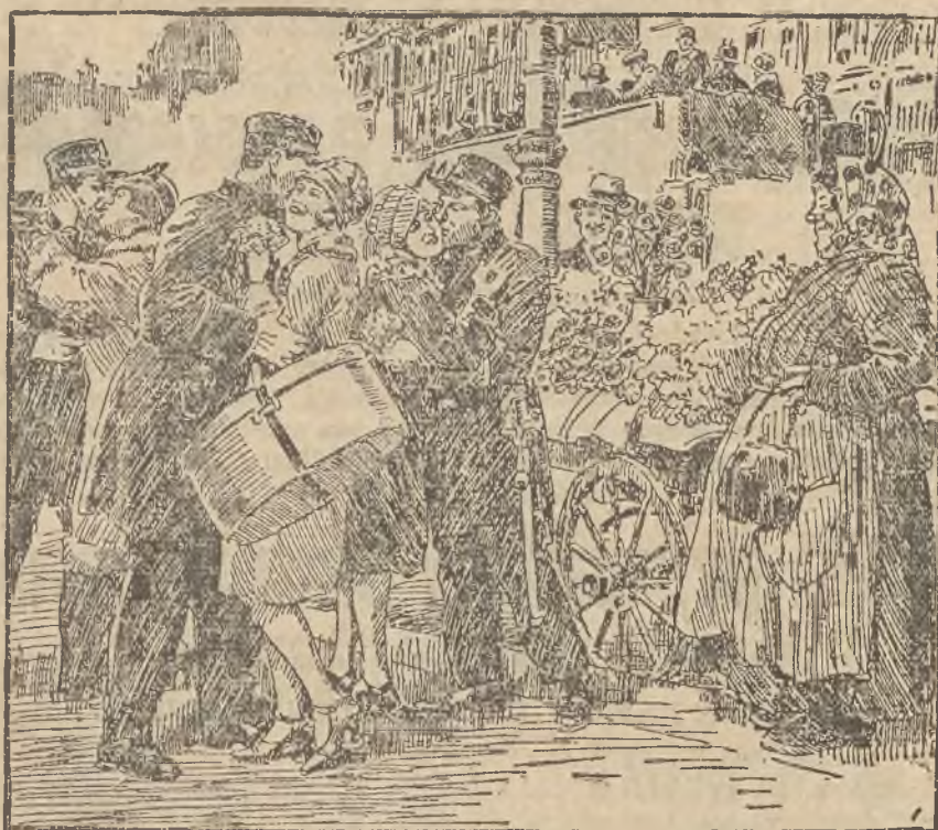
W BIAŁY DZIEŃ CALOWALI SIĘ POLICJANCI Z MIDINETKAMI. (Do artykułu na str. 9-tej.)

Warszawa, 23. kwietnia. (ab) W związku z objęciem urzędowania przez wiceministra spraw wewn. pułk. Br. Pierackiego prasa opozycyjna zapowiadała rzekomo spodziewane dalsze zmiany na wyższych stanowiskach w Min. spraw wewn. oraz urzędach temu Min. podległych. Jak z kompetentnego źródła donoszą, pogłoski te pozbawione są wszelkich podstaw, gdyż zmiany osobowe nie są projektowane.