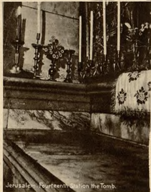
Grób w kościele Grobu Pańskiego w Jerozolimie.