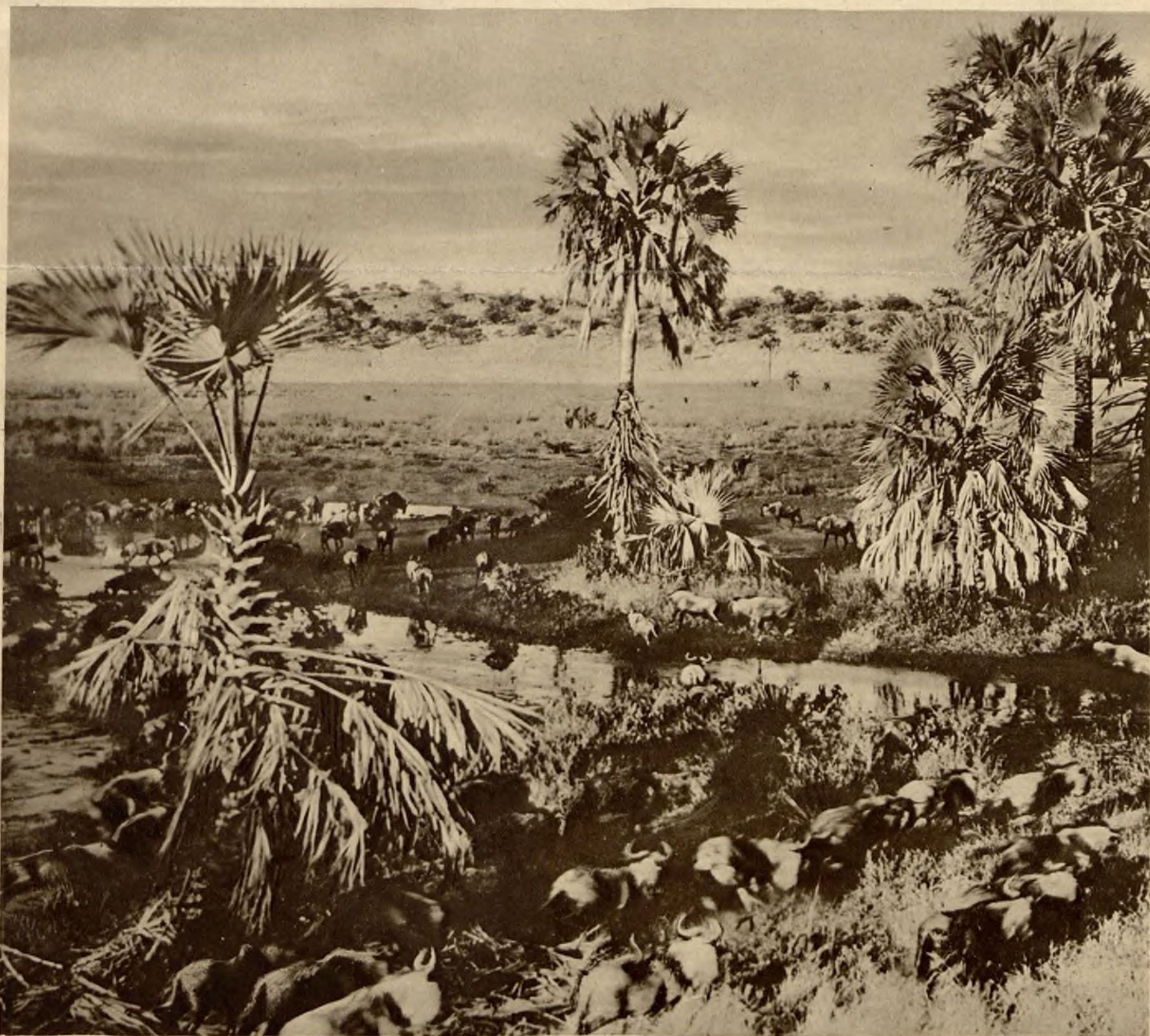
Rzadkie zdjęcie z Afryki pld.-wsch. przedstawiające rozmaite gatunki dzikiej zwierzyny zgodnie idącej do poidła. Dokonanie tego zdjęcia możliwe było tylko w ten sposób, że aparat ukryty był na drzewie i sam automatycznie dokonywał zdjęć.