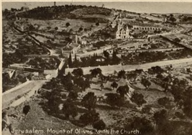
Góra oliwna z kościołem.