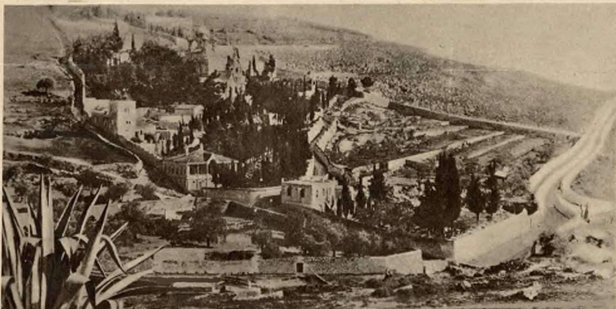
Ogrody na górze Oliwnej.