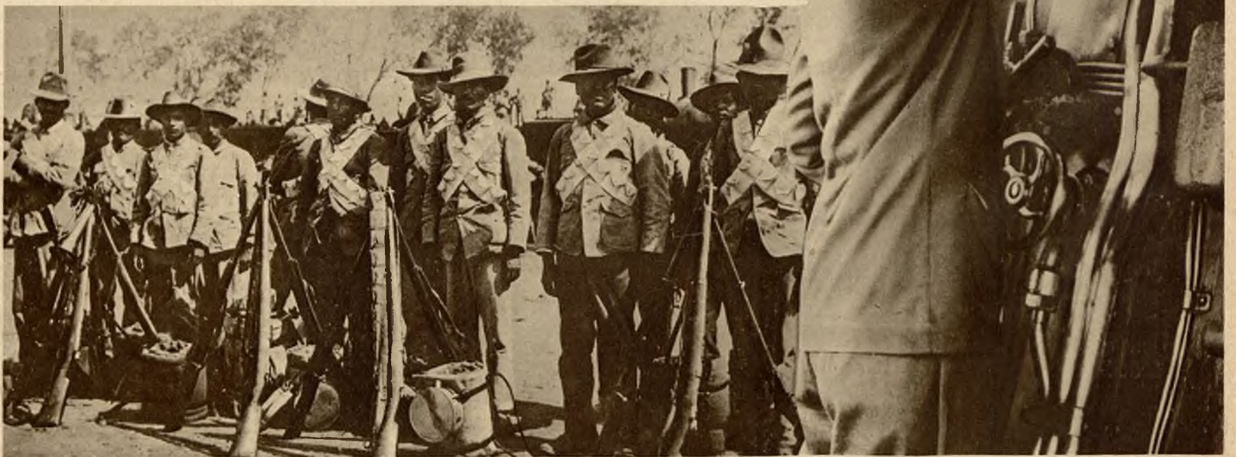
Piechota armji rewolucyjnej gen. Aguire w Meksyku.