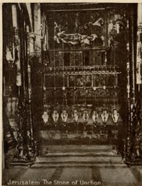
Jerusalem. The Stone of Anction.