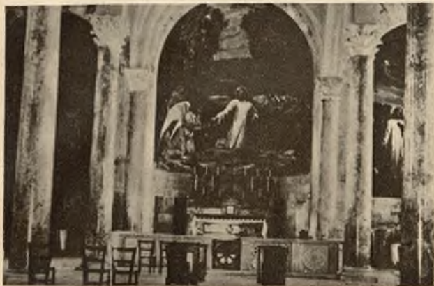
Wnętrze kościoła na górze Oliwnej „Getsemane“.