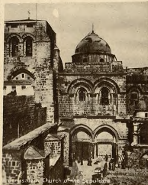
Bazylika Grobu Pańskiego.