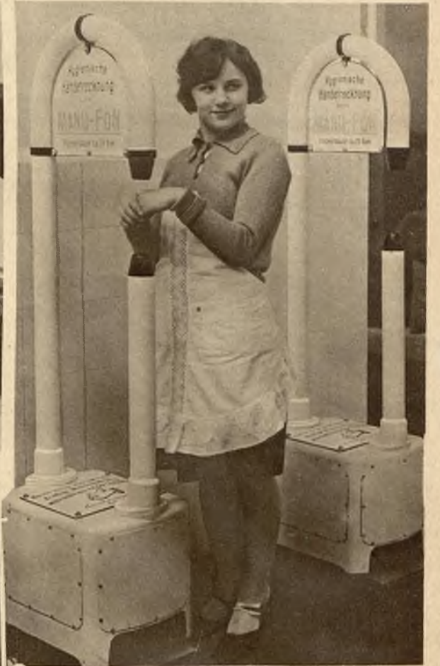
Aparat do suszenia rąk ciepłym powietrzem (zamiast ręcznikiem) nadający się ze względu na swe higieniczne zalety do użytku w większych zakładach, restauracjach etc.