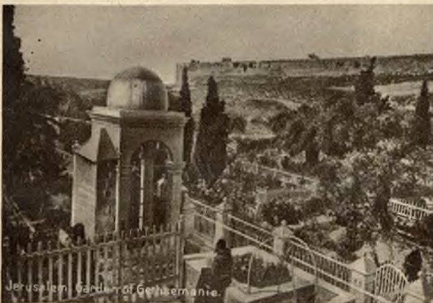
Ogród oliwny „Getsemane“, gdzie Jezus krwawy pot wylewał.

Miejsce, gdzie Chrystus rozpoczął swoją mękę i zwyciężył śmierć