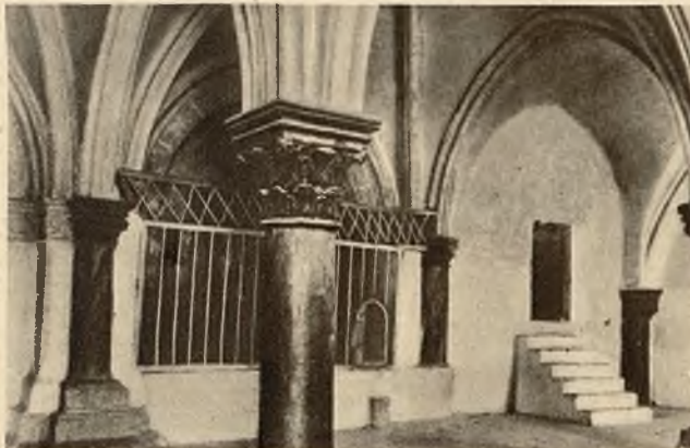
Sala Wieczernika w Jerozolimie.

Miejsce, gdzie Chrystus rozpoczął swoją mękę i zwyciężył śmierć