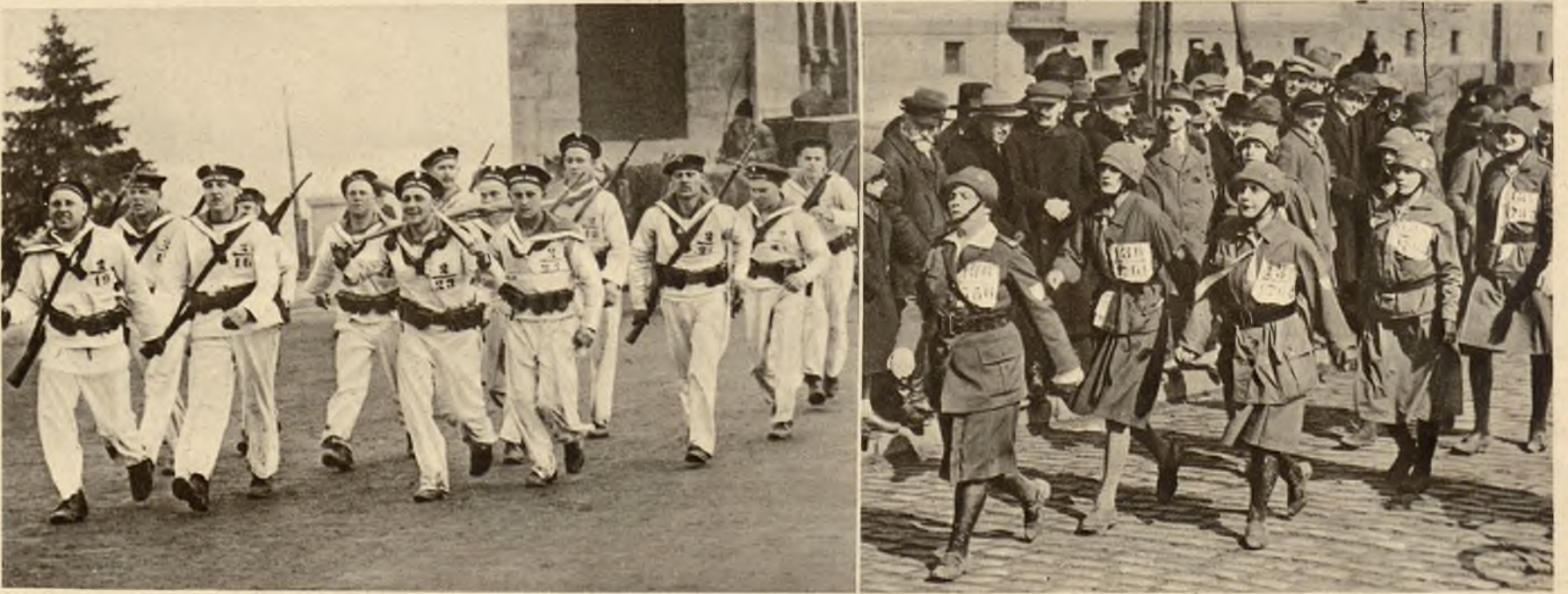
Z uroczystości imieninowych marszałka Piłsudskiego: drużyna marynarska i drużyna strzelczyń z Poznania w czasie biegu Sulejówek-Belweder.