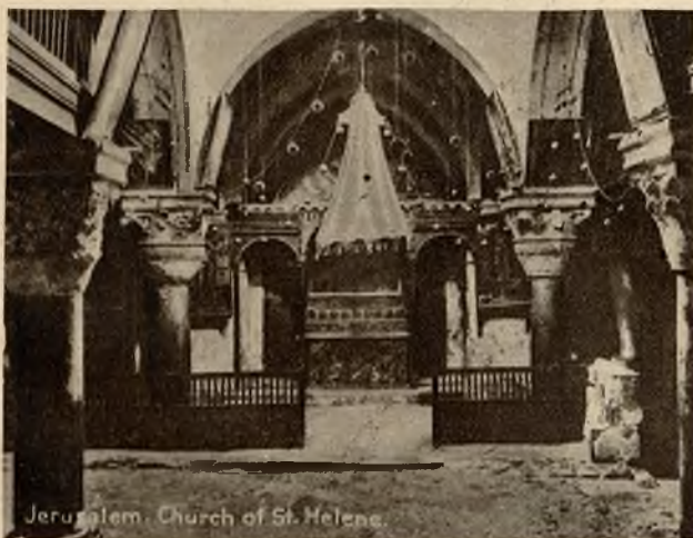
25 metrów od miejsca ukrzyżowania Chrystusa znajduje się 8 metrów pod ziemią kaplica św. Heleny. Obecnie należy do schyzmatyków abisyńskich.