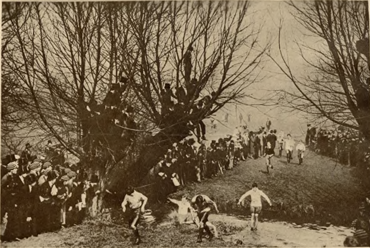
Wiosenny bieg na przełaj uczniów szkoły w Eton (Anglja).