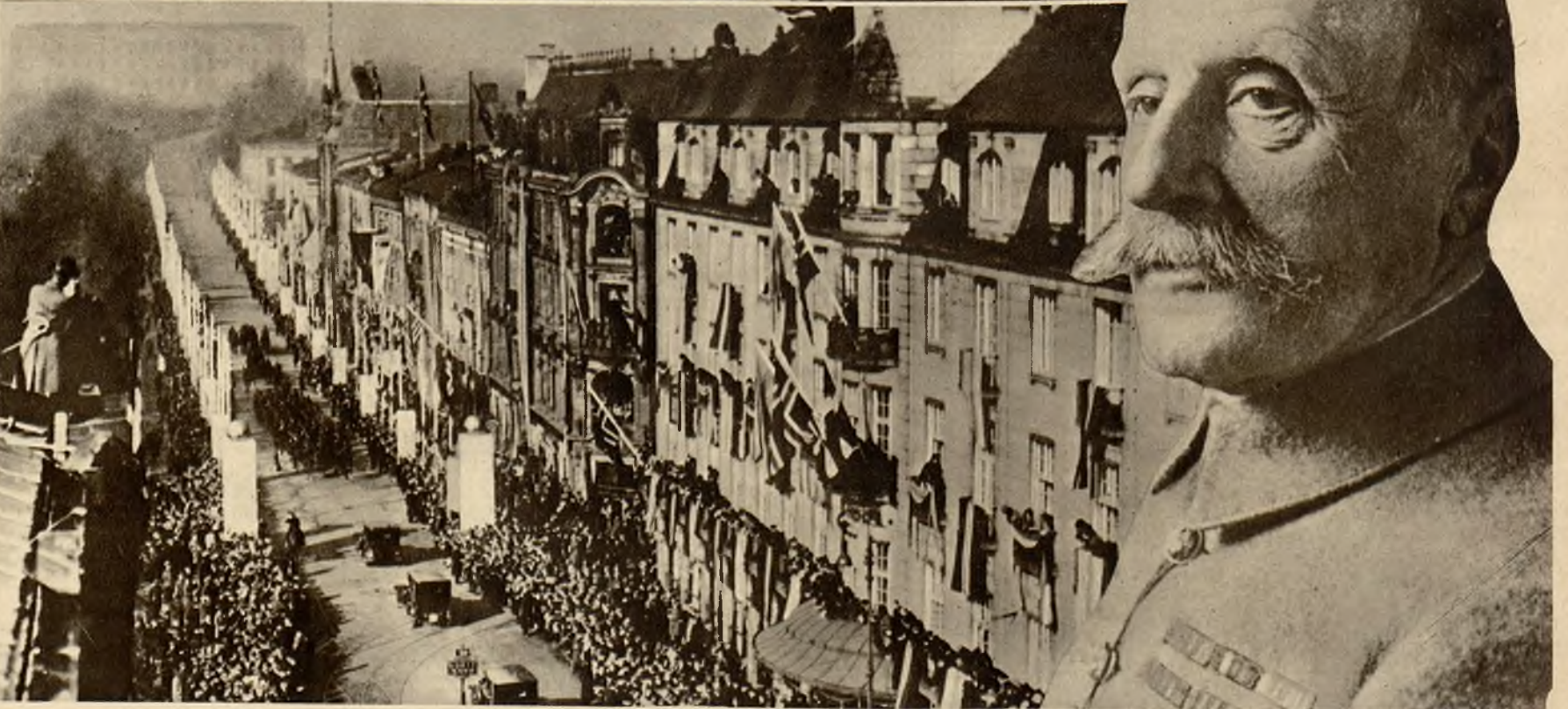
Pochód ślubny norweskiego następcy tronu Olafa i ks. Marty Szwedzkiej. W głębi zamek królewski w Oslo.