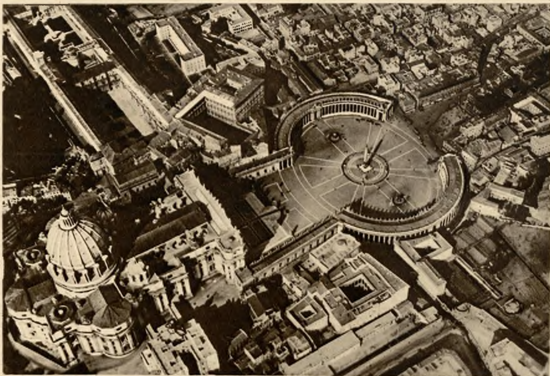
Na lewo: Zdjęcie Watykanu i kościoła św. Piotra dokonane z „Zeppelina“.