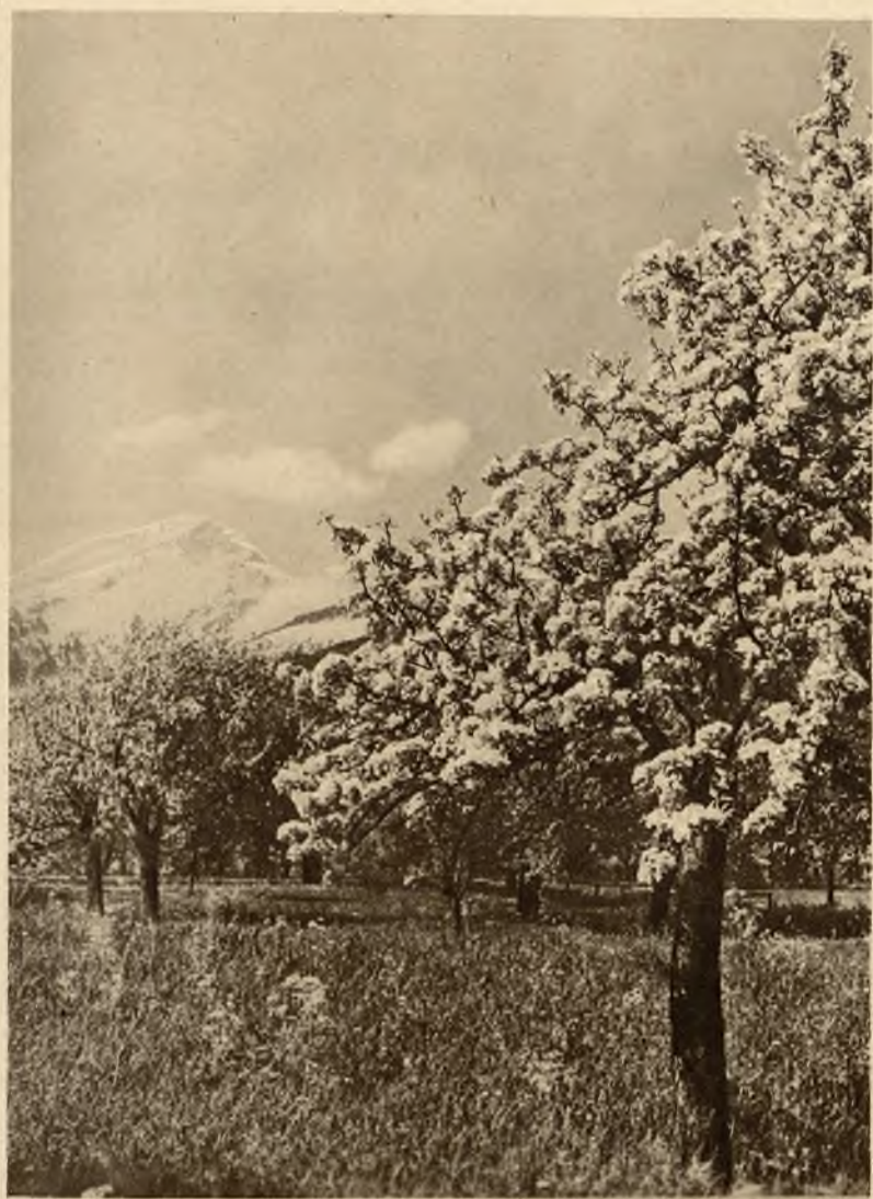
Wiosna w górach.