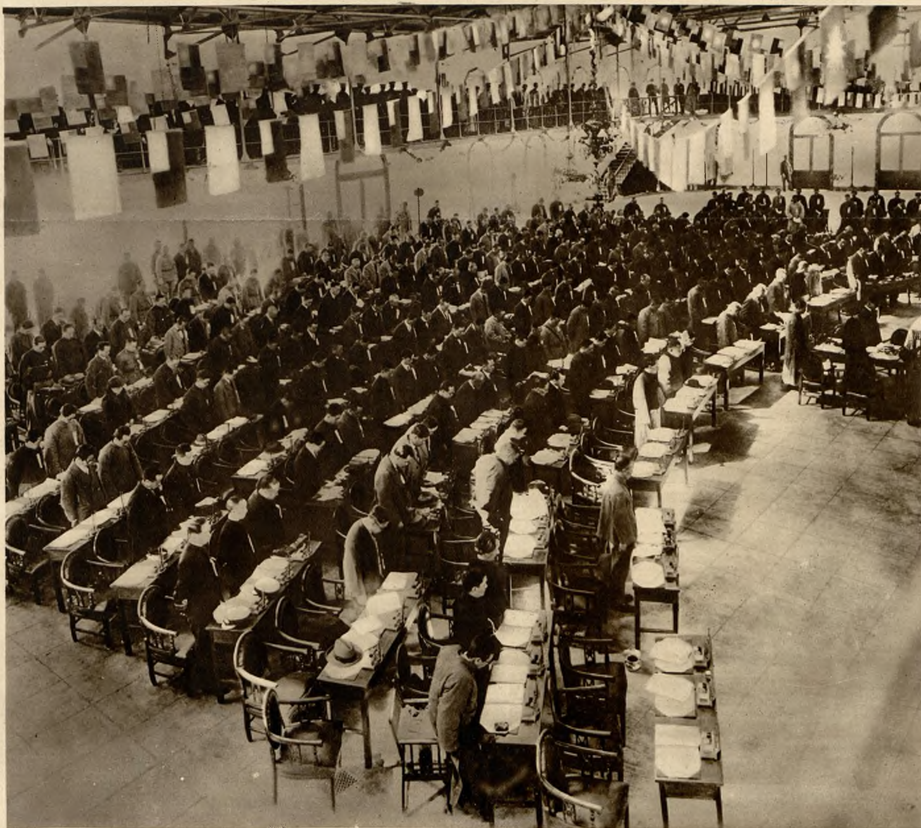
Pierwsze zdjęcie z posiedzenia chińskiego kongresu narodowego w Szanghaju w dniu 20 marca. Moment odczytywania testamentu Sunjatsena, który członkowie kongresu wysłuchują stojąco. W pierwszym rzędzie stoi marszałek Czankajszek.