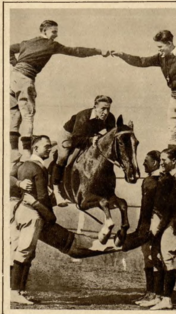
Efektowny skok amerykańskiego kawalerzysty przez żywą bramkę.

Na prawo: W powodzi, która nawiedziła stan Georgia (Ameryka półn.) musiano całe miasta ewakuować z ludzi. Widok miasta West Point, w którym około 100 osób utraciło życie.