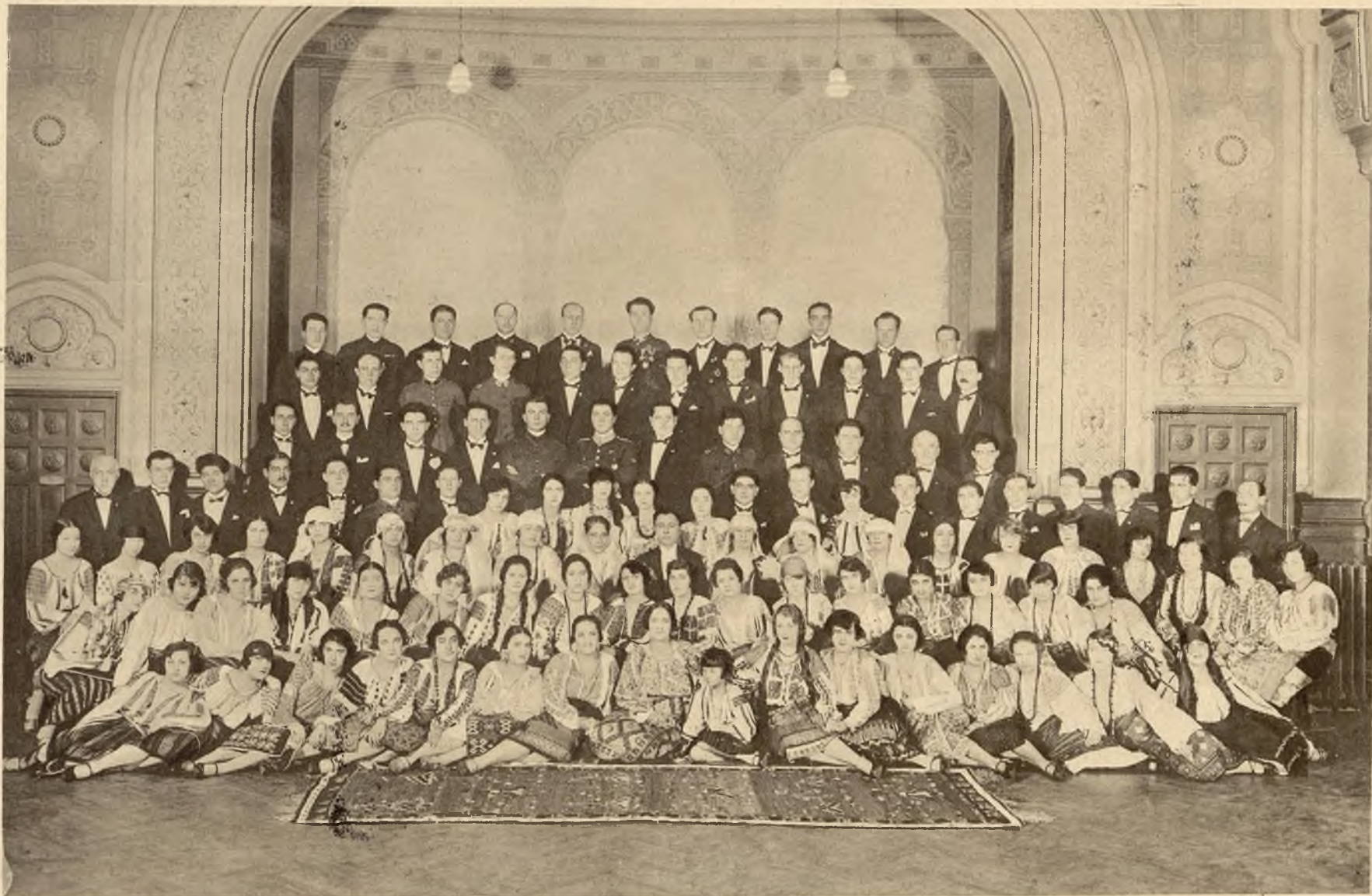
„Cantarea Romaniei“ w swoim triumfalnym tournee po Europie. Znakomity zespół śpiewacki rumuński, który niebawem zagości do Lwowa.