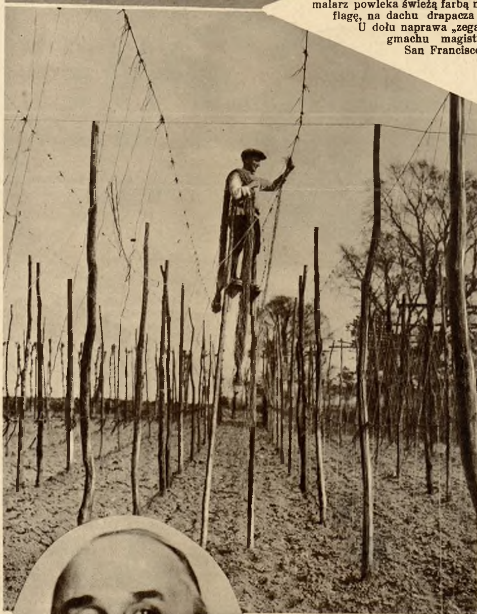
Zdjęcie z pracy na farmie w Teymhan (Anglja) koło uprawy chmielu.