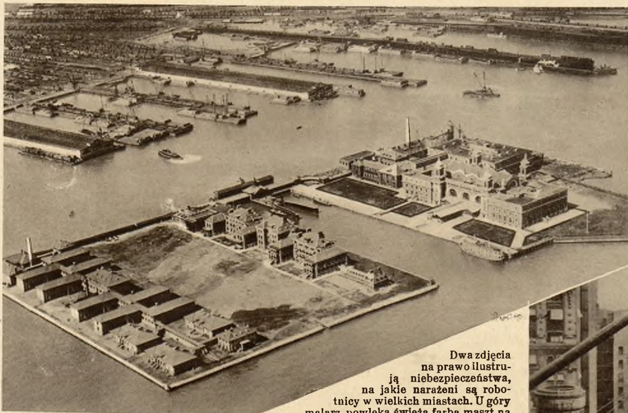
Na lewo: Zdjęcie z lotu ptaka słynnej wyspy Ellis Island koło Nowego Jorku, na której emigranci odbywają kwarantannę.