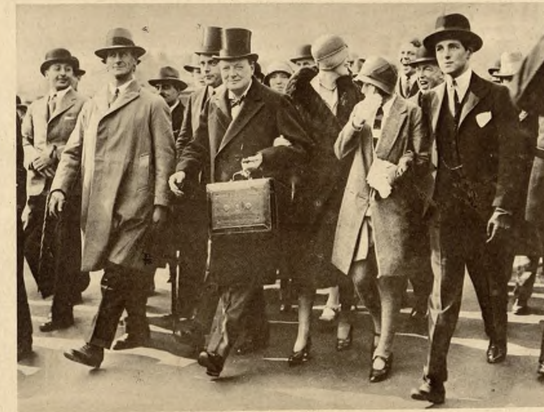
Angielski minister skarbu Winston Churchill, w towarzystwie rodziny, udaje się do parlamentu, celem wygłoszenia swego exposé budżetowego.