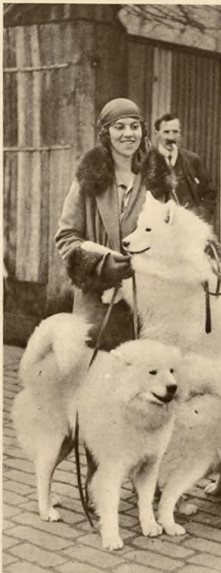
Wspaniałe okazy „Samojedów” nagrodzone na tegorocznej wystawie psów w Londynie.

Na prawo: Chińskie pracznice nad brzegiem rzeki. Nawet podczas wykonywania swej pracy nie rozstają się z dziećmi nosząc je w charakterystycznych gurtach.