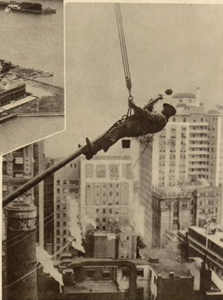
Dwa zdjęcia na prawo ilustrują niebezpieczeństwa, na jakie narażeni są robotnicy w wielkich miastach. U góry malarz powleka świeżą farbą maszt na flagę, na dachu drapacza chmur. U dołu naprawa „zegarka” na gmachu magistratu w San Francisco.