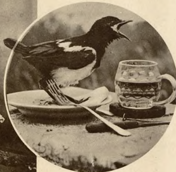
Pierzasty ten gość wydaje z swych ust okrzyk, który w ptasim języku zapewne brzmi: „Dawać jeszcze!”