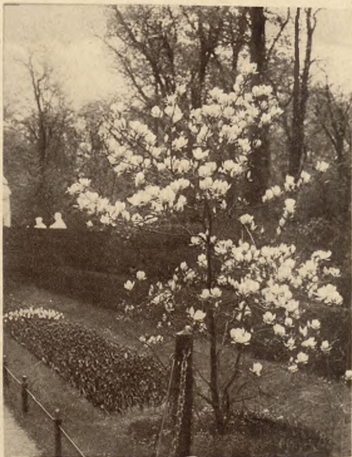
Kwitnące drzewo magnolji jest jakby żywym symbolem wiosny. U dołu: 11-to letni książę Mahomet Reza następca tronu perskiego.