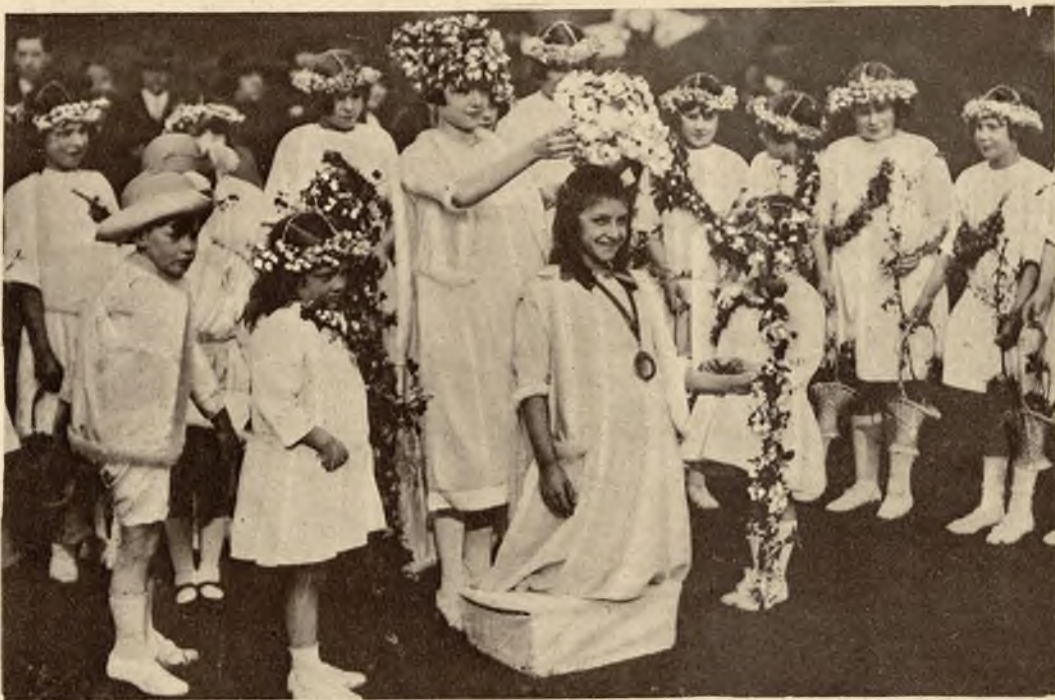
Uroczystość dzieci na cześć wiosny w parku londyńskim. Zeszłoroczna królowa majowa, wkłada koronę z kwiatów na głowę swej następczyni.