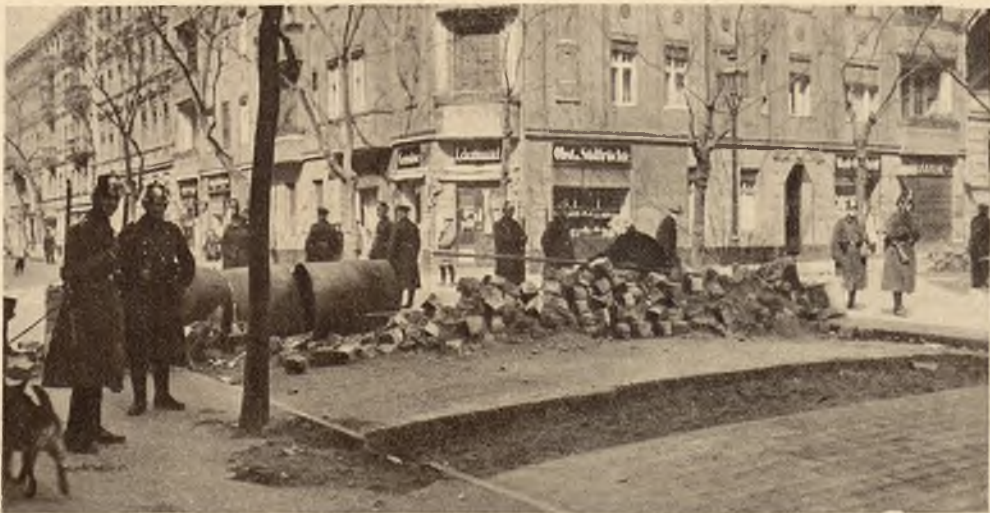
Z berlińskich walk ulicznych w dniu 1 maja. Zdjęcie przedstawia barykadę zbudowaną przez komunistów z kamieni brukowych i z beczek.