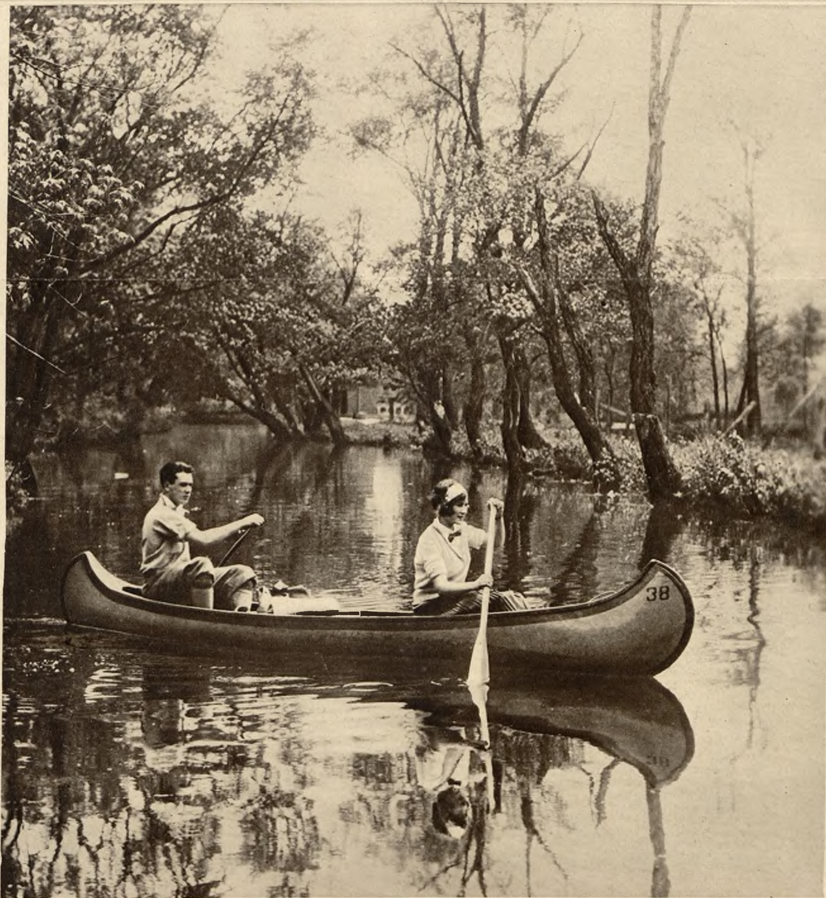
Zagranicą szeroko rozpowszechniony jest zwyczaj spędzania weekend'u na wycieczkach sportowych. Na zdjęciu widzimy młodą parę wyruszającą na oryginalnej łodzi.