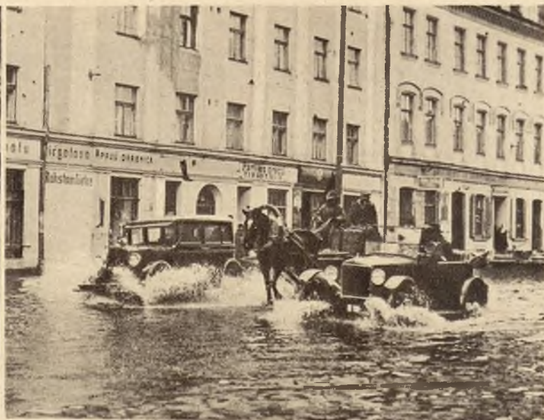
Wskutek silnych deszczów Dźwina pod Rygą wystąpiła z brzegów zalewając niżej położone ulice miasta.