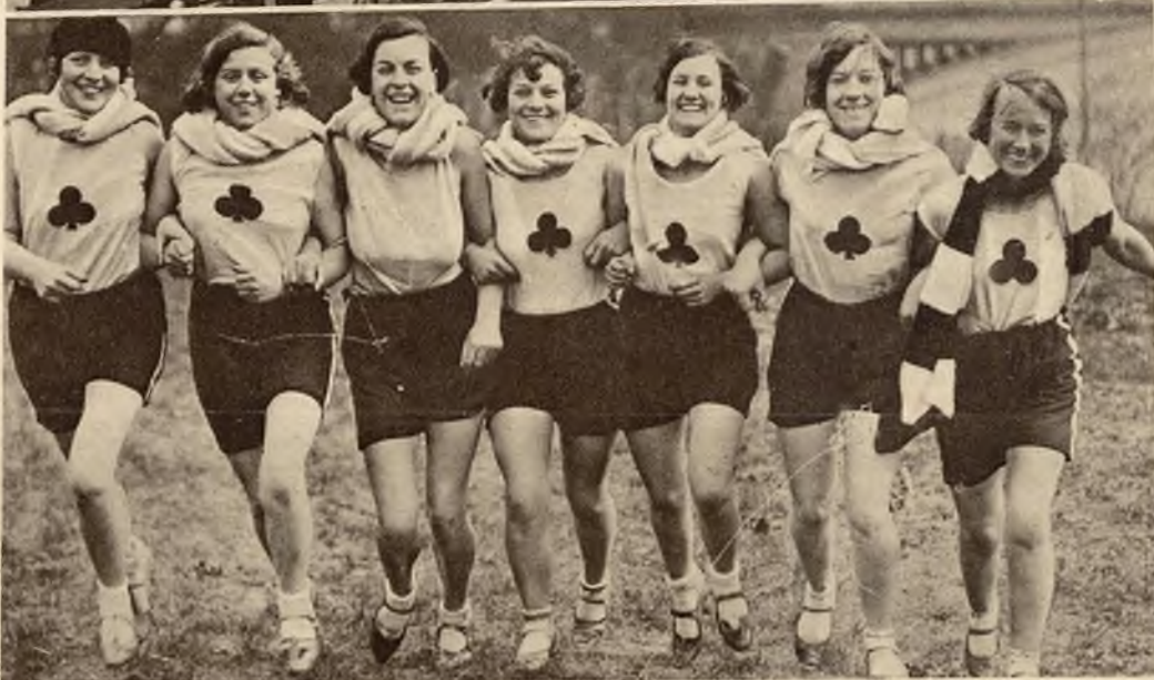
Nowoczesne amazonki rzeczne. Osada wioślarska jednego z klubów kobiecych angielskich udaje się na start.