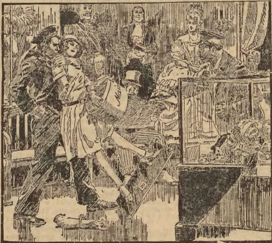
WARJAT W GABINECIE FIGUR WOSKOWYCH.

Berlin, 2. września. (PAT). Wczoraj zmarł w Berlinie historyk niemiecki prof. Edward Meyer w wieku 78 lat. Był on wybitnym badaczem starożytności i autorem licznych dzieł naukowych z zakresu historii starożytnej Grecji, Rzymu, powstania chrześcijaństwa, państwa żydowskiego itd.