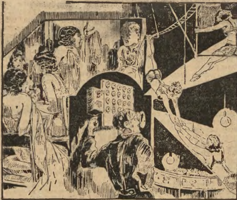
TRAGEDJA TRZECH AKROBATEK.

Lwów, Rynek 9. Tel. 35-83 Filja Kochanowskiego 11. Tel. 33-90.