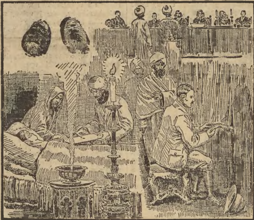
ODCISK PALCA NIEBOSZCZKI.