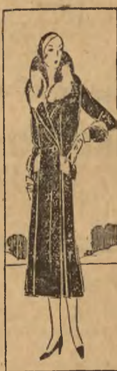
1) Kapelusze od czola z filcu czarnego, przybrany kokardą z aksamitu. 2) Kapelusze popołudniowy z czarnego filcu inkrustowany brązem i szmaragdem. 3) Elegancki płaszcz z aksamitu angielskiego przybrany futrem, kapelusze od czola z tego samego materiału.