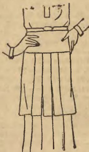
Spódnica w formie antycznego pepłum.

becnej modzie. Styl antyczny objawia się w sposobie ściągania fałdów, w tunikach, kasaki przypominają rosyjskie stroje ludowe. podniesienie stanu powyżej