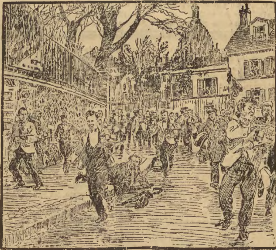
WYŚCIGI KELNERÓW PARYSKICH. (Do artykułu na str. 10-tej).

Bordeaux, 17 listopada. (PAT.) Arrestowano tu notariusza, który dokonał nadużycie na sumę 4 miliony fr.