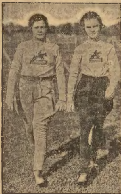
Tak się nazywa nowy rodzaj sweatru, ogromnie modnego obecnie w Ameryce.