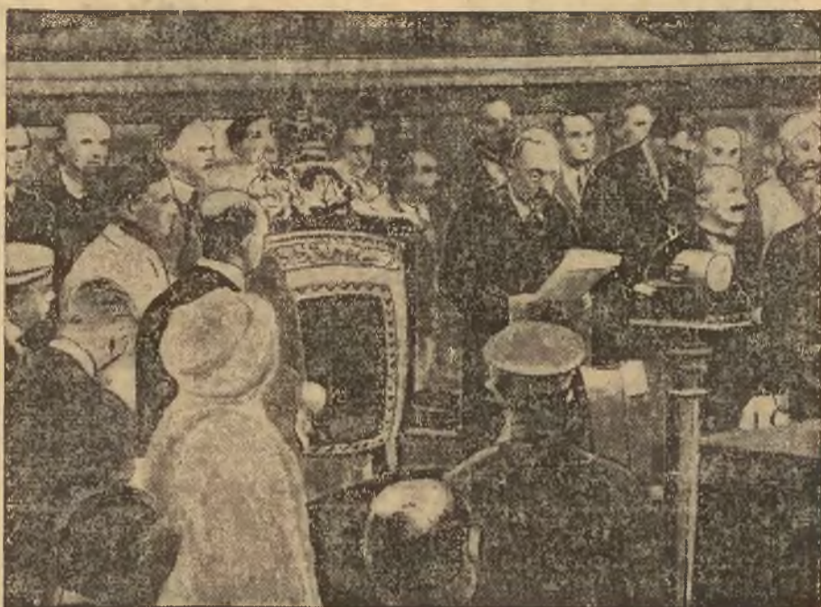
Król Jerzy dokonał uroczystego otwarcia Konferencji angielsko-Indyjskiej, której zadaniem jest załatwienie szeregu zagadnień, wynikających z obecnej sytuacji w Indiach. Król angielski z naciskiem określił konferencję jako pierwsze zetknięcie się na „równych prawach“ polityków angielskich i indyjskich.

resem cudzoziemca jakiegoś pogardliwe słowo , na które Casanova zareagował jeszcze ostrzej . Druga wersja mówi o konflikcie na tle miłosnem . Mianowicie Casanova miał zyskać względy wytwornej i pięknej damy , która była kochanką magnata.