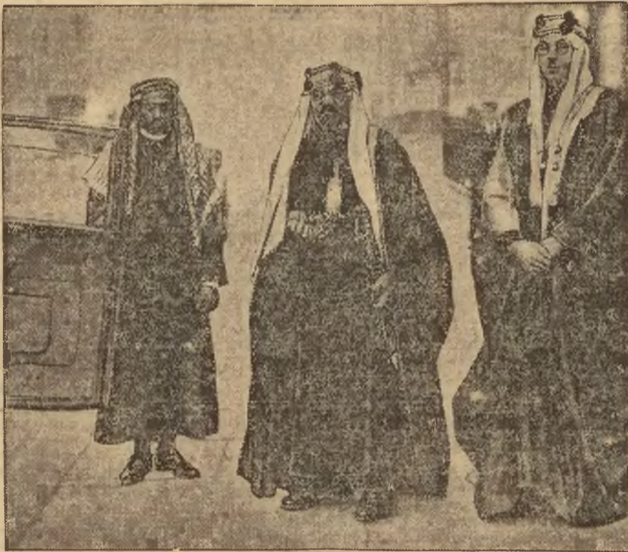
Rycina nasza przedstawia Szchika Haliza Wahbę, pierwszego posła arabskiego królestwa Hedżasu i jego dwóch sekretarzy — po przyjęciu u króla angielskiego.