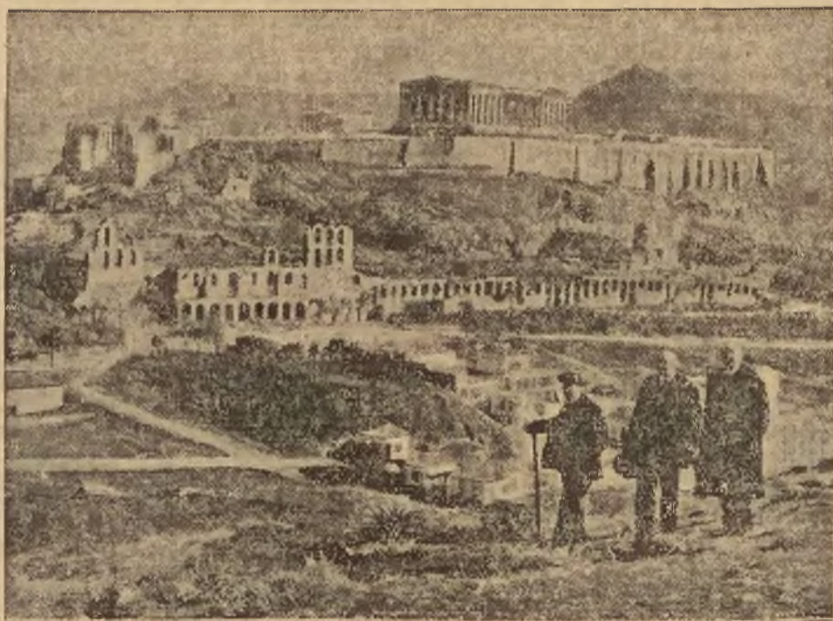
Sławna Akropolis ateńska, cel wędrowek tysięcy pielgrzymów z całego świata, znajduje się obecnie w wielkim niebezpieczeństwie. Wspaniałe to arcydzieło architektury zaniedbano zupełnie tak, że grozi ono rozpnięciem się w gruzy. Archeologowie angielscy i francuscy zaprotestowali energicznie u rządu greckiego z powodu tego niesłychanego zaniedbania.