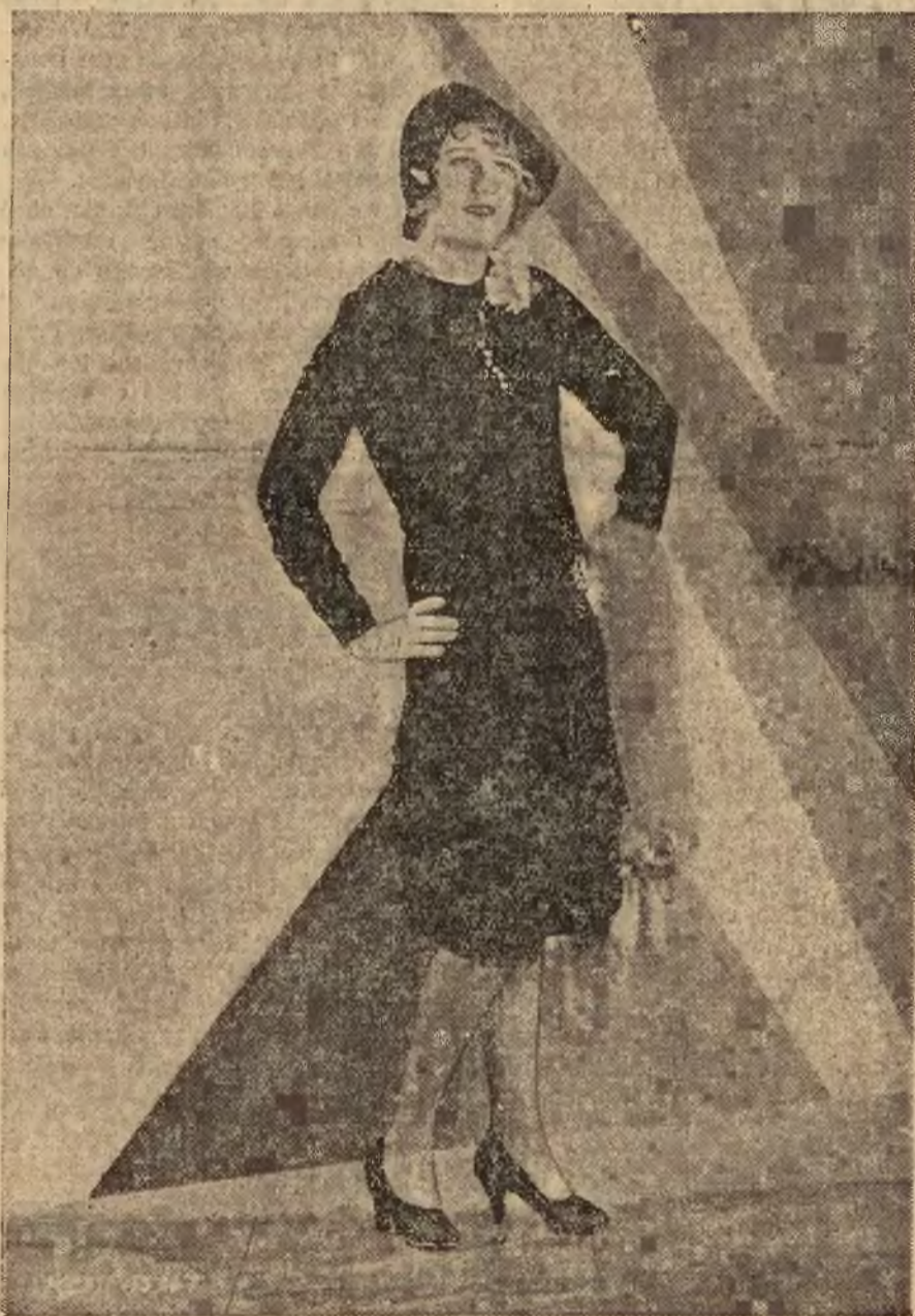
ANITA PAGE, młodzianka artystka Metro-Goldwyn-Mayer awansowała w ostatnich dniach na gwiazdę i odtąd występować będzie tylko w głównych rolach.

Na zakończenie dodał Berger, że amerykańska produkcja filmów dźwiękowych o dużo wyprzedziła europejską i upłynie jeszcze dużo czasu, zanim Europa dojdzie do tej doskonałości, jaką posiadają atelier w Hollywood.