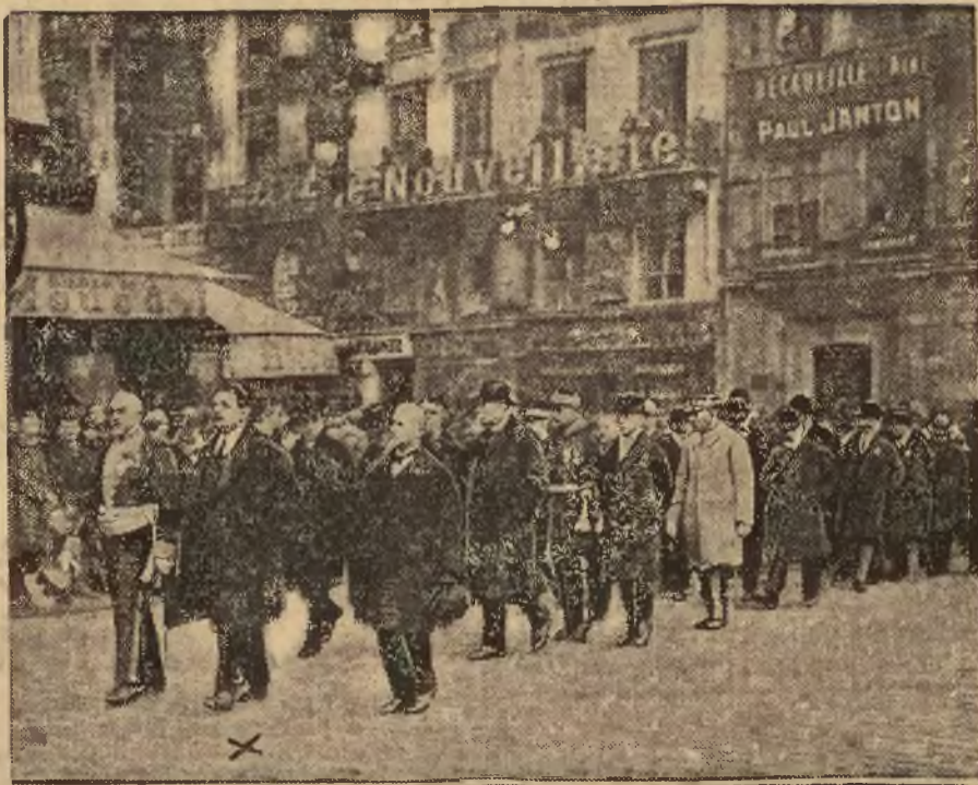
Rycina nasza przedstawia żalobny pochód pogrzebowy ofiar katastrofy lyońskiej, o której pisaliśmy już obszernie. W pierwszym rzędzie, w środku — Herriot, były premier, obecny burmistrz Lyonu.