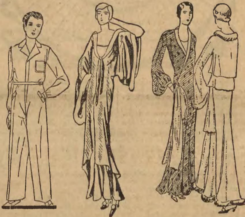
1) Praktyczna pyjama. 2) Eleganckie „tea gown”. 3) Szykowny szlafroczek z miękkiej flanelki. — Wytworna suknia domowa.