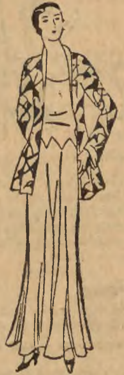
Toaleta domowa z wzorzystym kaftanikiem.