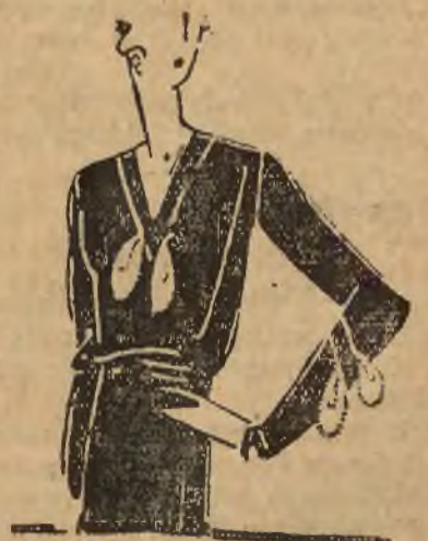
Modne garniowanie szafi i rakorów.