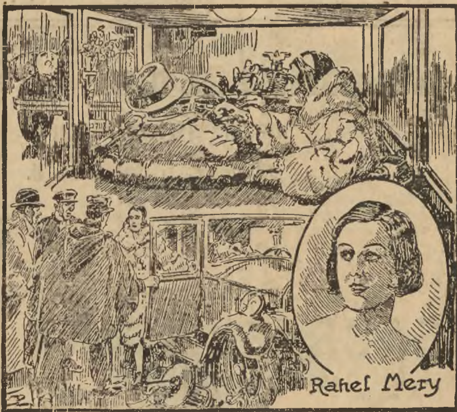
ZEMSTA RACHELI. (Do artykułu na str. 9-tej.)

Warszawa, 20 grudnia. (st). W Czarnkowie na Pomorzu od kilku miesięcy zdarzają się kilka razy tygodniowo śmiałe włamania do większych sklepów. Podjęte przez władze policyjne dochodzenia doprowadziły do sensacyjnych wyników. Okazało się, że sprawcą kradzieży była szajka złożona z 6 uczniów miejscowej szkoły powszechnej, przyczem najstarszy z nich był hersztem, liczył lat 11. Młodocianych złodziei, którzy przyznali się do kradzieży, ułokowano w domu poprawczym.