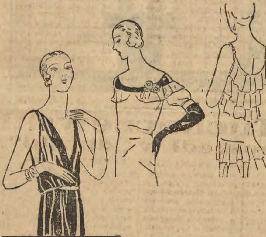
MODNE DEKOLTAŻE: 1) Niskie wycięcie w zab. 2) Wycięcie okrągłe, otoczone plisą z wypuszczonym wolantem. 3) Dekoltaż płasowy, od którego wychodzą 3 kondygnacje wolantów.