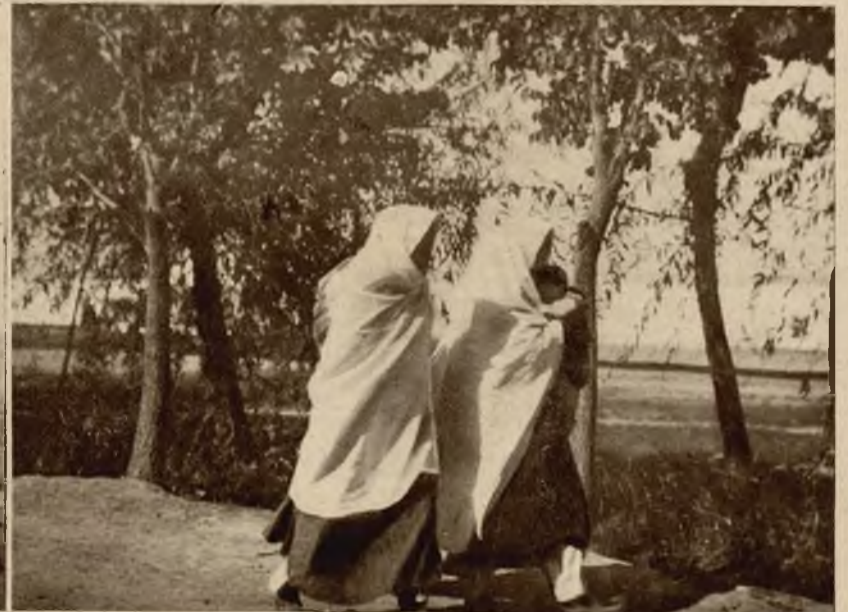
Obrazki z Afganistanu. Na lewo budynek rady miejskiej w Darul Aman zbudowany przez b. króla Amanullaha. Na prawo zakwiefione Afganki na „ulicy“ Kabulu, stolicy państwa.