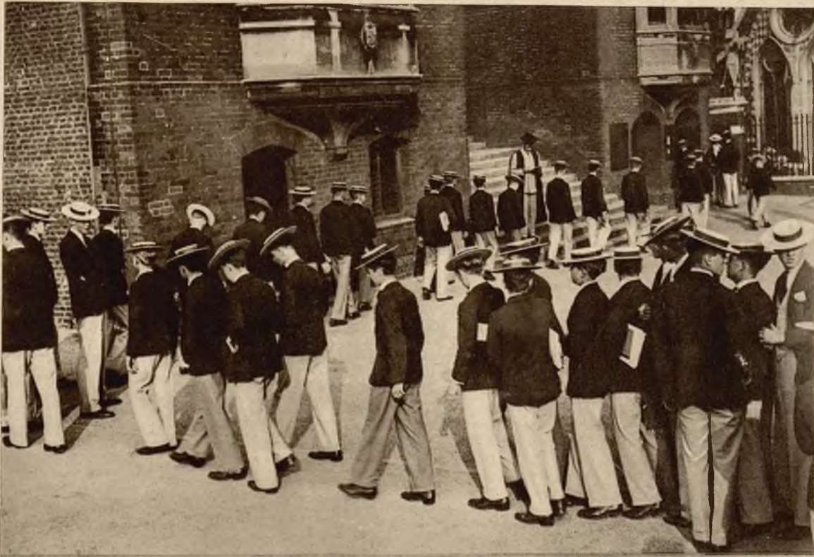
Obrazek z rozpoczęcia roku szkolnego w słynnym kolegium angielskim w Harrow.