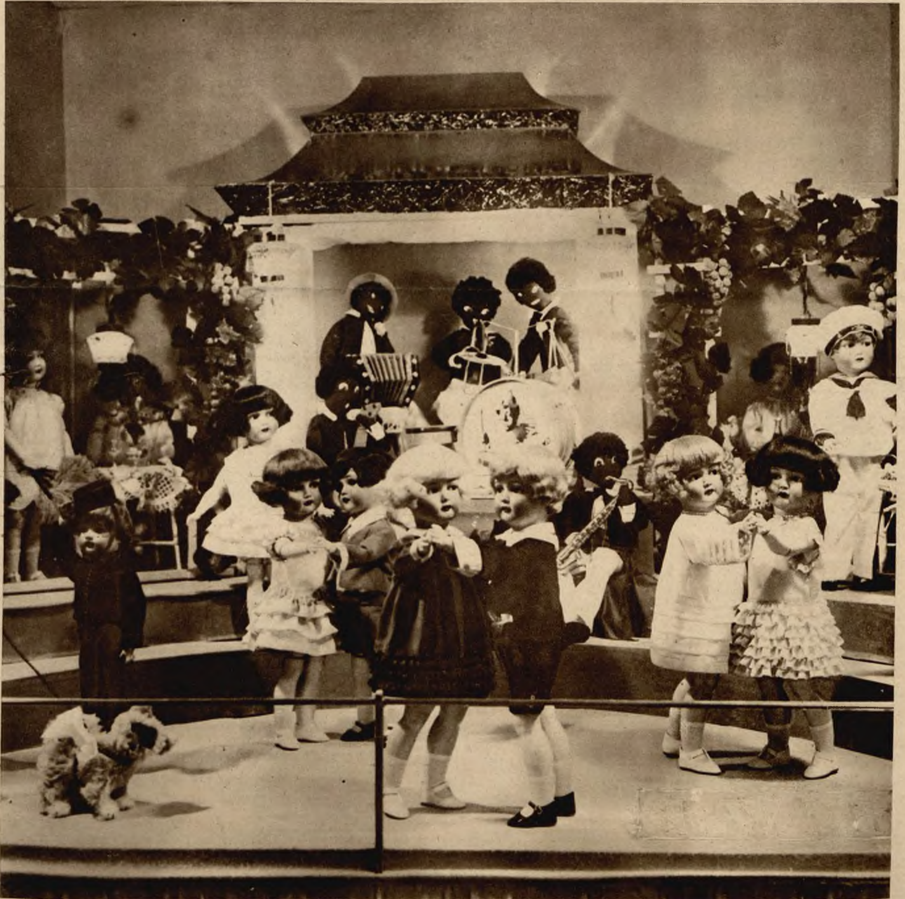
Uroczna wystawa lalek znajduje się na tegorocznych targach koronek w Berlinie.