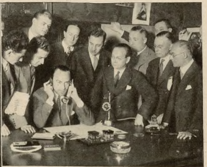
Bawiący obecnie w Berlinie Conrad Veidt uzupełniał telefonicznie, niewyróżnione słowa filmu dźwiękowego, nagranych przez niego podczas pobytu w Ameryce.