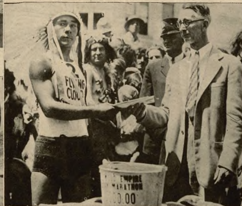
Młody sportowiec indyjski zwycięzca w biegu maratońskim przyjmuje nagrodę z rąk burmistrza.