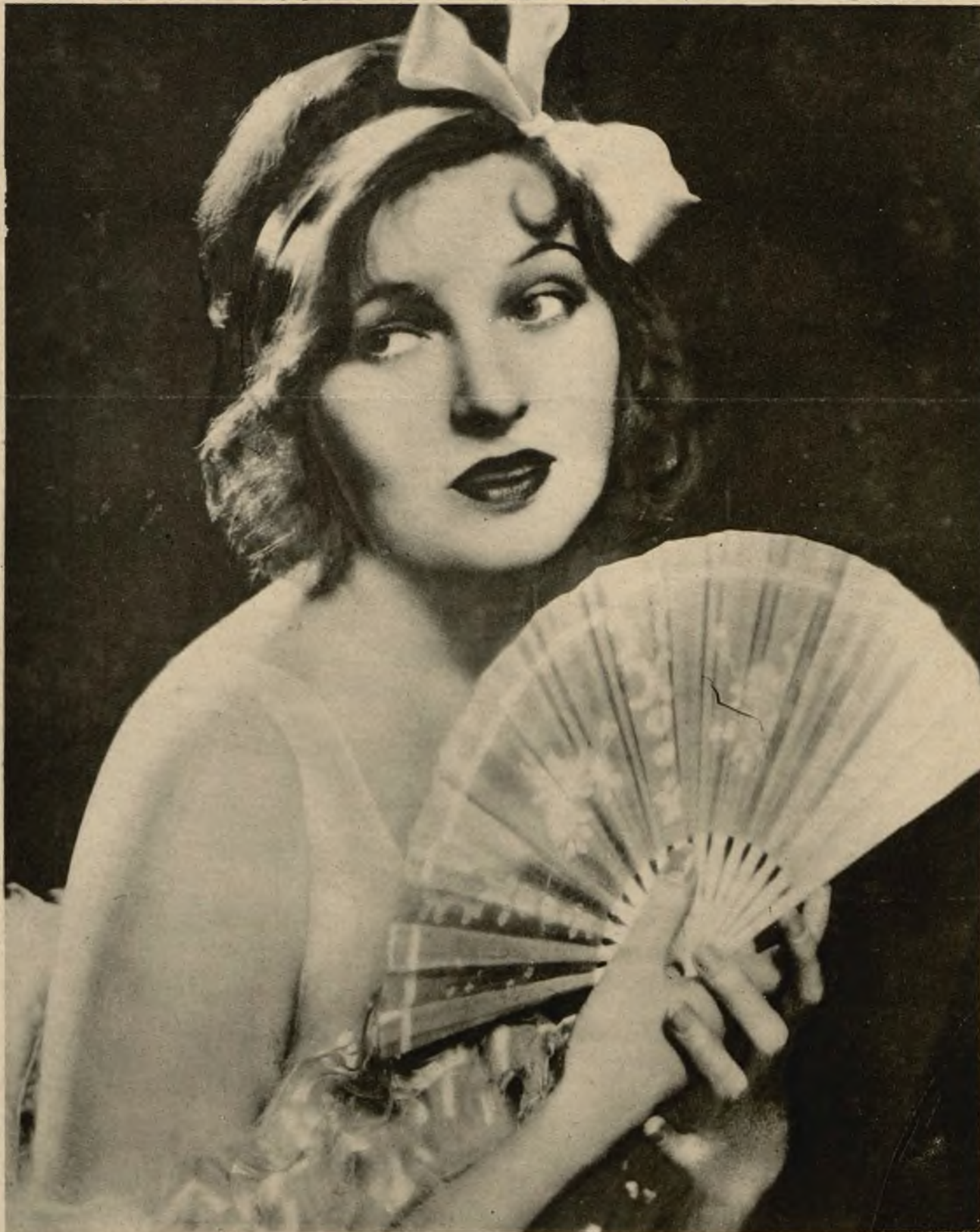
Corinne Griffith uchodząca za jedno z najpiękniejszych i najwdzięczniejszych zjawisk srebrnego ekranu.