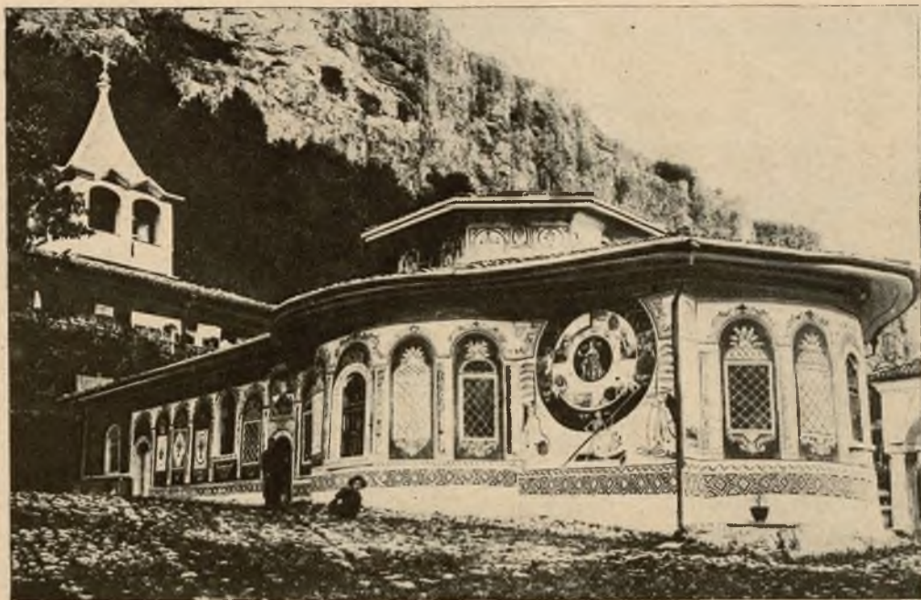
Stary klasztor Preobrażeński niedaleko miasta Timoro w Bułgarii wybudowany jest na dzikich skałach i zdaleka widać jego pstro pomalowane mury.