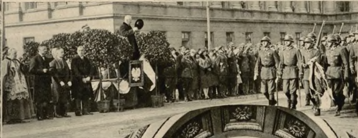
Defilada Of. Szkoły Inżynierji przed p. Prezydentem z okazji wzięcia sztandaru.