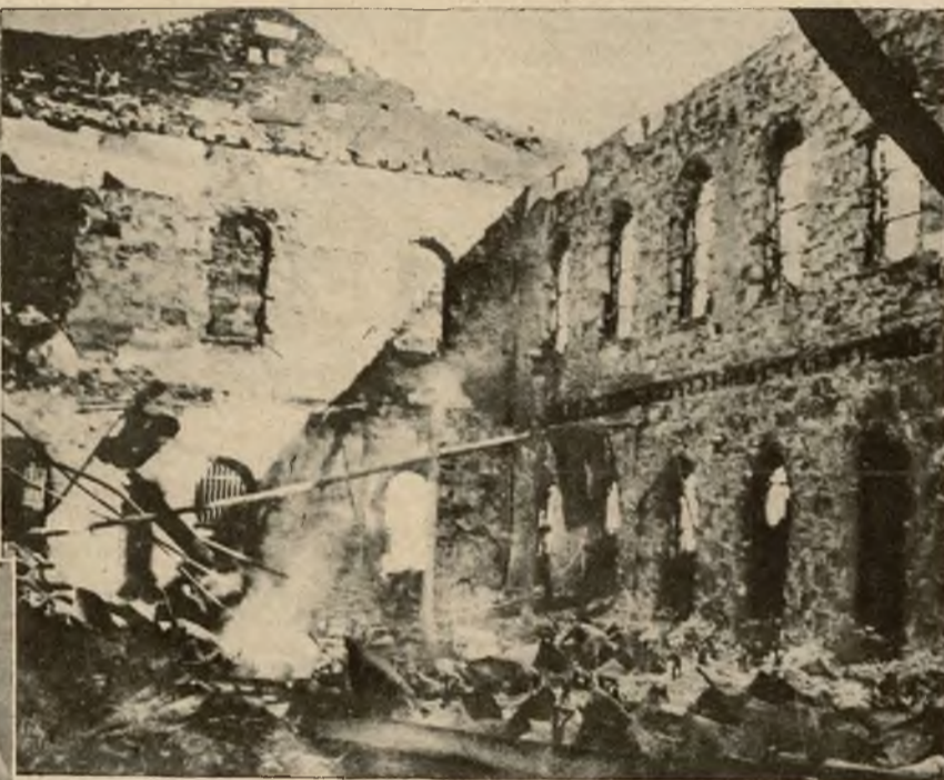
W więzieniu Canon City (Ameryka) wybuchł wielki bunt. Więźniowie zabili dozorców i opanowali gmach i dopiero wojsko przy użyciu armat zdołało stłumić rewoltę. Podczas walki zginęło 13 osób a pożar zniszczył mury.