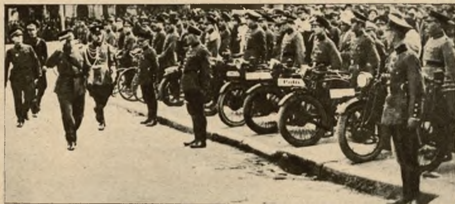
Policja turecka została zupełnie zmodernizowaną i wyposażoną w pierwszorzędne motocykle na wzór amerykańskiej.