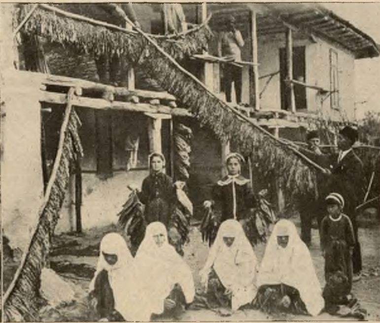
Obrazek rodzinny z bułgarskiej Macedonji, gdzie prawie cała ludność zajmuje się uprawą tytoniu. Także wszyscy członkowie tej rodziny trudnią się suszeniem i obróbką tej rośliny.