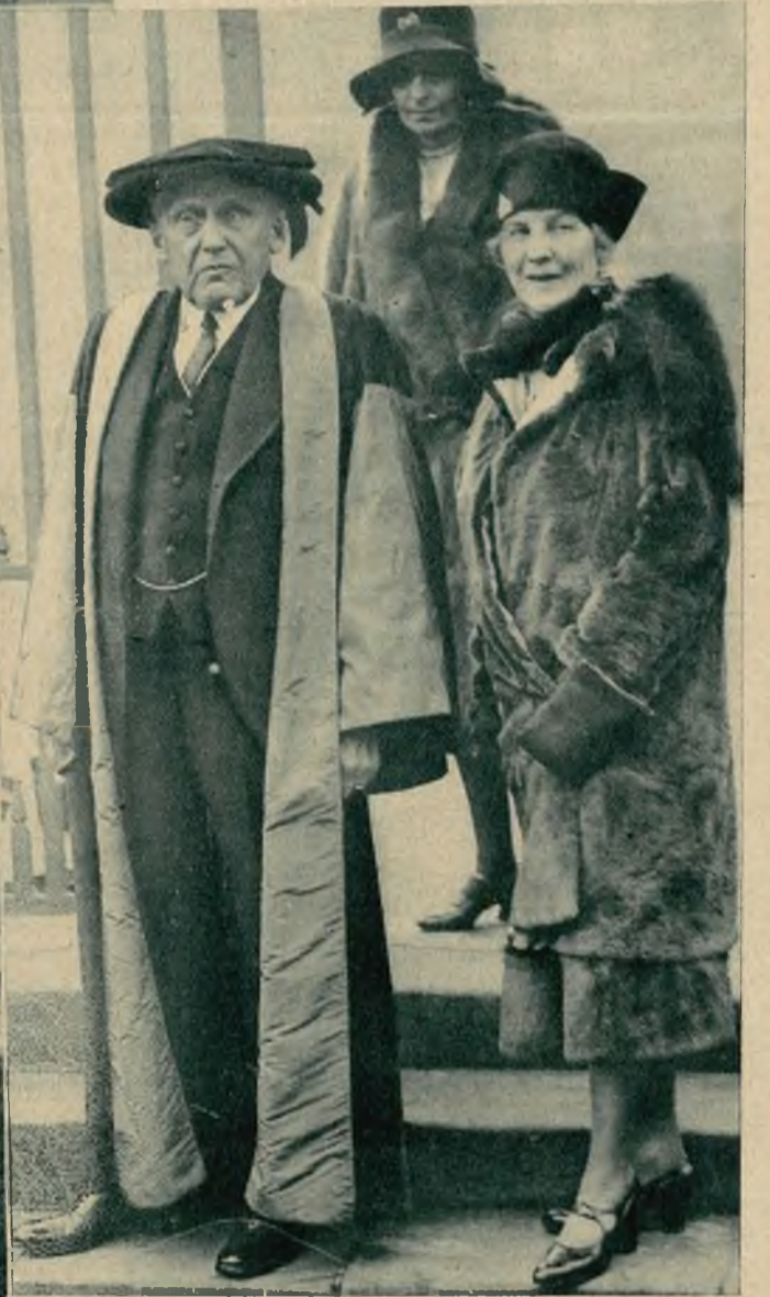
Mr. Frank B. Kellog sławny autor sławnego paktu został honorowym członkiem uniwersytetu w Oxfordzie.