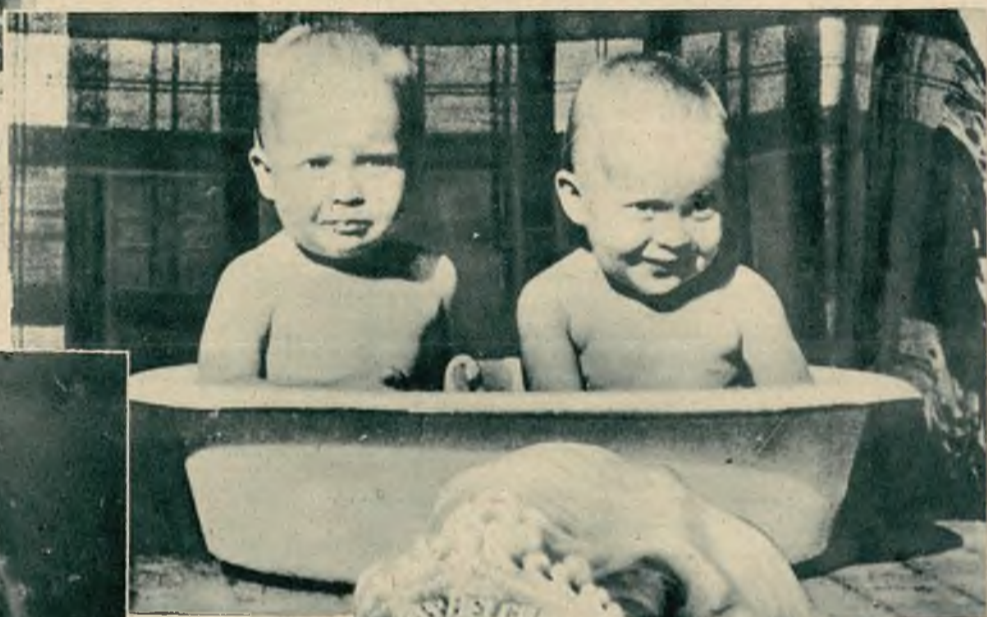
Bliźniaki w kąpielni.

Ciężką poranną troską pięknej gwiazdy filmowej Billie Dove jest dobór odpowiednich do nastroju perfum.