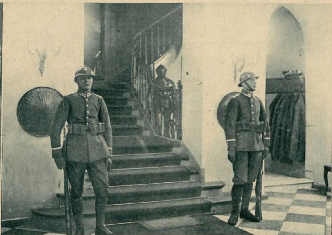
Dnia 29 listopada jako w 99 rocznicę powstania listopadowego tradycyjnym zwyczajem wartę w Belwederze zaciągnęli podchorążowie ze Szkoły Podch. w Ostrowi mazowieckiej. Pluton wartowniczy przybył do Belwederu ze sztandarem i orkiestrą. Zdjęcie nasze przedstawia podchorążych, stojących na warcie w hallu w Belwederze.