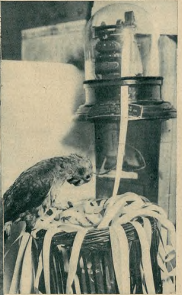
Papuga która obsługuje aparat telegraficzny jest doskonałą pomocnicą swego właściciela urzędnika pocztowego w jednej z wsi angielskich.