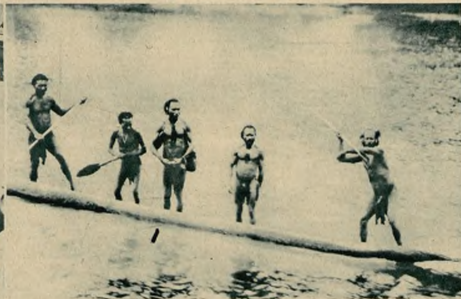
Połów ryb na Nowej Gwinei odbywa się na kajakach zbudowanych z kłody drzewa.