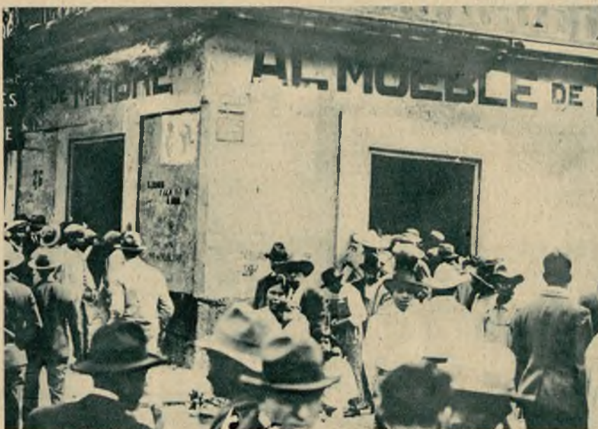
Podczas wyborów prezydenta Meksyku nie obeszło się bez krwawych scen przyczem zabito 20 osób.