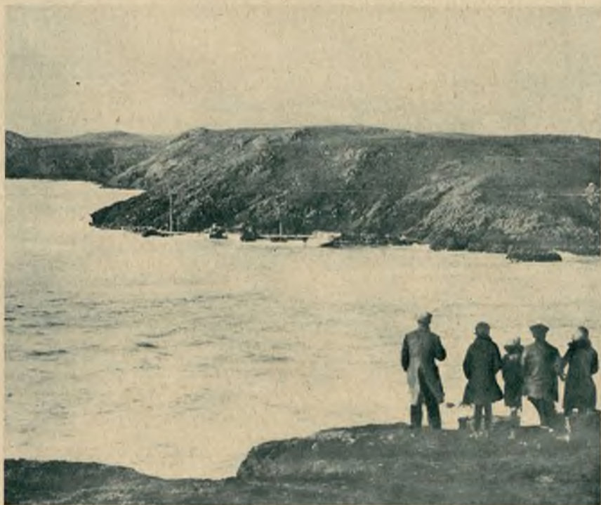
Koło wybrzeża angielskiego zatonał parowiec „Molesey” w drodze z Manchester do Cardiff. Podczas katastrofy zginęło 8 osób.