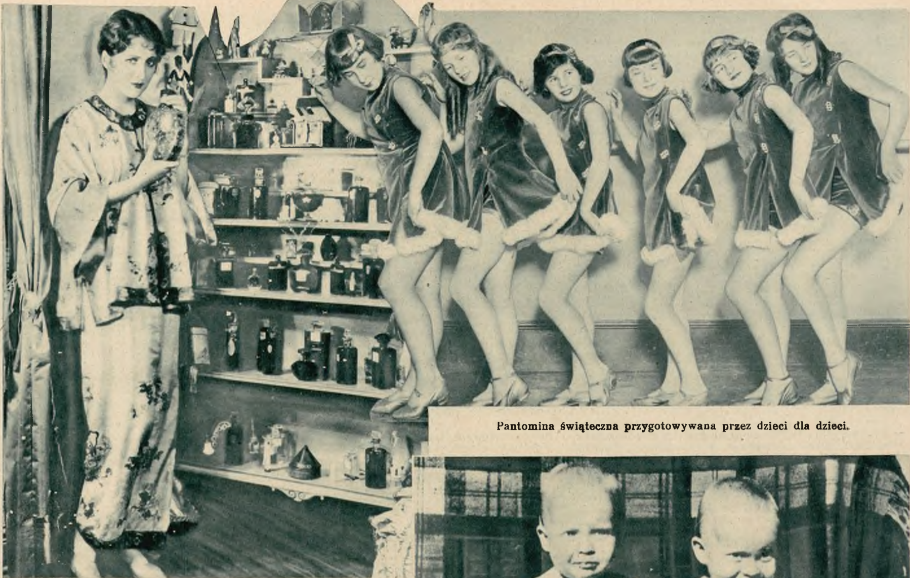
Pantomina świąteczna przygotowywana przez dzieci dla dzieci.

Ciężką poranną troską pięknej gwiazdy filmowej Billie Dove jest dobór odpowiednich do nastroju perfum.