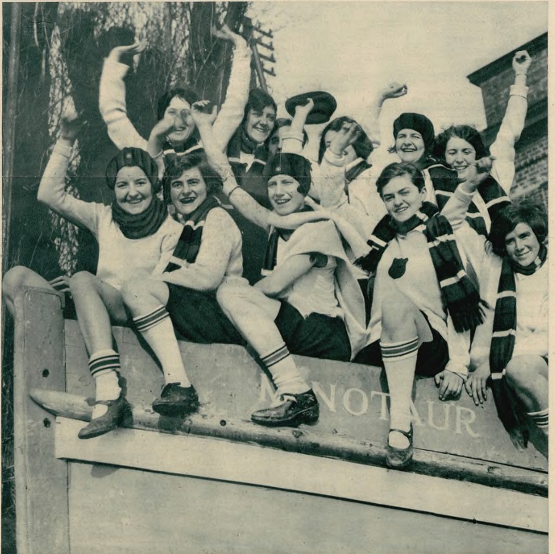
W Anglii mimo spóźnionej pory sezon lekkoatletyczny trwa. Oto grupa wesołych Angielek z klubu „Alfa“, biorących udział w ogólnobrytyjskim biegu na przelaj.