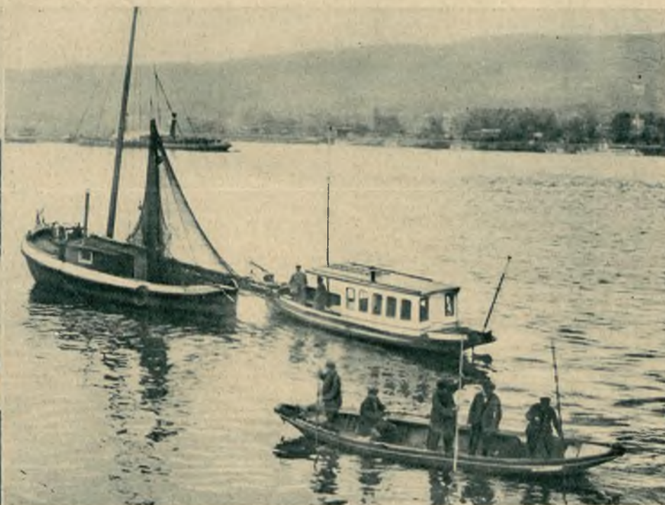
Wskutek mgły auto jadące wzdłuż brzegów Renu wpadło do rzeki i jadący w niem lekarze z Koblencki zginęli. Zdjęcie przedstawia poszukiwania za zaginionym autem.