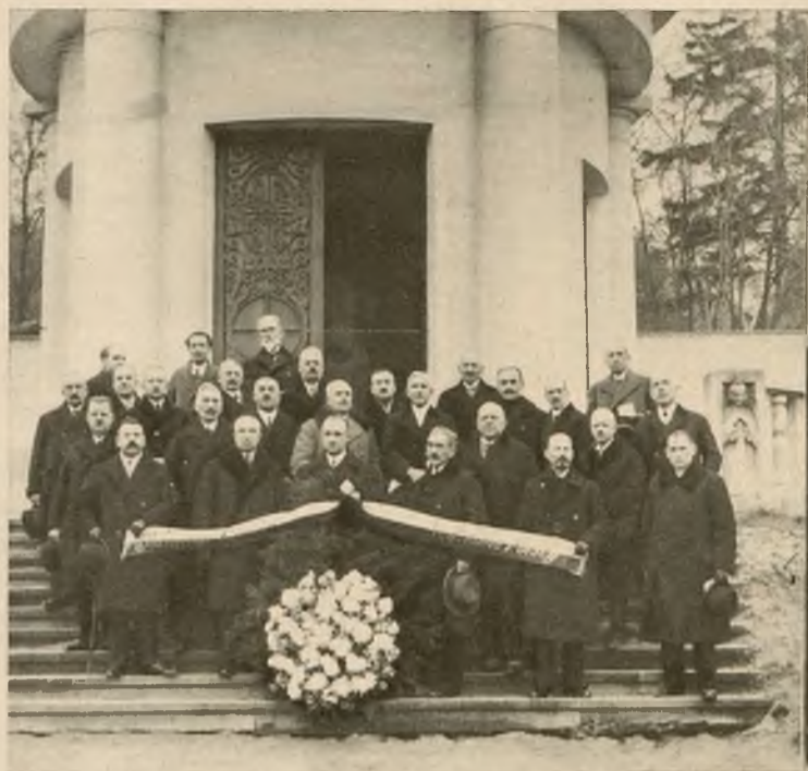
Uczestnicy Zjazdu zrzeszenia sędziów i prokuratorów z całej Polski we Lwowie złożyli wieniec na cmentarzu Obrońców Lwowa.