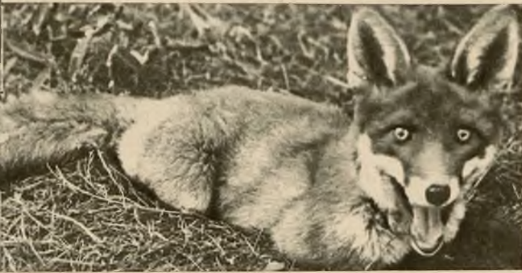
Niezwykłe zdjęcie lisa wężącego niebezpieczeństwo, dokonane z małej odległości.