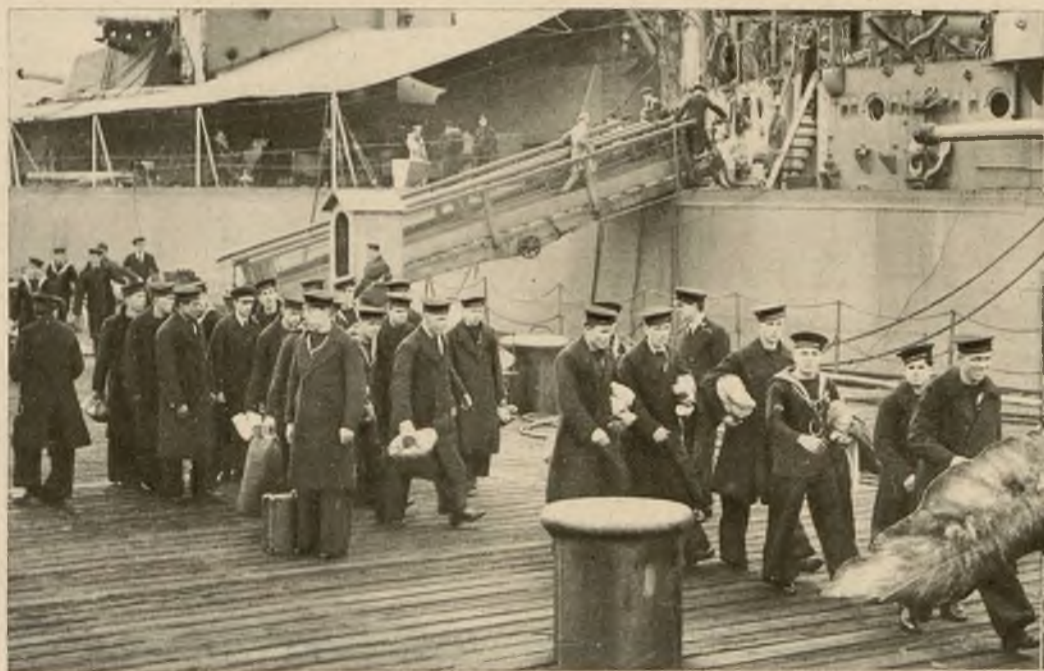
Marynarze angielscy którzy otrzymali urlopy na święta, przybyli już do ojczyzny.