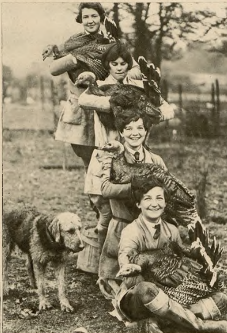
Na farmach hodowlanych drobiu w Anglii przygotowują się już do świąt. Oto kilka pracownic z okazowymi indykami.