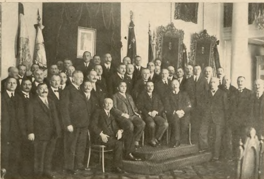
Uroczyste otwarcie Izby rzemieślniczej Wojew. lwowskiego odbyło się w sali Rady miejskiej we Lwowie.