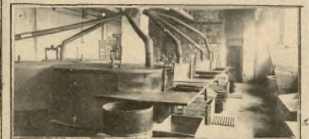
HALA PIECÓW WAFLOWYCH.