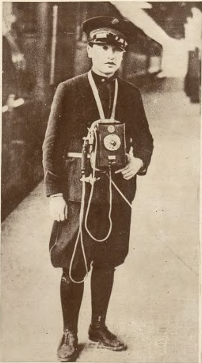
Praktyczną nowość wprowadzono na kolejach włoskich: przenośne telefony na dworcach dla wygody podróżnych.