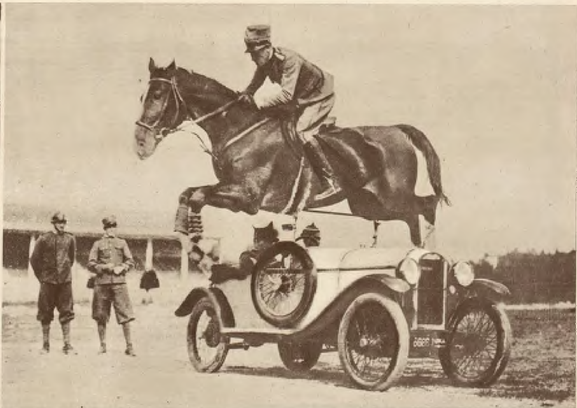
Scena z popisów kawalerji włoskiej w Rzymie: oficer przeskakuje przez auto w czasie jazdy.