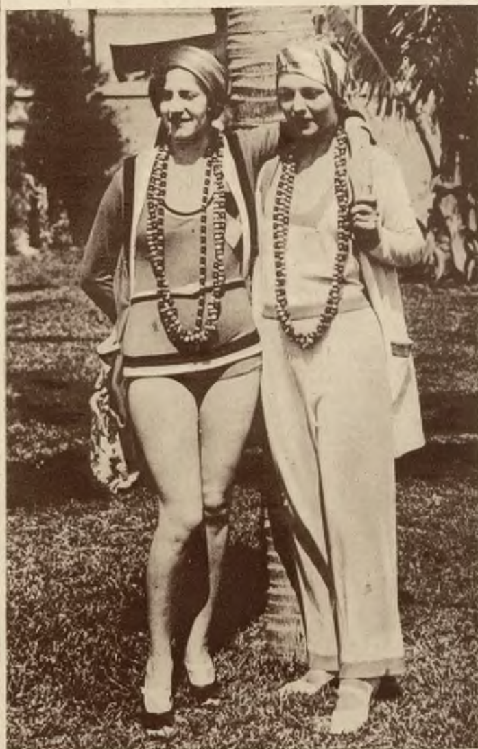
Panie z towarzystwa nowojorskiego w oryginalnych kostjumach plażowych w Palm Beach na Florydzie.