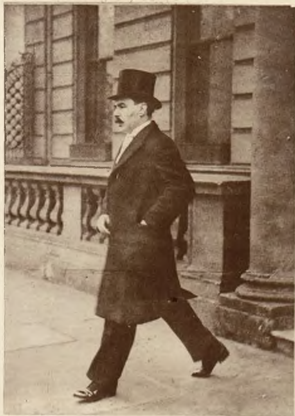
M. Sokolnikow, ambasador sowiecki w Londynie opuszcza pałac Buckingham po przyjęciu u króla. Jest to pierwszy urzędnik sowieców przyjęty przez króla angielskiego.