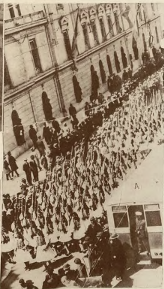
Uroczysty pochód wojsk greckich w tradycyjnych strojach, na ulicach Aten w dzień setnej rocznicy odzyskania niepodległości.