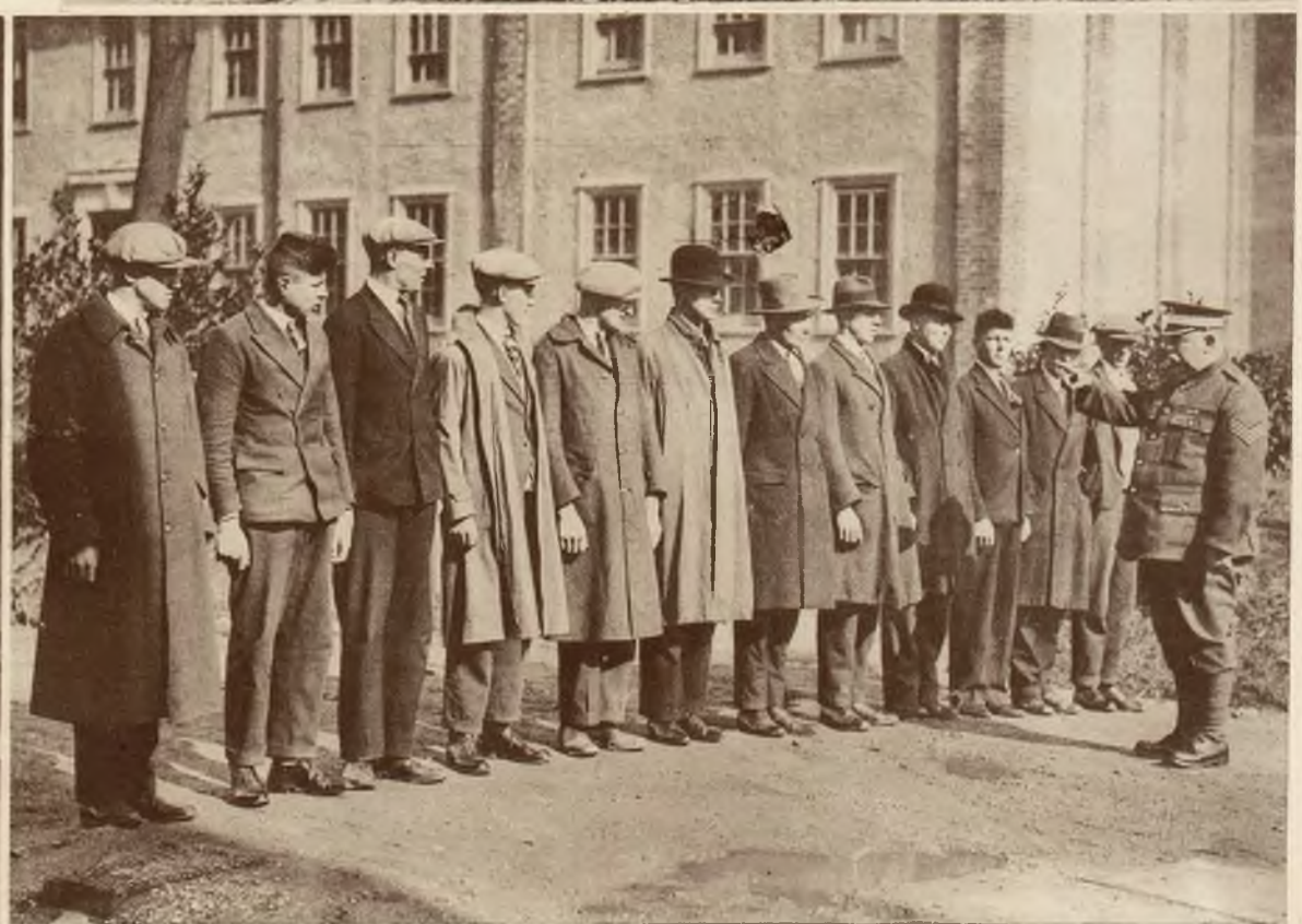
Grupa rekrutów-ochotników wstępujących do słynnej angielskiej gwardji królewskiej, znanej z doborowego materiału żołnierskiego.