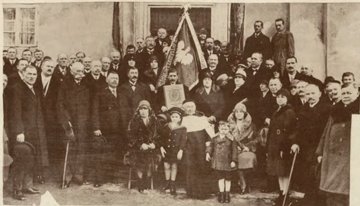
Na lewo: Poświęcenie sztandaru stowarzyszenia murarzy i cieśli we Lwowie.