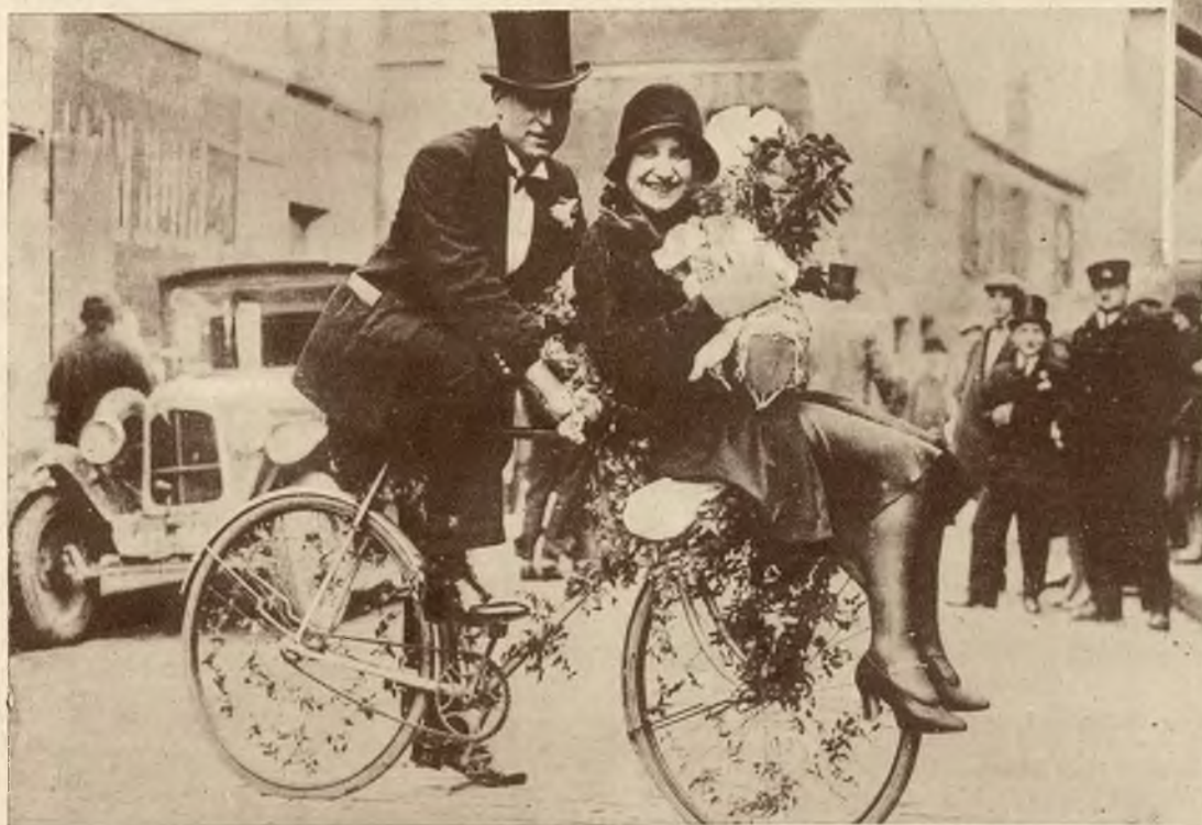
Paryski roznosiciel gazet opuszcza po ślubie kościół wraz z swą małżonką na rowerze.