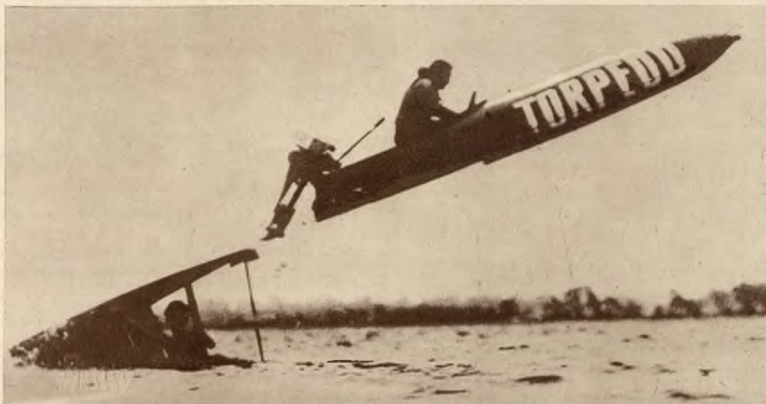
Skok przez przeszkodę na wyścigowej łodzi motorowej jadącej z szybkością 50 km. w godzinie.