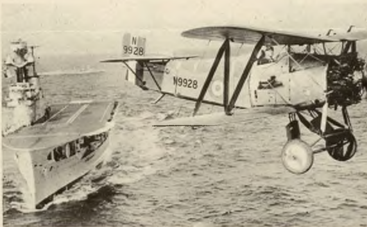
Samolot marynarki angielskiej startujący z pokładu statku macierzystego „Eagle”.