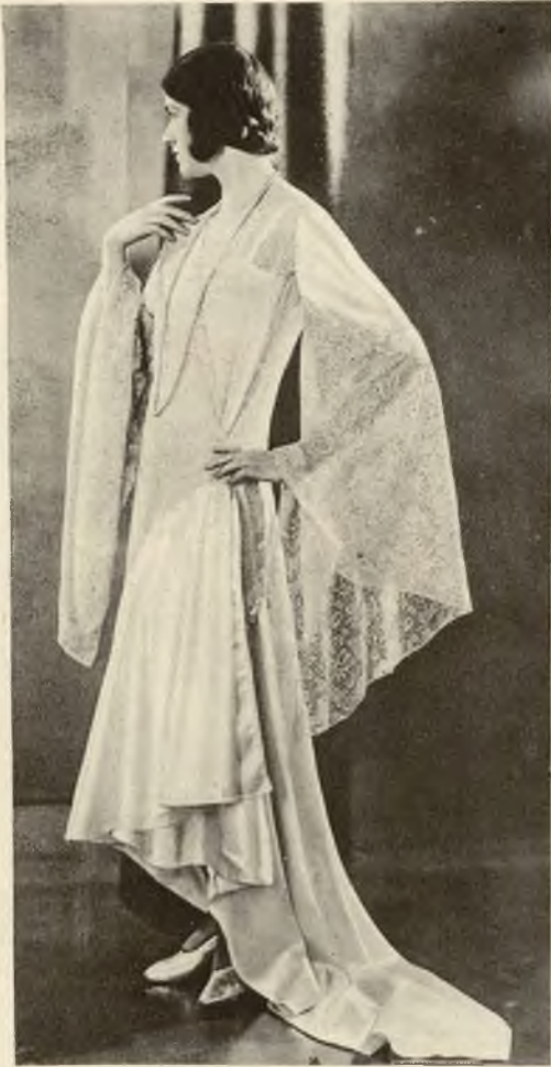
Piękna suknia popołudniowa, atlasowa w odcieniu cytrynowym, ozdobiona koronkami.