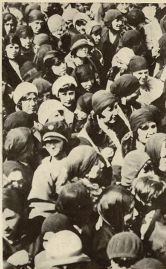
Na prawo: Fragment tłumy kobiet tureckich biorących udział w zgromadzeniu przedwyborczym w Konstantynopolu.