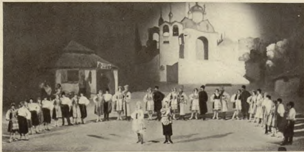
Balet rosyjski na łyżwach w berlińskim pałacu sportowym.