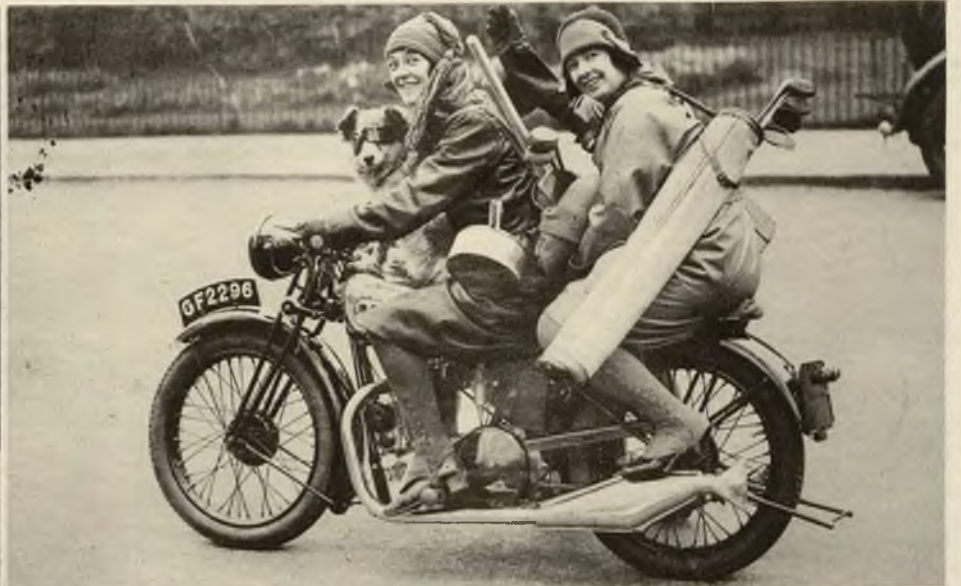
Dwie motocyklistki wyruszające na „camping“ świąteczny z Londynu, nie omieszkały zabrać ze sobą przyborów do golfa, sportu w Anglii coraz popularniejszego, a u nas wciąż nieuprawianego.

Na lewo: Jajo wielkanocne z czekolady jest smaczne ale pozostawia po sobie zdradzieckie ślady.