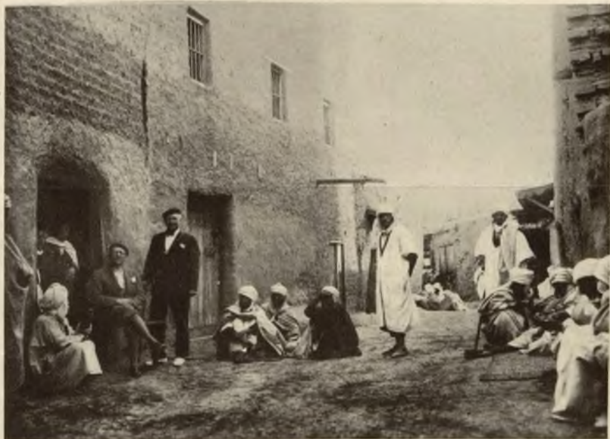
Uliczka w Sidi-Okba, w której Arabowie siedzą beczynnym przed domami. Jest to przeważnie ich główne zajęcie.