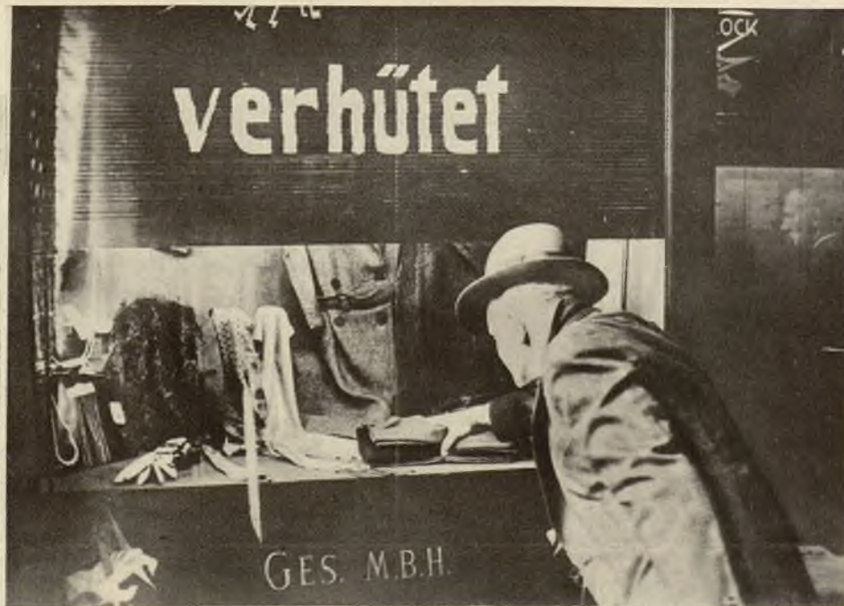
Ochrona przed włamaniem: po wybiciu szyby wystawowej żelazna żaluzja automatycznie opada.