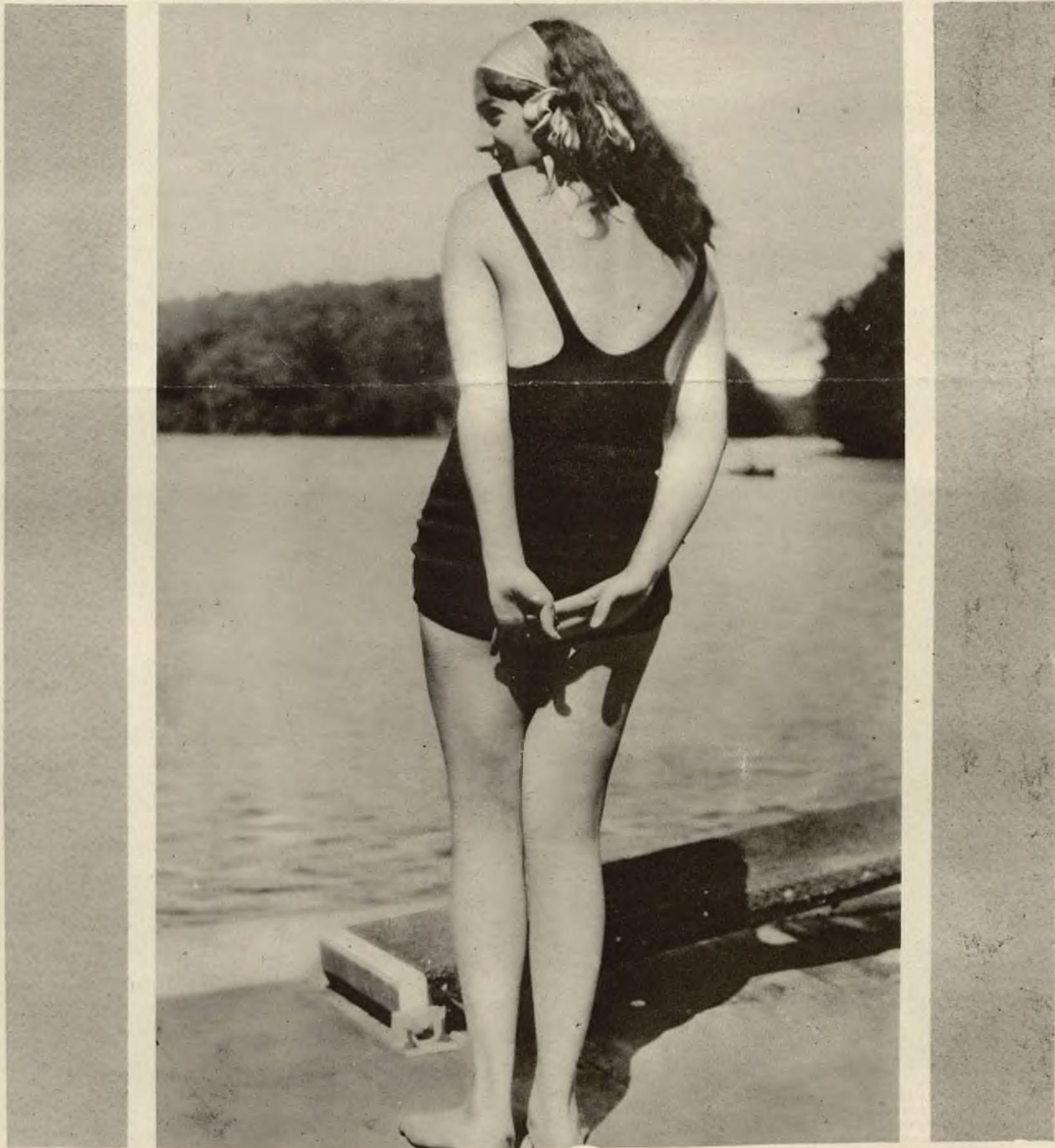
Kanadyjska „girl”, woda i słońce — to dostateczny temat do obrazu. Jedna kwestja pozostaje tylko do wyjaśnienia: czy zdjęcie powyższe jest niedyskretnym reportażem, czy też uwiecznieniem dobrze wystudjowanej pozy?