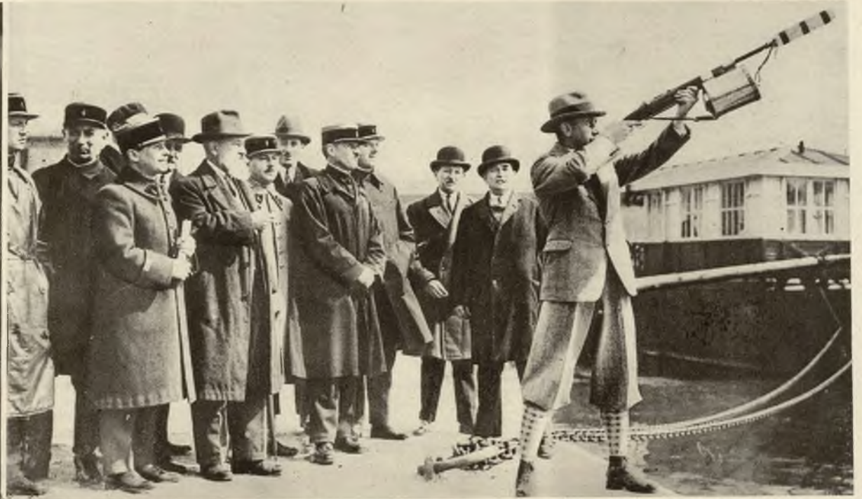
Nowy pomysł ratowania tonących rozbitków: strzelba, z której wystrzelić można linę długości 200 m. Za pomocą tej liny wciąga się rozbitków na brzeg lub do łodzi ratunkowej.