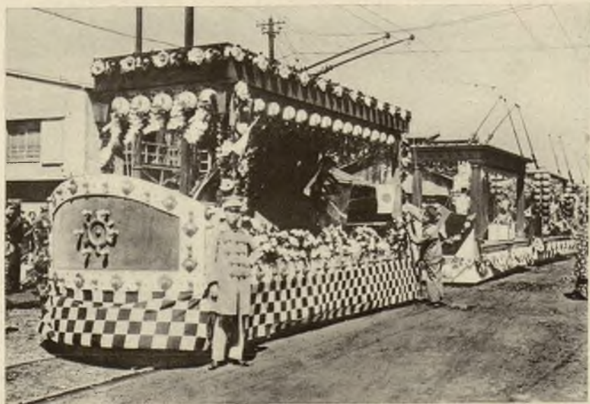
Tramwaje w Tokio strojnie przybrane w dzień uroczystości ukończenia odbudowy miasta po ostatnim trzęsieniu ziemi.