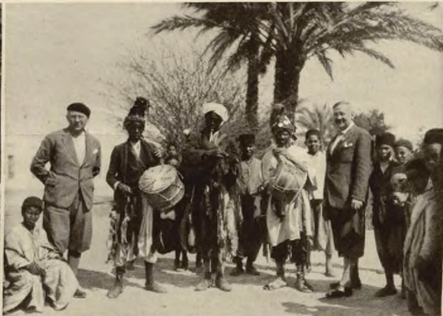
W towarzystwie grajków, którzy swą hałaśliwą muzyką napełniają ulice Biskry.