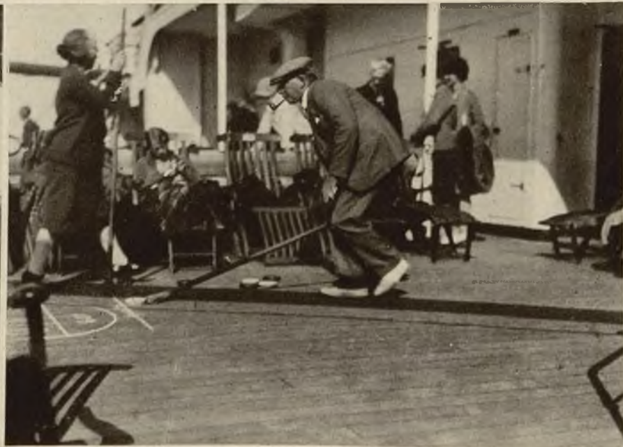
Minister pracy Thomas uprawiający popularną grę „Shuffleboard” na okręcie powracając z Kanady.