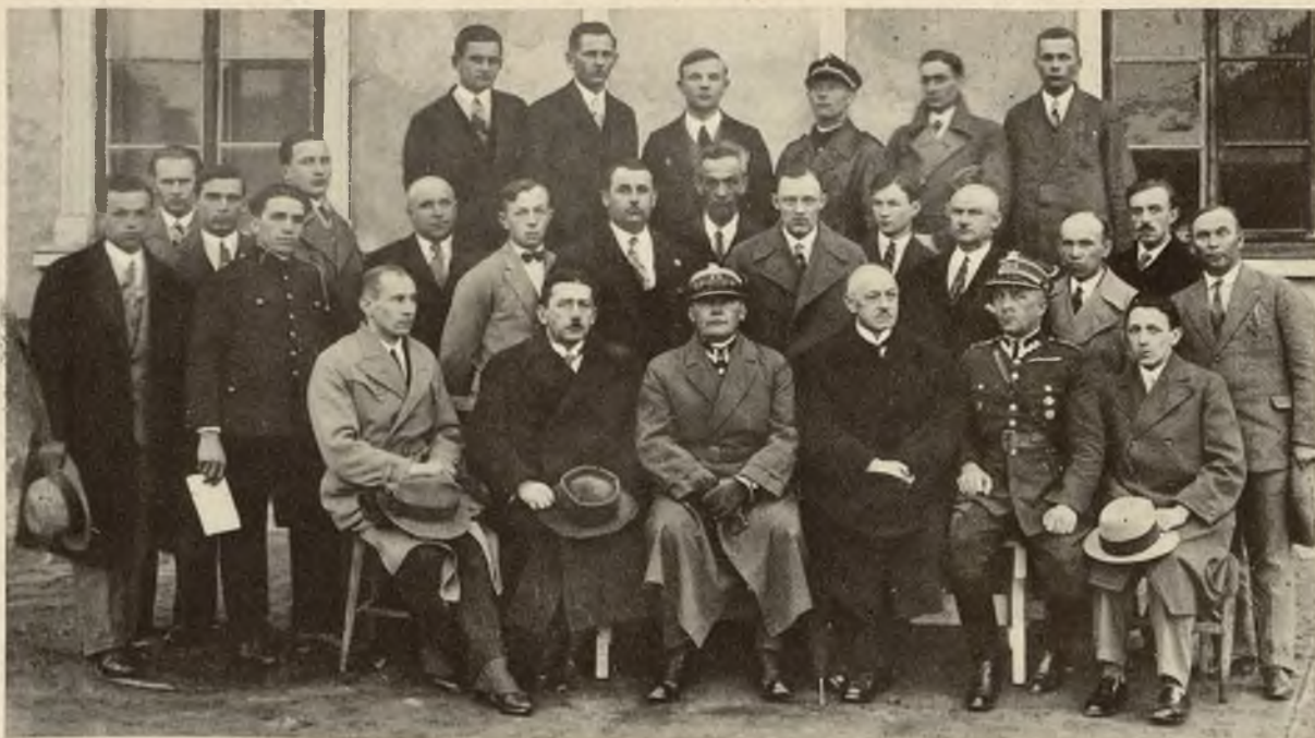
Uczestnicy kursu instruktorów obrony przeciwigazowej we Lwowie.