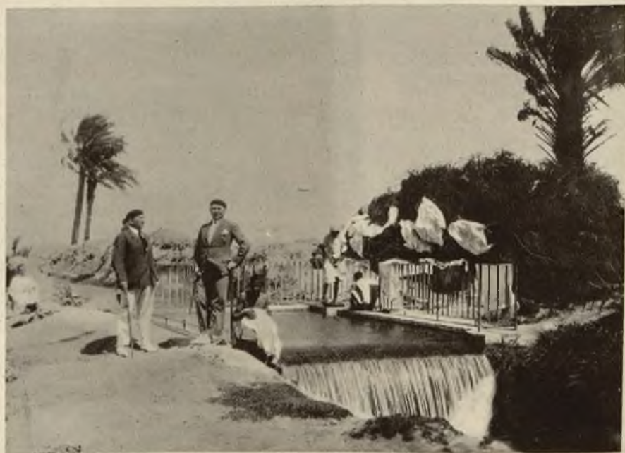
Przed potokiem, w którym młodzi Arabowie piorą sami białiznę, aby ich młode żony mogły pozostać w domu, zdala od spojrzeń obcych mężczyzn.