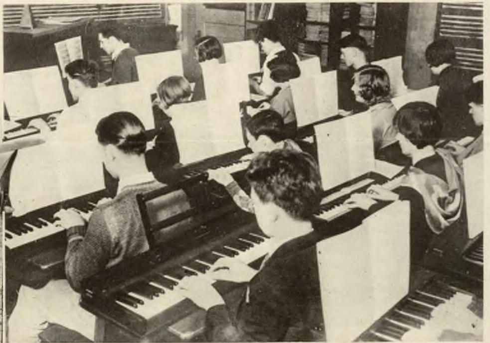
W szkole muzycznej w Waszyngtonie pobierają uczniowie naukę muzyki na t. zw. niemych pianinach.