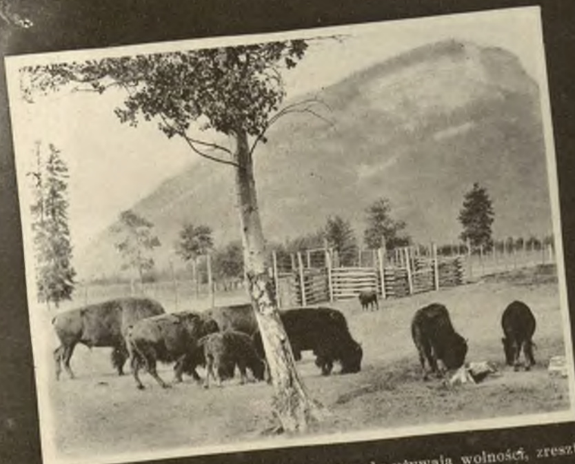
Bawoły w rezerwach Zachodniej Kanady używają wolności, zresztą ograniczonej przez silne i wysokie płoty i barjery.