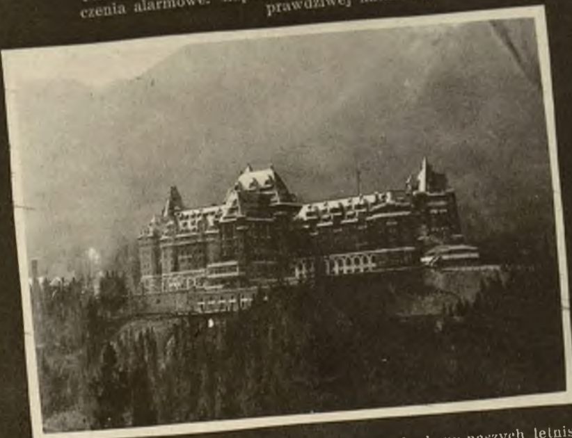
Hotel turystyczny w Banck — daleki miraż rozbudowy naszych lotnisk.