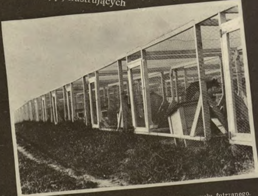
Typ farmy lisiej w Kanadzie, podstawa przemysłu futrzanego.