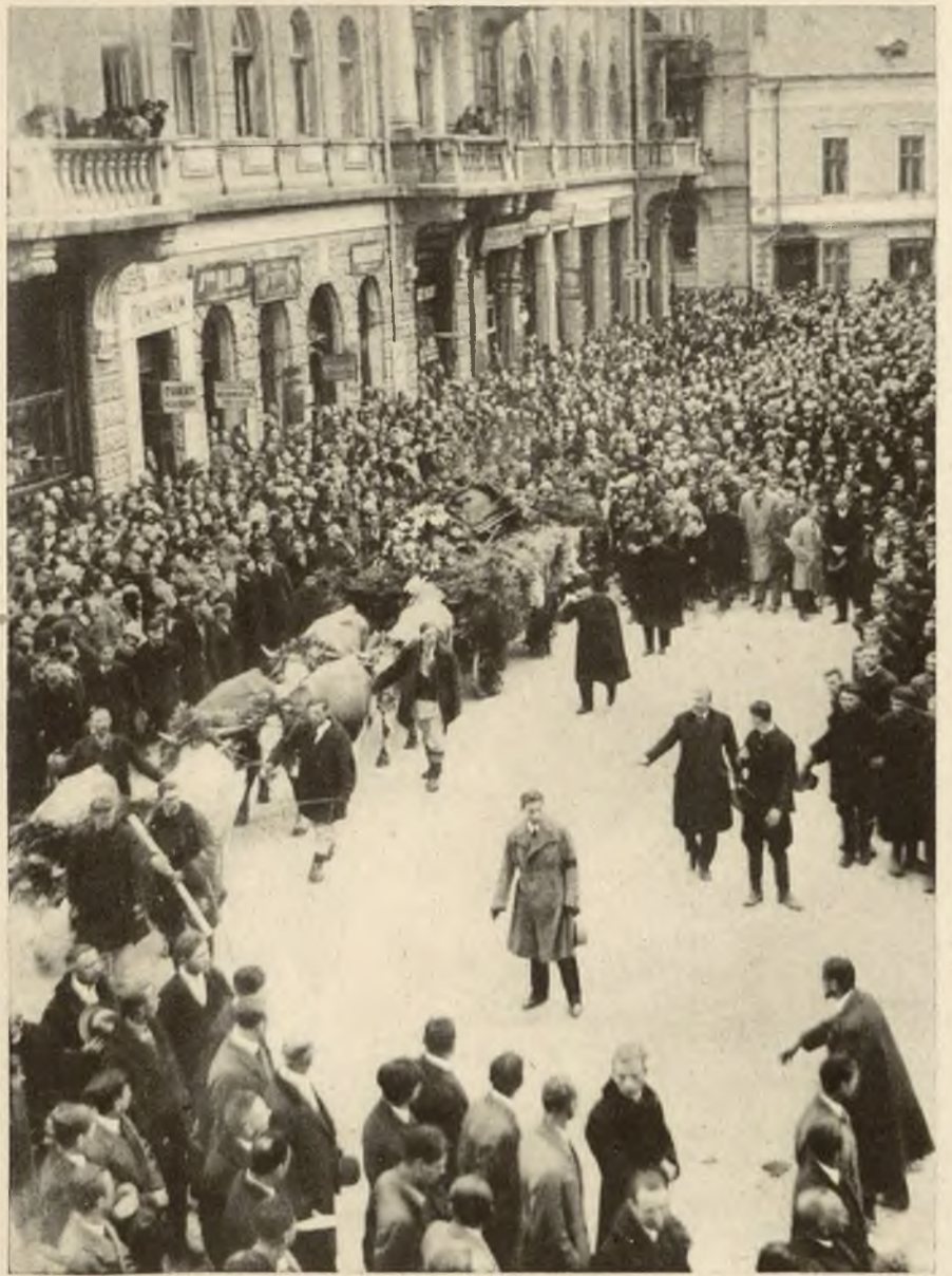
Z pogrzebu posła Lwa Baczyńskiego w Stanisławowie. Trumnę ułożoną na wozie chłopskim ciągną w myśl życzeń zmarłego 3 pary wołów.