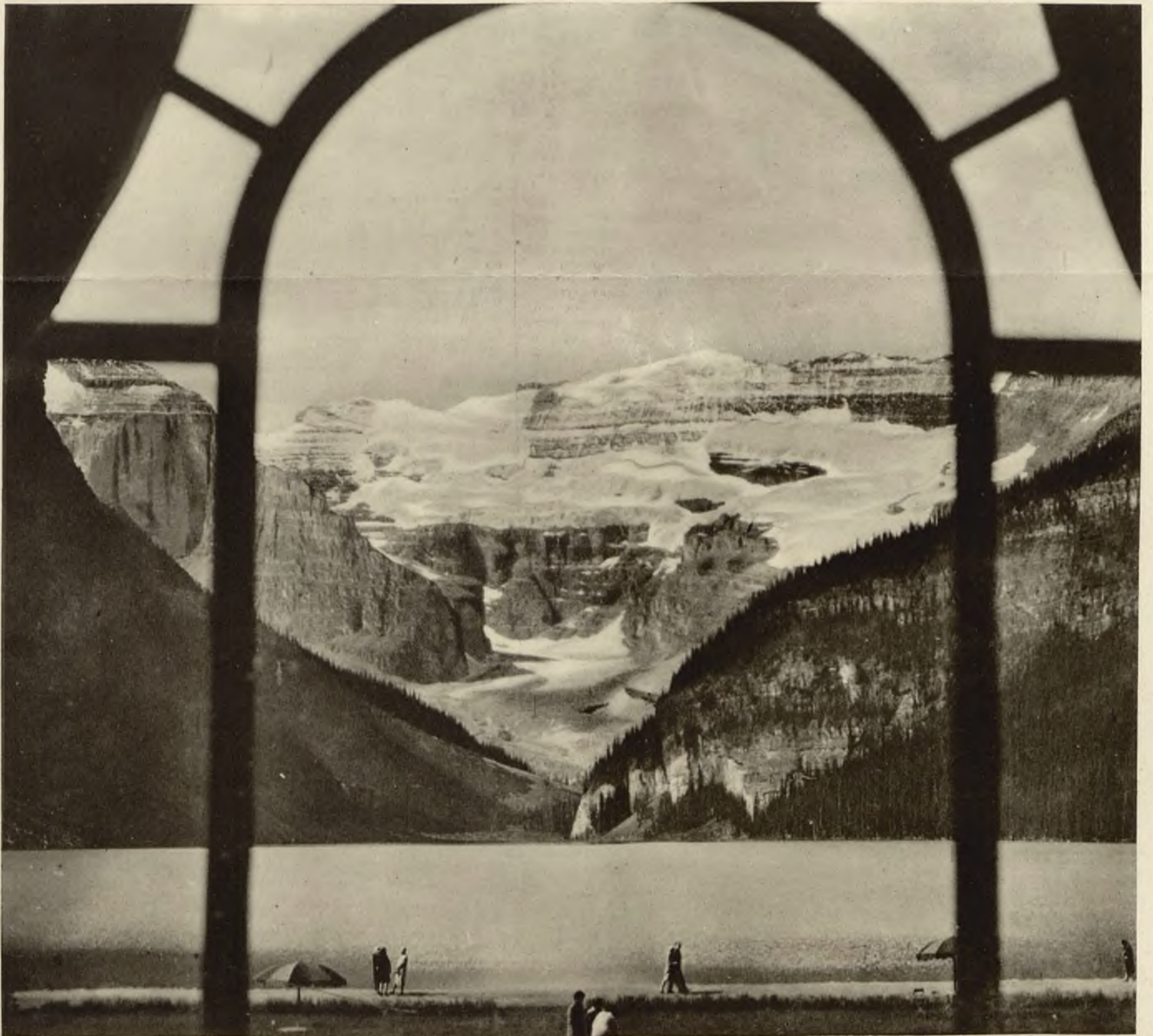
Kanadyjskie jezioro Louise na tle majestatycznego masywu górskiego.