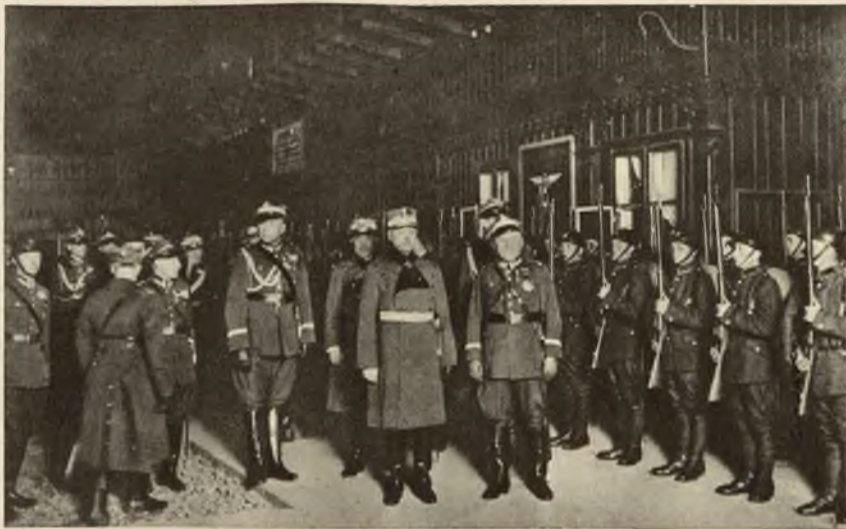
Dnia 25-go kwietnia przybył do Warszawy generał Samsonowici, szef sztabu rumuńskiego. Zdjęcie nasze przedstawia moment uroczystego powitania gen. Samsonowici na dworcu głównym w Warszawie. Dostojnego gościa powitał gen. Piskor szef sztabu głównego w otoczeniu generalicji i wyższych oficerów.