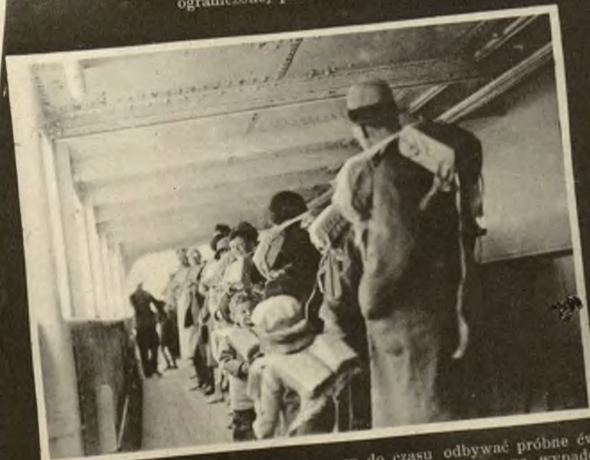
Pasażerowie na okręcie muszą od czasu do czasu odbywać próbne ćwiczenia alarmowe. Zapewnia to sprawną akcję ratunkową na wypadek prawdziwej katastrofy.