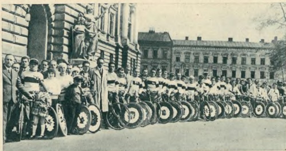
Otwarcie sezonu kolarskiego we Lwowie, zorganizowane przez Lw. Tow. Kolarzy i Motocyklistów.