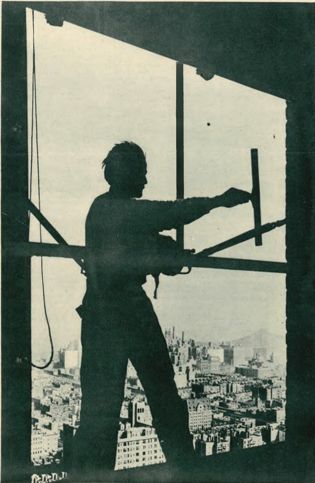
Malownicza sylwetka robotnika pracującego przy budowie jednego z nowojorskich drapaczy chmur.