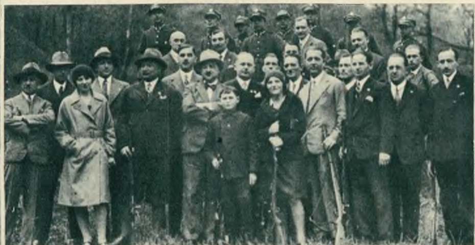
Zawody strzeleckie Z. O. R. na strzelnicy wojskowej przy ulicy Kleparowskiej we Lwowie.