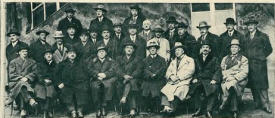
Zjazd naczelników Urzędów skarbowych, Akcyz i Monopolów w obecności prezesa Izby skarbowej dra Polaka i insp. ministerjalnych Kamińskiego i Bogdanowicza.