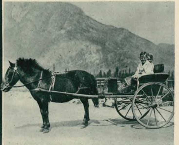
Miły, słoneczny obrazek, nie wymagający komentarzy. Chyba dodaćby można, że tłem tej pogodnej sceny są Góry Skaliste w Kanadzie.