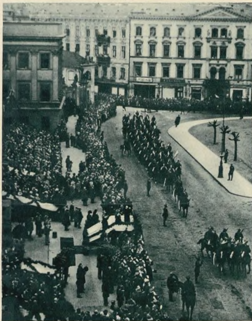
Uroczystości dnia 3-go maja w Warszawie. Ogólny widok placu Marszałka Piłsudskiego w czasie rewji. Na trybunie prezydent Mościcki.