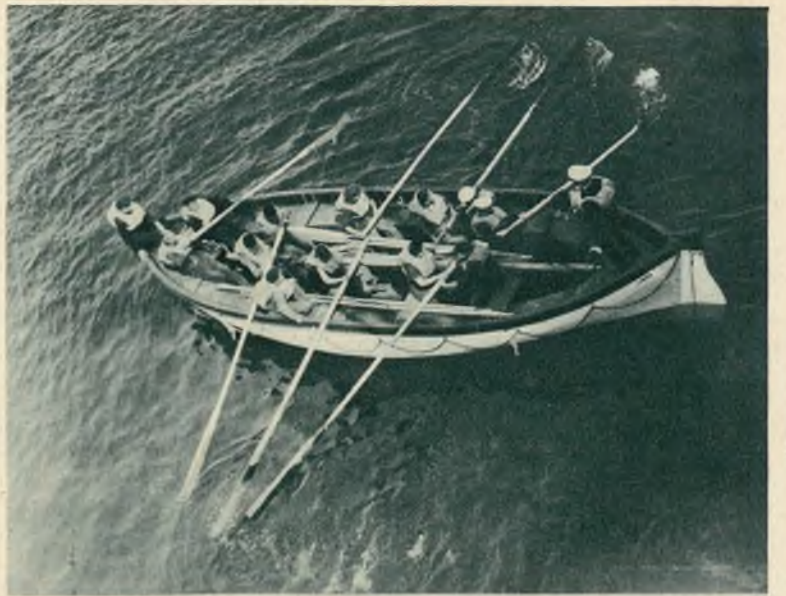
Ćwiczenia załogi łodzi ratunkowej; marynarzami są autentyczni Chińczycy.