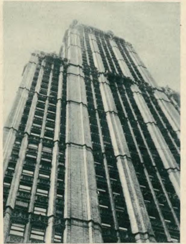
Można dostać lekkiego zawrotu głowy, patrząc z ulicy na masyw drapacza chmur. Cała pociecha, że ulica, oglądana ze szczytu tego kolosa, wygląda jeszcze bardziej „zawrotnie“.