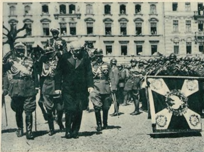
P. Prezydent ze swiżą przechodzi przed frontem oddziałów. Na prawo: Pawilon polski na międzynarodowej wystawie w Liege otwartej 3-go maja.