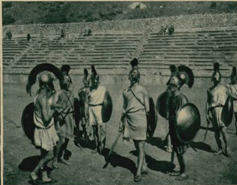
Próba przed uroczystościami 100-lecia niepodległości Grecji w Delfach.