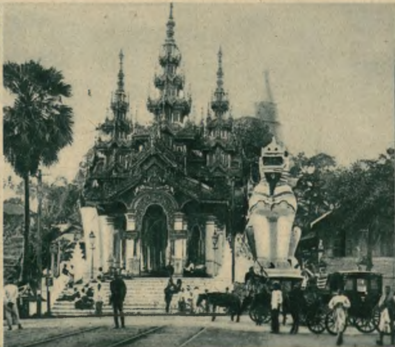
Słynna pagoda Szwe Dagon w mieście Pegu w Indjach została w czasie trzęsienia ziemi w dniu 6-go maja poważnie uszkodzona.

Na lewo: Sala posiedzeń magistratu krakowskiego, w której odbywały się w dniach 12—16 maja obrady światowego kongresu górników.