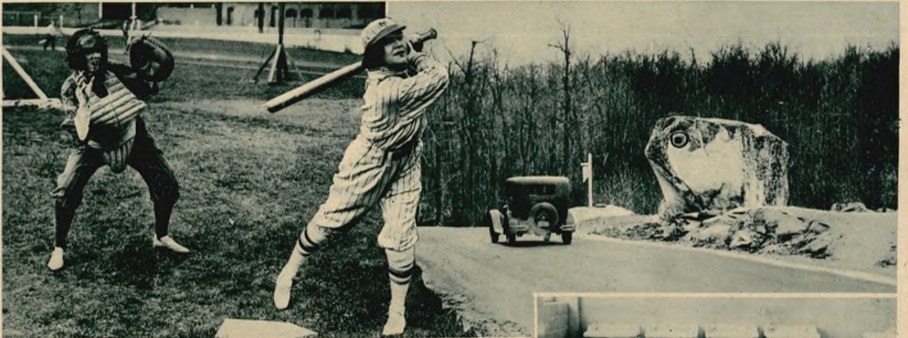
Znana aktorka londyńska Edith Day bierze wraz z swą drużyną czynny udział w zawodach baseball'owych.