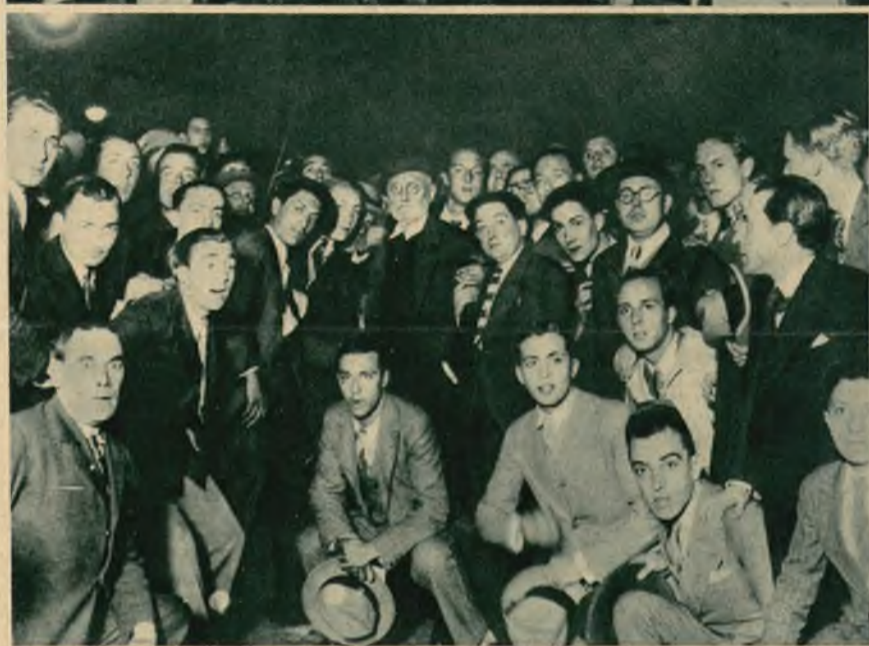
Słynny pisarz hiszpański Unamuno przez swą energiczną akcję polityczną naraził się także i obecnemu rządowi.

Na lewo: Sala posiedzeń magistratu krakowskiego, w której odbywały się w dniach 12—16 maja obrady światowego kongresu górników.