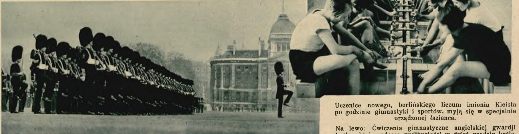
Uczennice nowego, berlińskiego liceum imienia Kleista po godzinie gimnastyki i sportów, myją się w specjalnie urządzonej łazience.