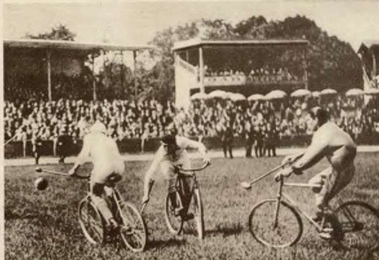
Nowy sport „polo na rowerach” jest ogromnie interesującym i wymaga od graczy nadzwyczajnego opanowania jazdy na rowerze.