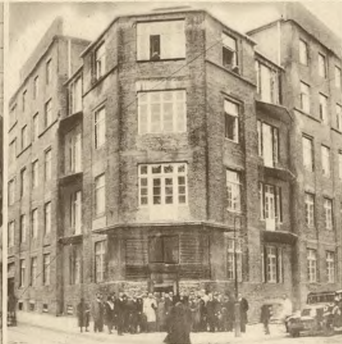
We Lwowie został ostatnio wybudowany Dom Emigranta, w którym znajdują opiekę i przytułek wychodźcy udający się za morze.