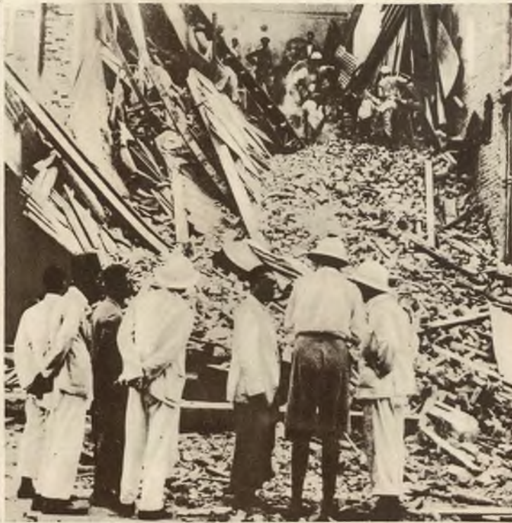
Miasto Rangoon w Indjach zostało zniszczone przez trzęsienie ziemi.