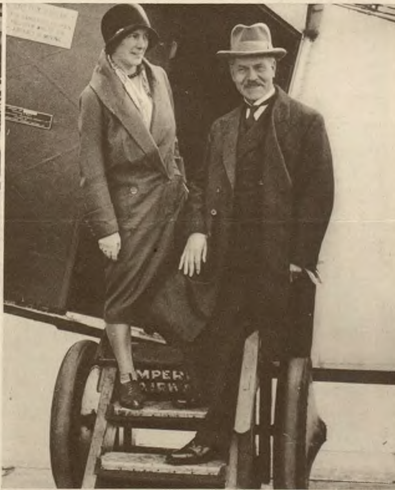
Na prawo: Premier angielski Mac Donald udał się samolotem wraz z swoją córką na krótki wypoczynek do Szkocji.