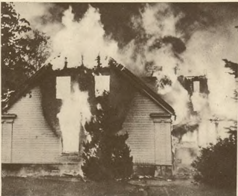
Skangum, pałacyk norweskiego następcy tronu spłonął z powodu krótkiego spięcia. Zdołano tylko uratować znajdujące się tam dzieła sztuki i klejnoty żony następcy tronu przechowywane w ogniotrwałej piwnicy.