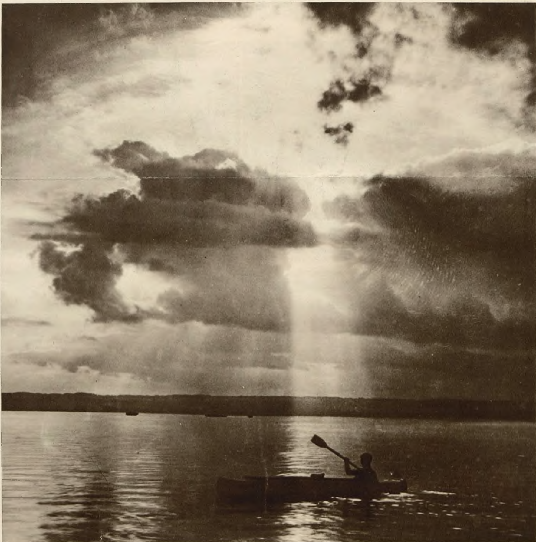
O ZACHODZIE SŁOŃCA