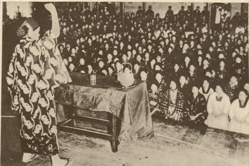
Wiece protestacyjne japońskich robotników tkackich, przedstawia ciekawy widok, dzięki malowniczym strojom narodowym uczestniczek.