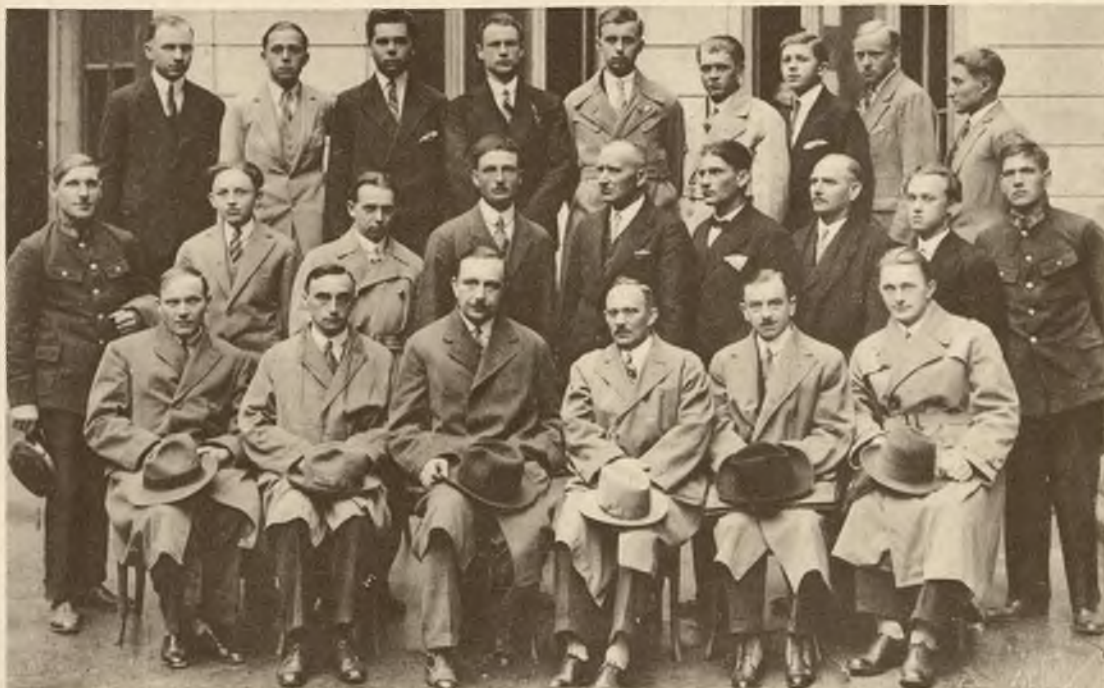
Absolwenci IV. kursu spawania i cięcia metali, zorganizowanego przy współudziale Izby Przem.- Handl. we Lwowie.