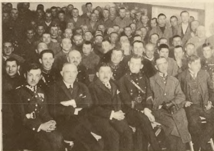
Wykład propagandowy LOPP-u z przeżroczami dla więźni długoterminowych w Zakładzie kary w Drohobyczu.