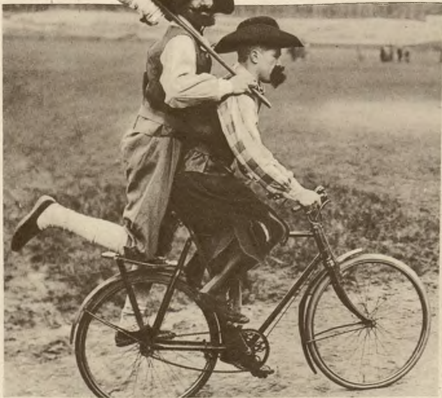
Na arenie Aldershot w Anglii odbywają się historyczne przedstawienia, w których bierze udział bardzo wielu statystów. Oto dwaj wieśniacy, którzy już ucharakteryzowani udają się na rowerze na przedstawienie.