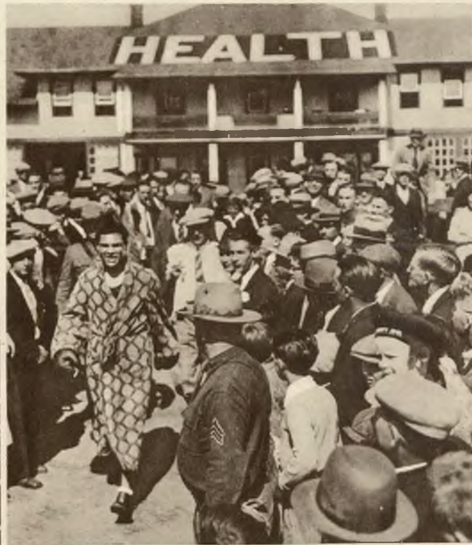
Znany bokser Max Schmeling udaje się na codzienny trening, witany po drodze przez olbrzymie rzesze publiczności.