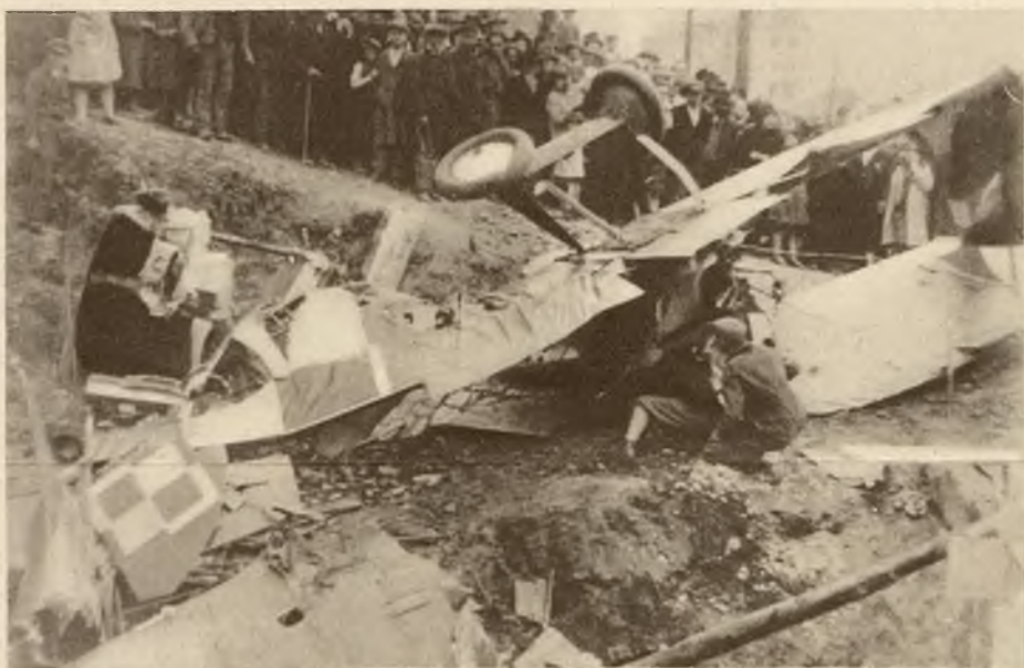
Katastrofa lotnicza w Kryniei. Zebrany tłum przygląda się szczątkom aparatu.