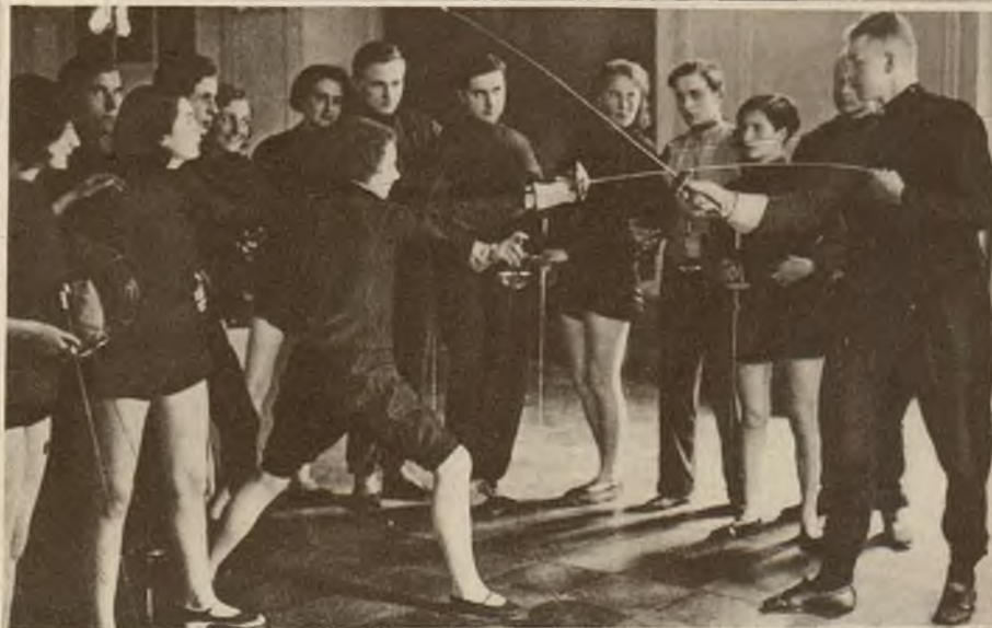
Uczniowie szkoły sztuki aktorskiej w Berlinie, prowadzonej przez M. Reinhardta, podczas lekcji szermierki.