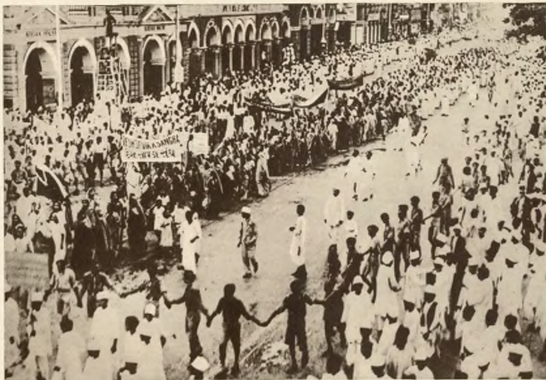
Nacjonaliści indyjscy zorganizowali w Bombaju olbrzymi pochód, który miał dwa kilometry długości, jako wyraz protestu przeciw aresztowaniu Gandhi'ego.