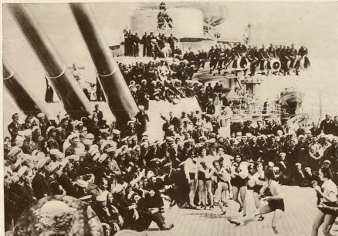
Komendant amerykańskiego okrętu wojennego „California” urządził dla swych marynarzy przedstawienie baletowe, będąc zdania że jest to tańsza rozrywka niż gdy marynarze idą się zabawić na ląd.