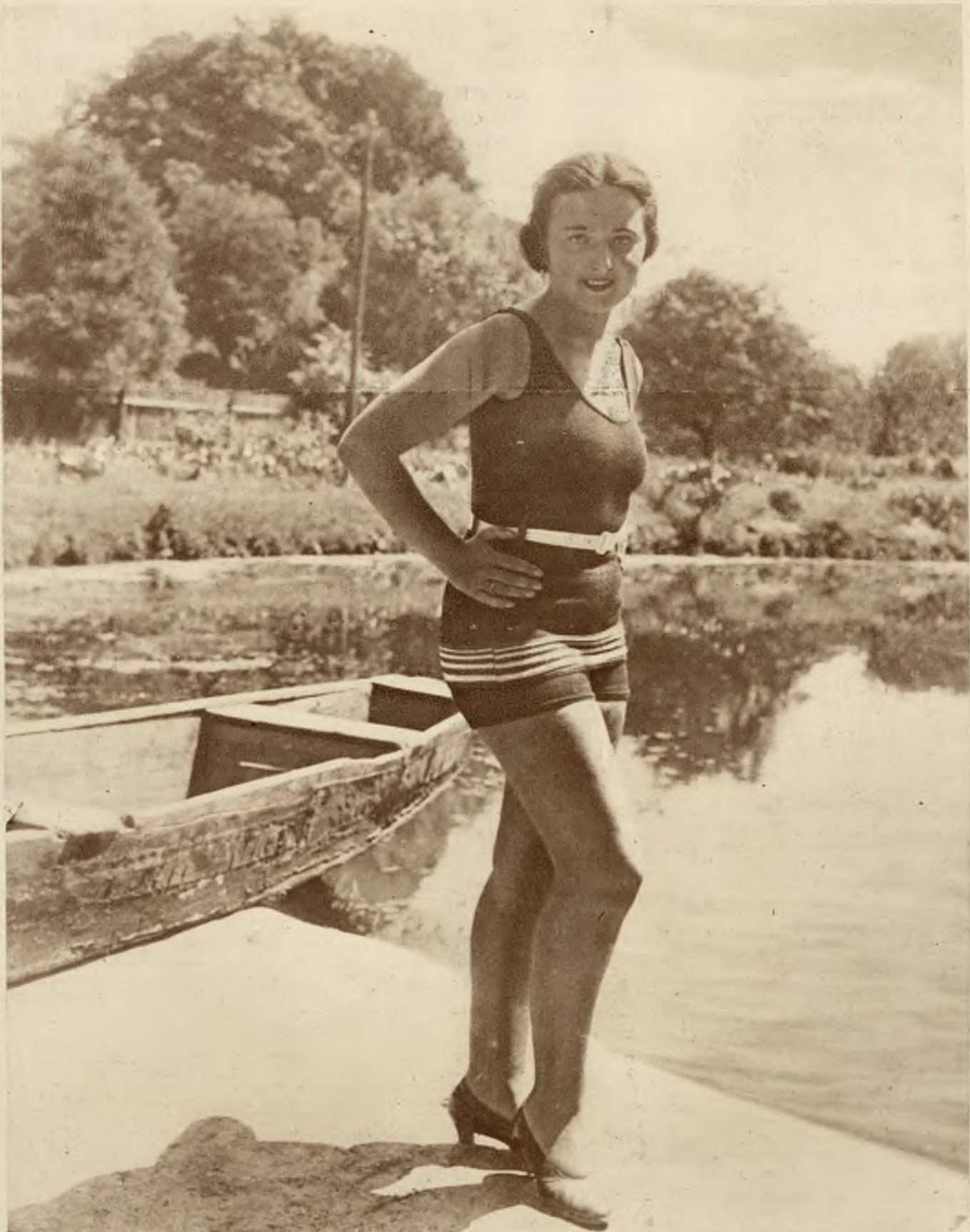
Na lwowskiej „Switezł”. Obrazek, którego nie zapomina się łatwo.