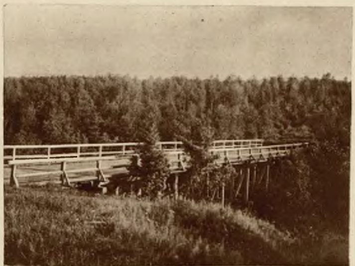
Most nad stawem.

Tutaj laureat ostatniego konkursu „Gazety Porannej“ zdobędzie na własność willę i prawo do rozkosznej wilegatury już w bieżącym roku.