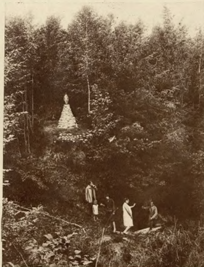
Źródło „Marysia z figurą Matki Boskiej — ustronie tchnące ciszą i chłodem.