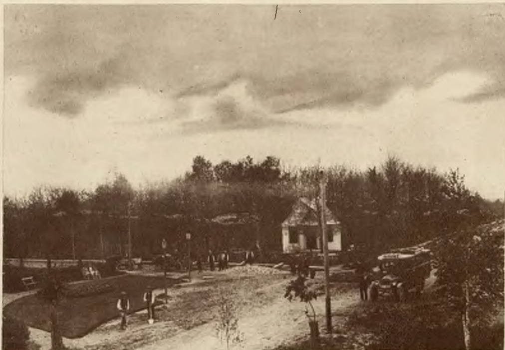
Plac Aleksandra i główna aleja. Na dalszym planie park i kiosk z bufetem. Praca nad uporządkowaniem skwerów i dróg dobiega końca.