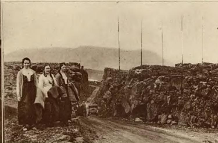
Zdjęcia z uroczystości 1000-lecia państwowości islandzkiej. Na lewo król duński otwiera uroczystość. Na prawo miejsce gdzie odbył się pierwszy „thing“ (parlament) islandzki przed 1000 laty. Na pierwszym planie 3 wieśniaczki w malowniczych strojach islandzkich.