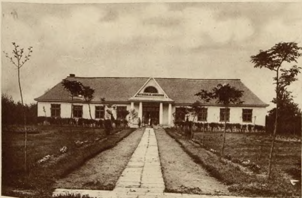
Miejsce gdzie o wieczornej porze rozbrzmiewa gwar zabawy — restauracja i kawiarnia z salą dancingową.