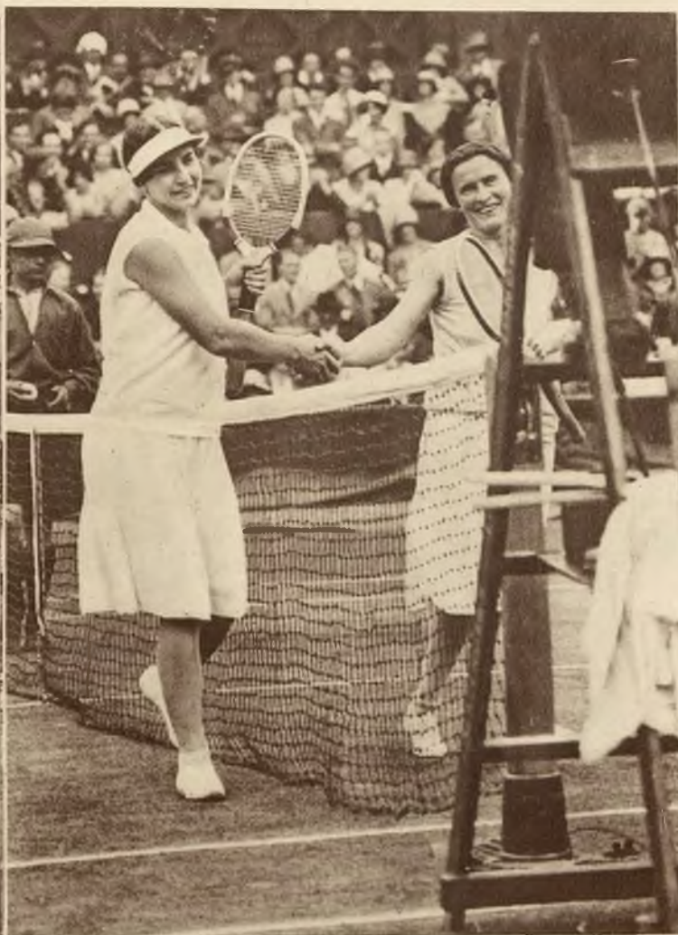
Mistrzyni świata w tenisie Helen Wills-Moody, odbiera gratulacje od swej zwyciężonej przeciwniczki Amerykanki E. Ryan.