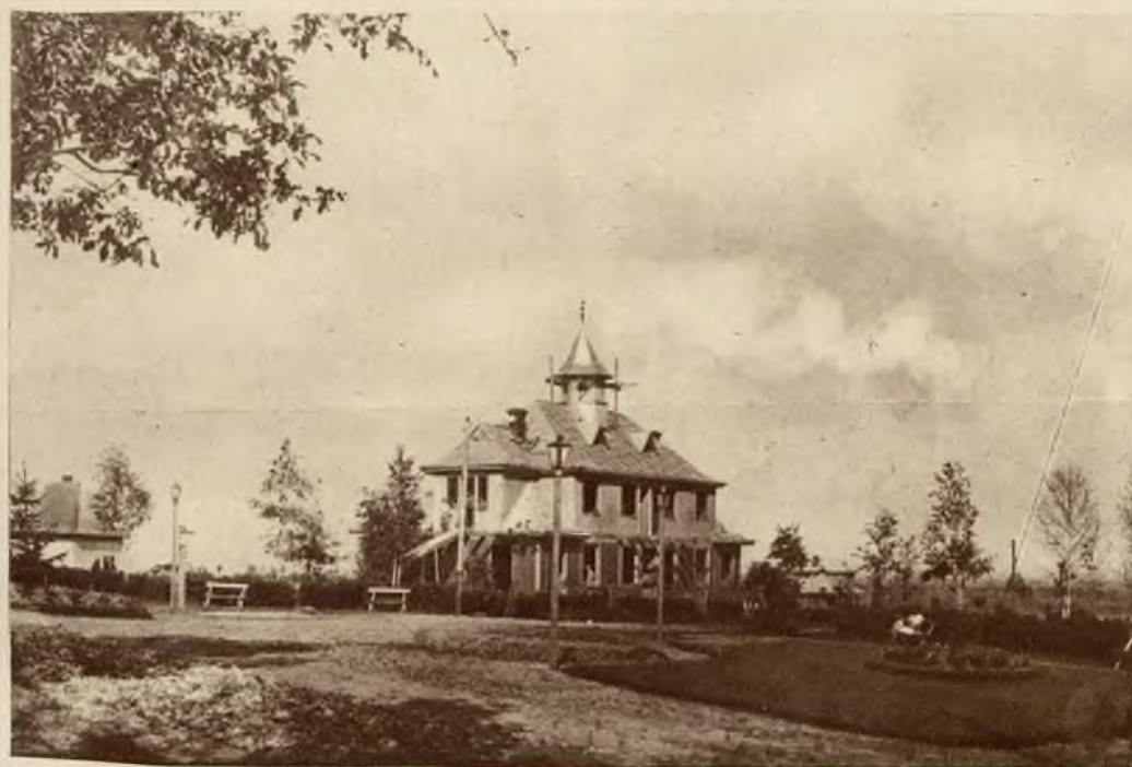
Siedziba władz lokalnych: Urząd gminny, poczta i centrala telefoniczna.