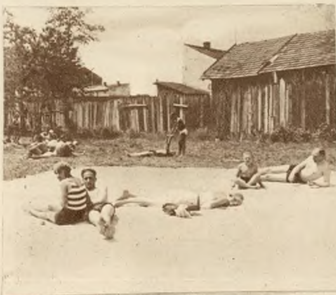
Najlepszy sposób walki z kanikują; wymaga tylko nieco czasu i dobrej woli.

Na prawo: Powiadają, że kąpiel nie tylko chłodzi, lecz i ujmuje wagę. Trzeba więc spróbować.