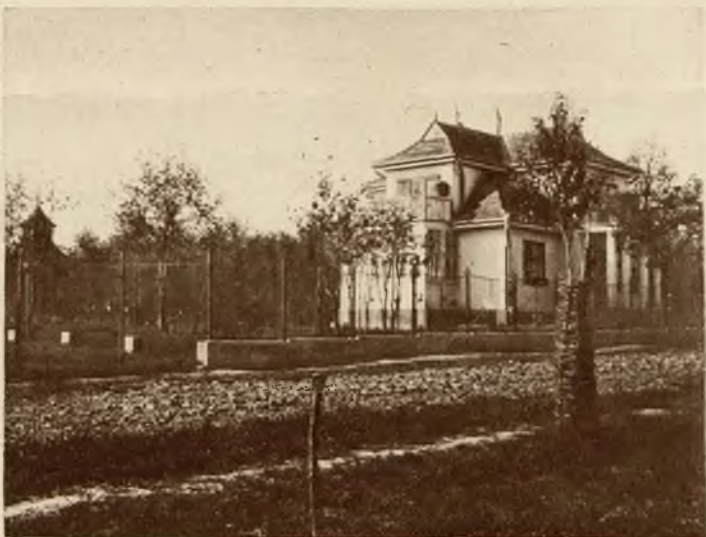
Jedna z typowych will letniska: Willa Jakóbówka.