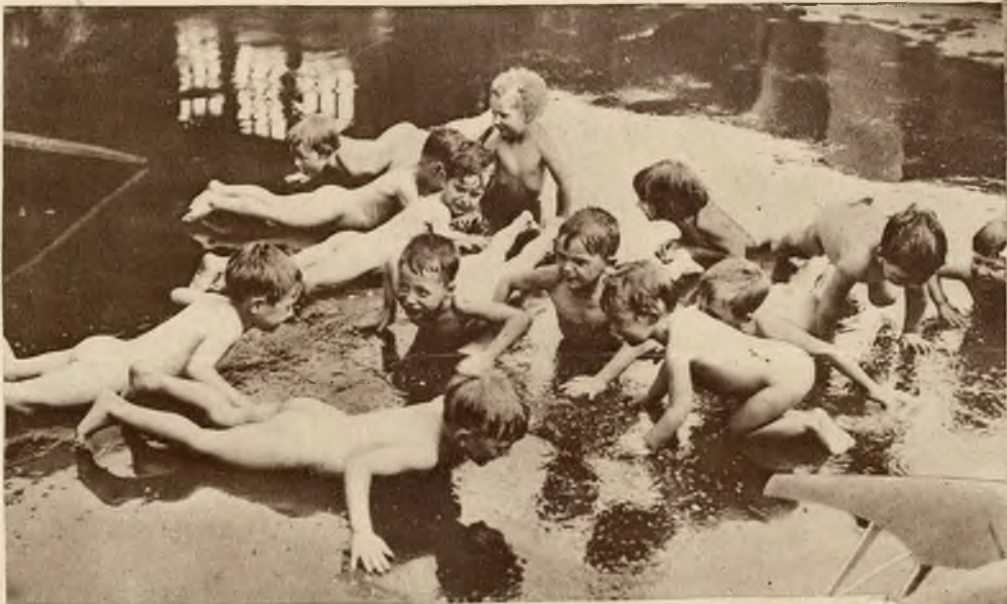
Gromadka dzieci londyńskich szuka ochłody w miniaturowym stawku.