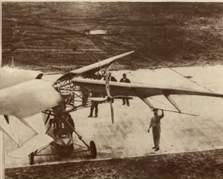
Nowy typ helikoptera (samolot pionowo startujący) zbudowano obecnie w Curtis Field w Ameryce.