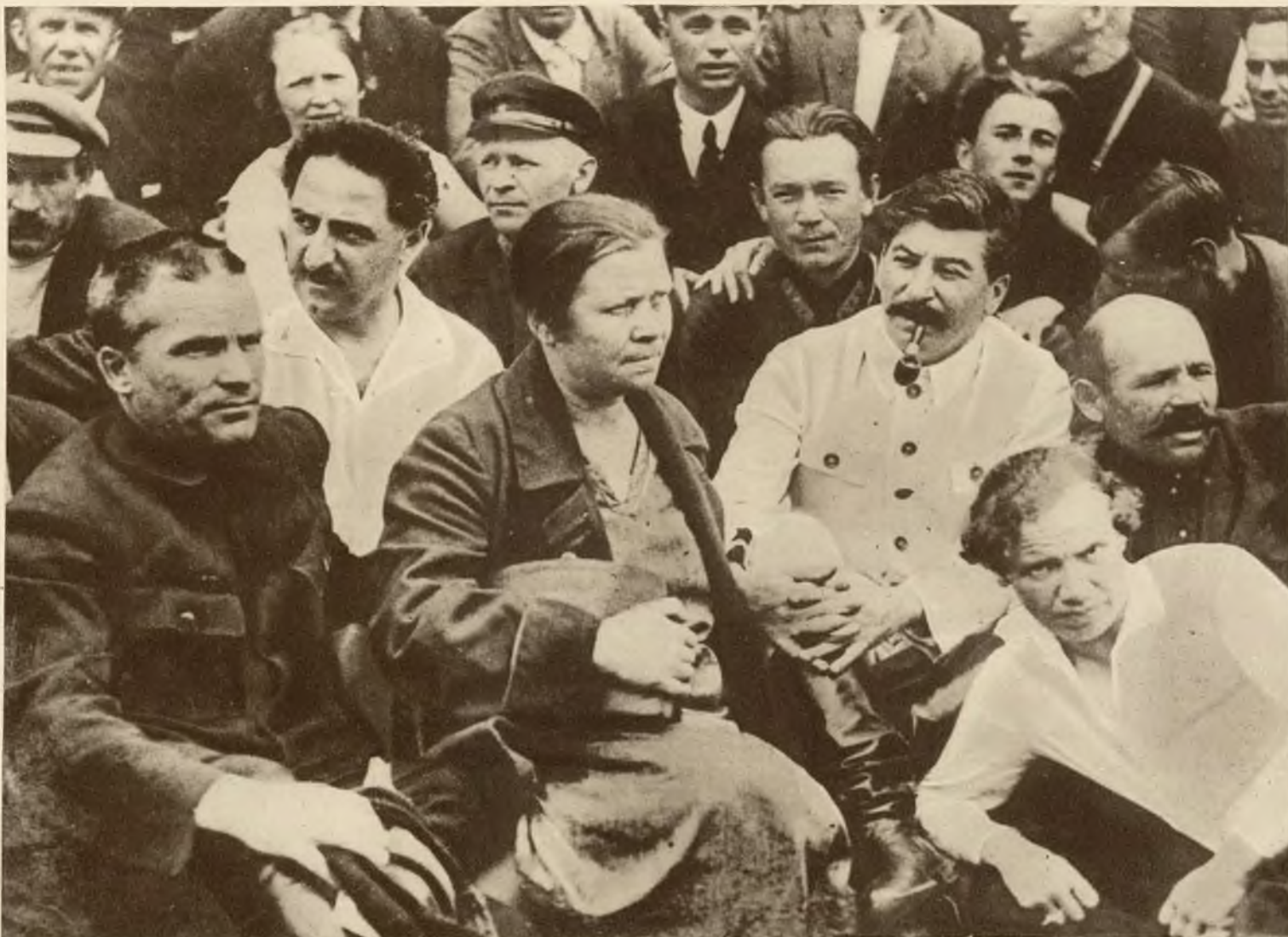
Ostatnie zdjęcie dyktatora Rosji Stalina (z fajką) w czasie kongresu partii komunistycznej. Naokoło Stalina delegaci i delegatki na kongres.