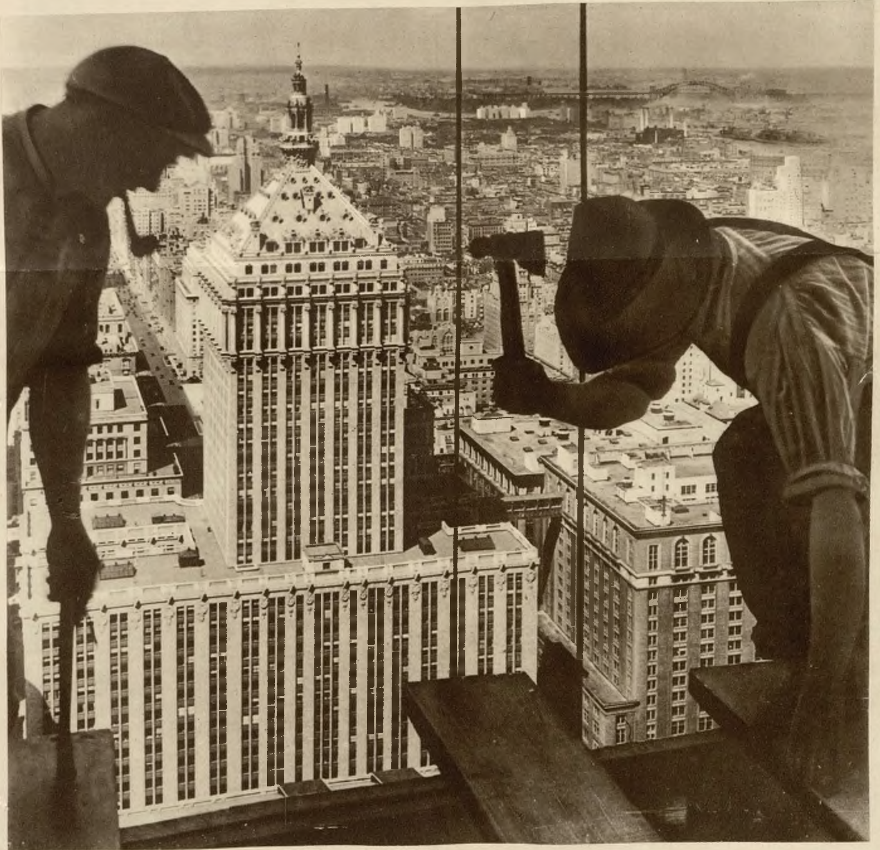
Przy pracy nad szczytami drapaczy chmur — zdjęcie z Chicago.