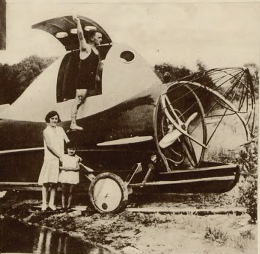
Nowy typ łodzi motorowej, której kształty przypominają zupełnie t. zw. rybę latającą.