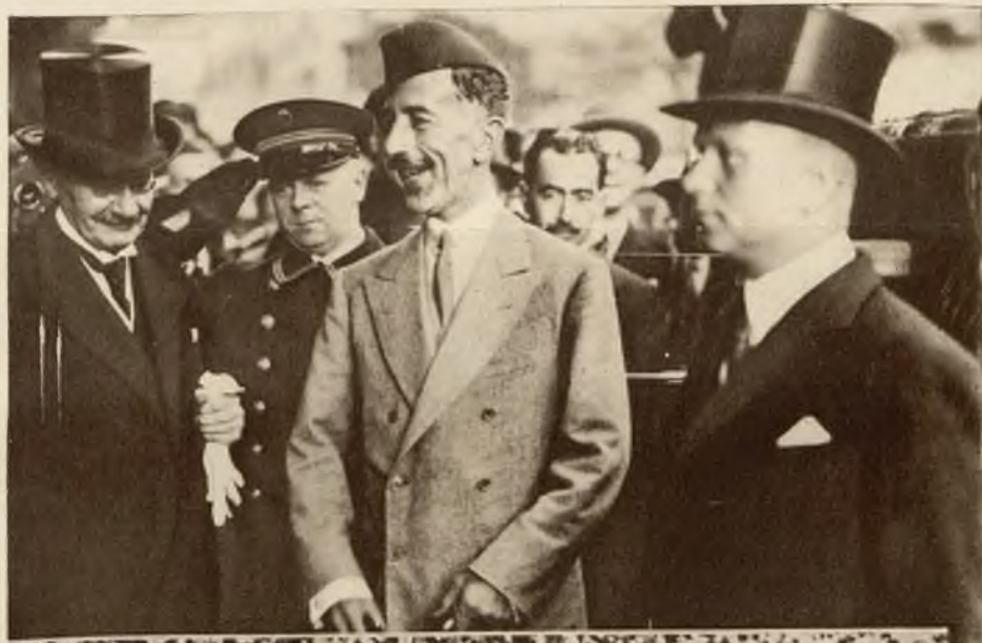
Na lewo: Król Iraku Feisal I przybył do Berlina.