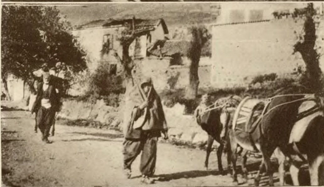
Malownicza droga do starożytnego Pergumon (obecnie Bergama) w Azji Mniejszej.