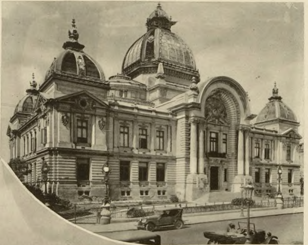
Widok z Bukaresztu: Kasa Oszczędności.