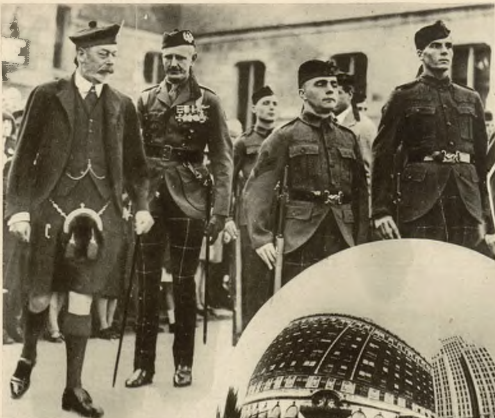
Jerzy, król angielski w szkockim stroju podczas rewji wojskowej w Balmoral.