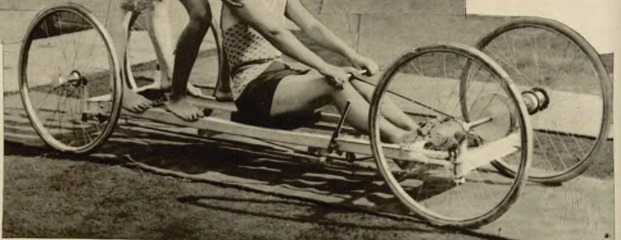
Na prawo: Łódź lądowa; nowy sport na plażach angielskich.