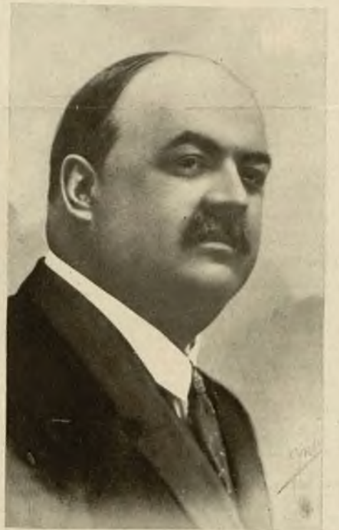
Na prawo: Dr. Virgil Potarca, wice- minister rolnictwa i szef rumuńskiej delegacji na X Targach Wschodnich.