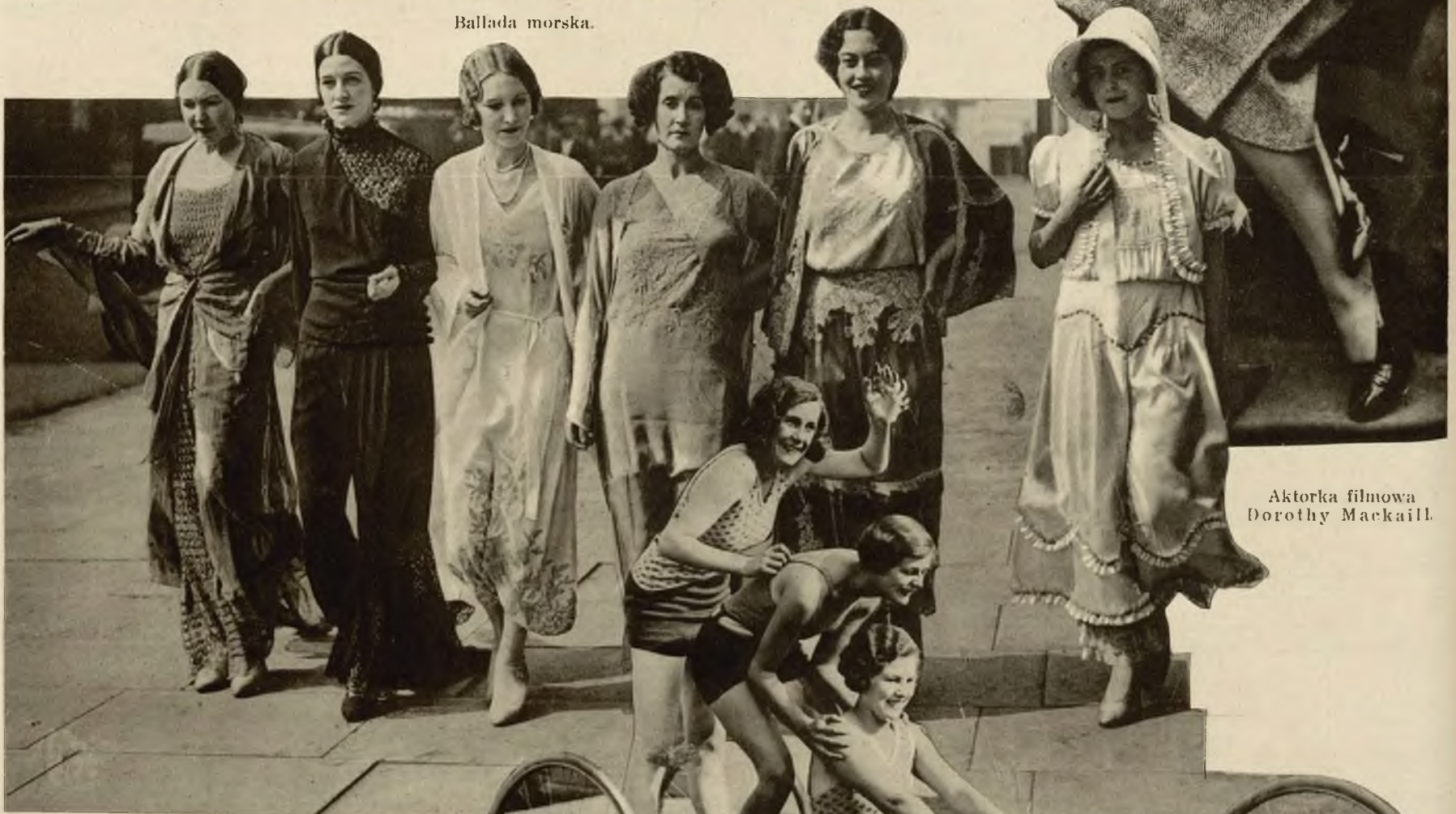
Aktorka filmowa Dorothy Mackaill.