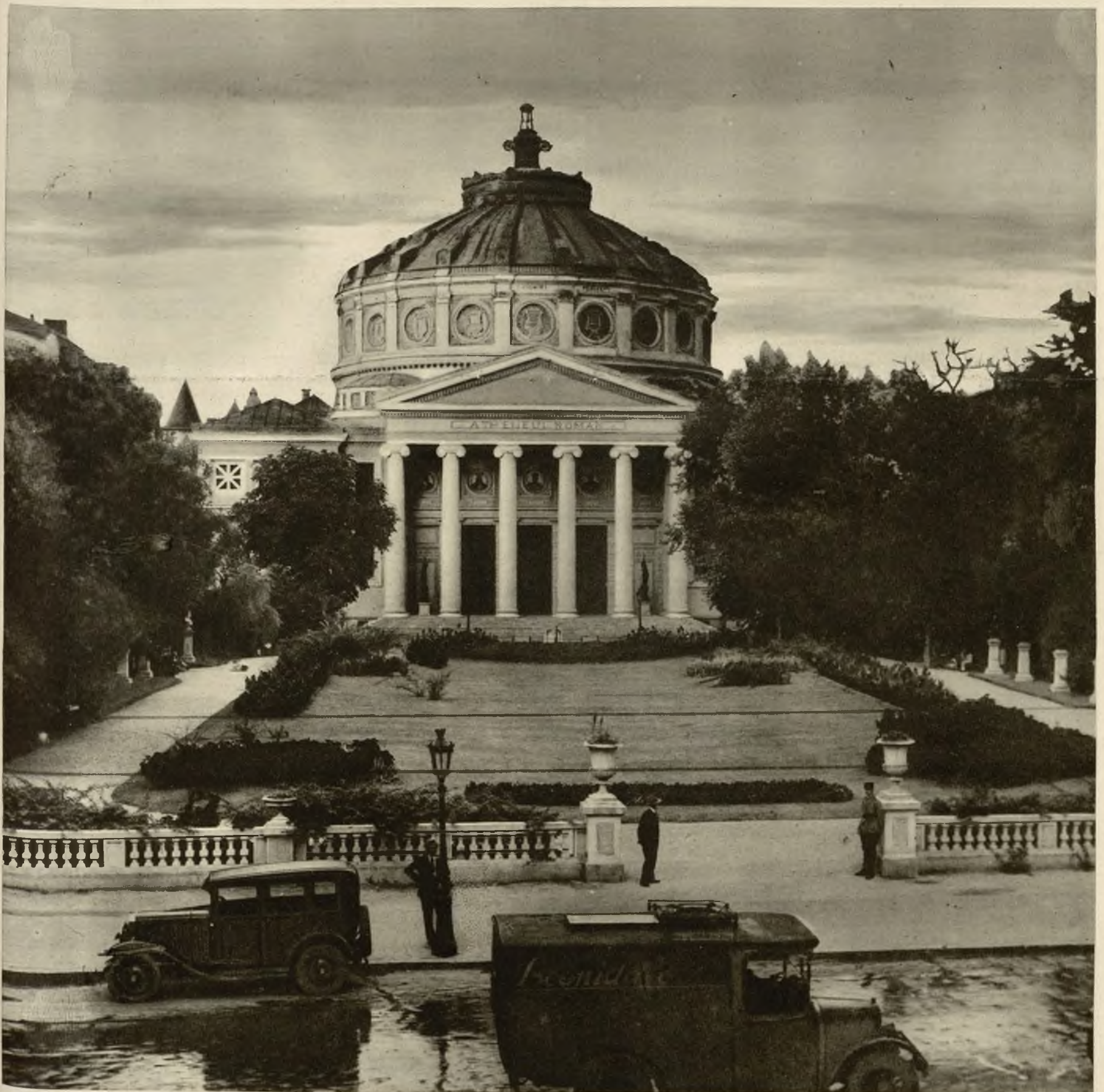
Widoki z Bukaresztu: Ateneum.