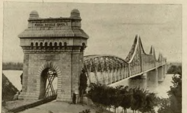
Most „Króla Karola I” na Dunaju w drodze do Konstancy.