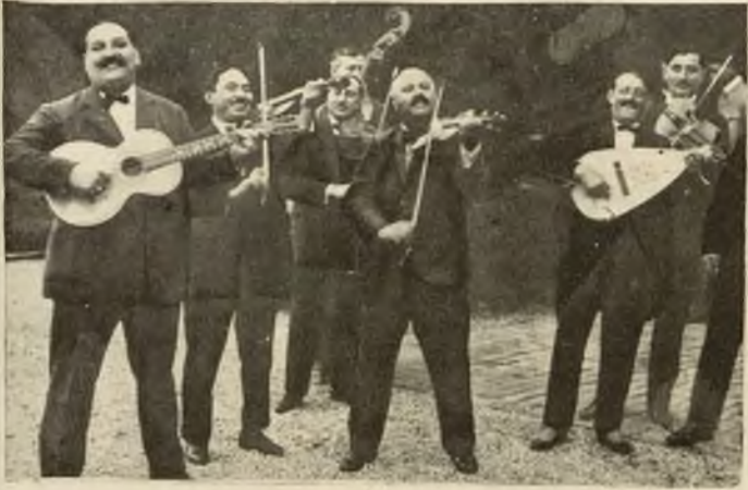
Typowa orkiestra cygańska.