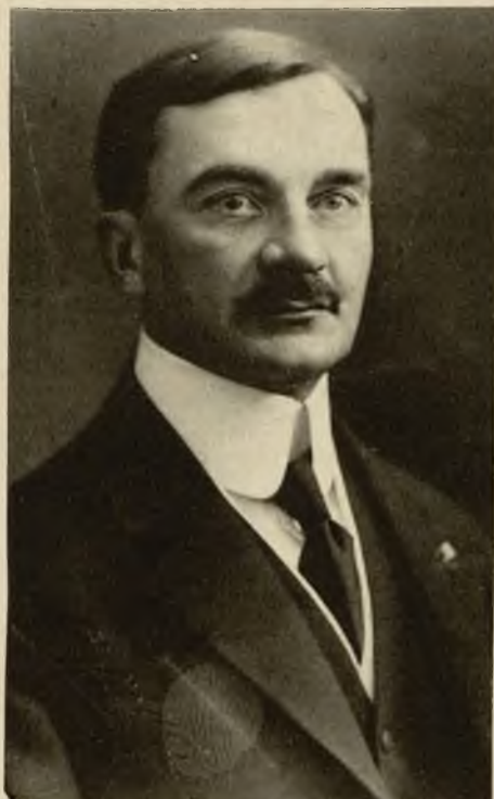
Dr. Juliusz Maniu, prezes ministrów.