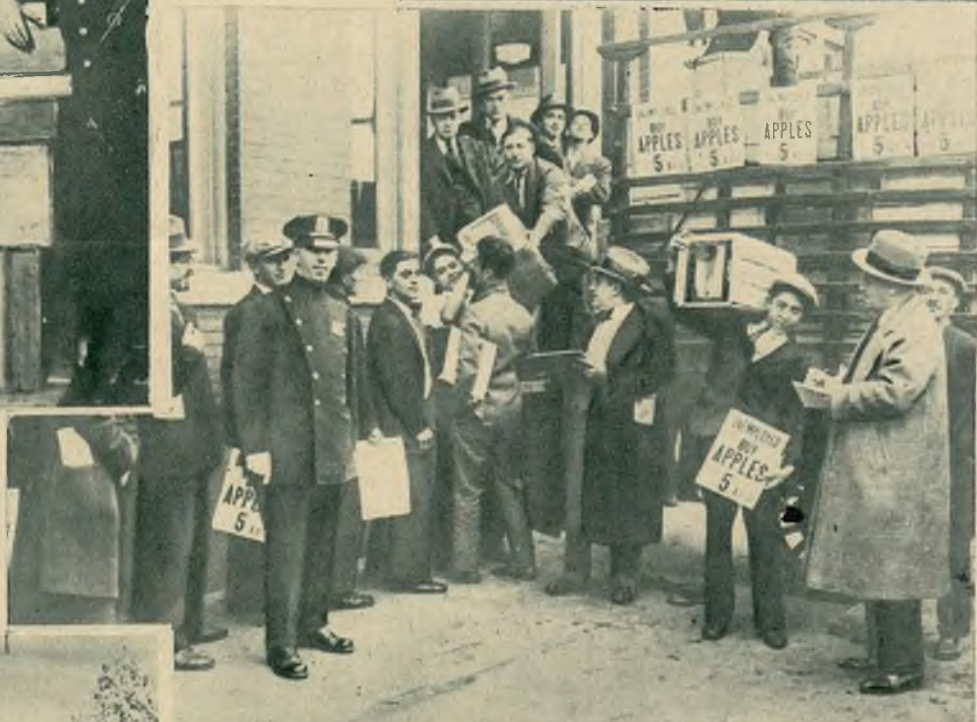
Na prawo: Towarzystwo sprzedaży owoców daje możliwość bezrobotnym w N. Jorku do zarobku od 3—12 dolarów dziennie przez rozsprzedawanie po ulicach jabłek.