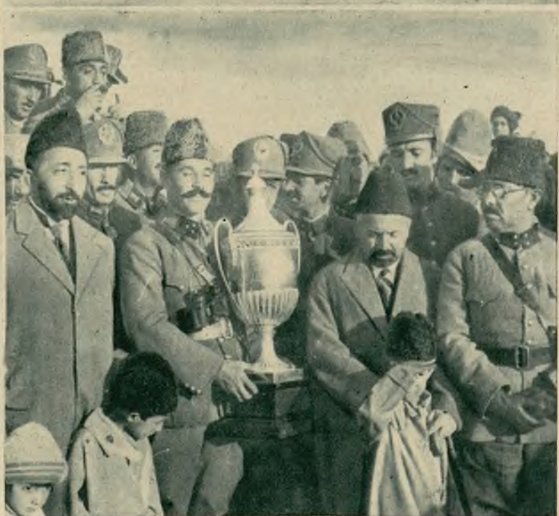
Na prawo: Afgański minister wojny rozdaje nagrody konkursów sportowych urządzanych w czasie uroczystości koronacji Nadir Khana.