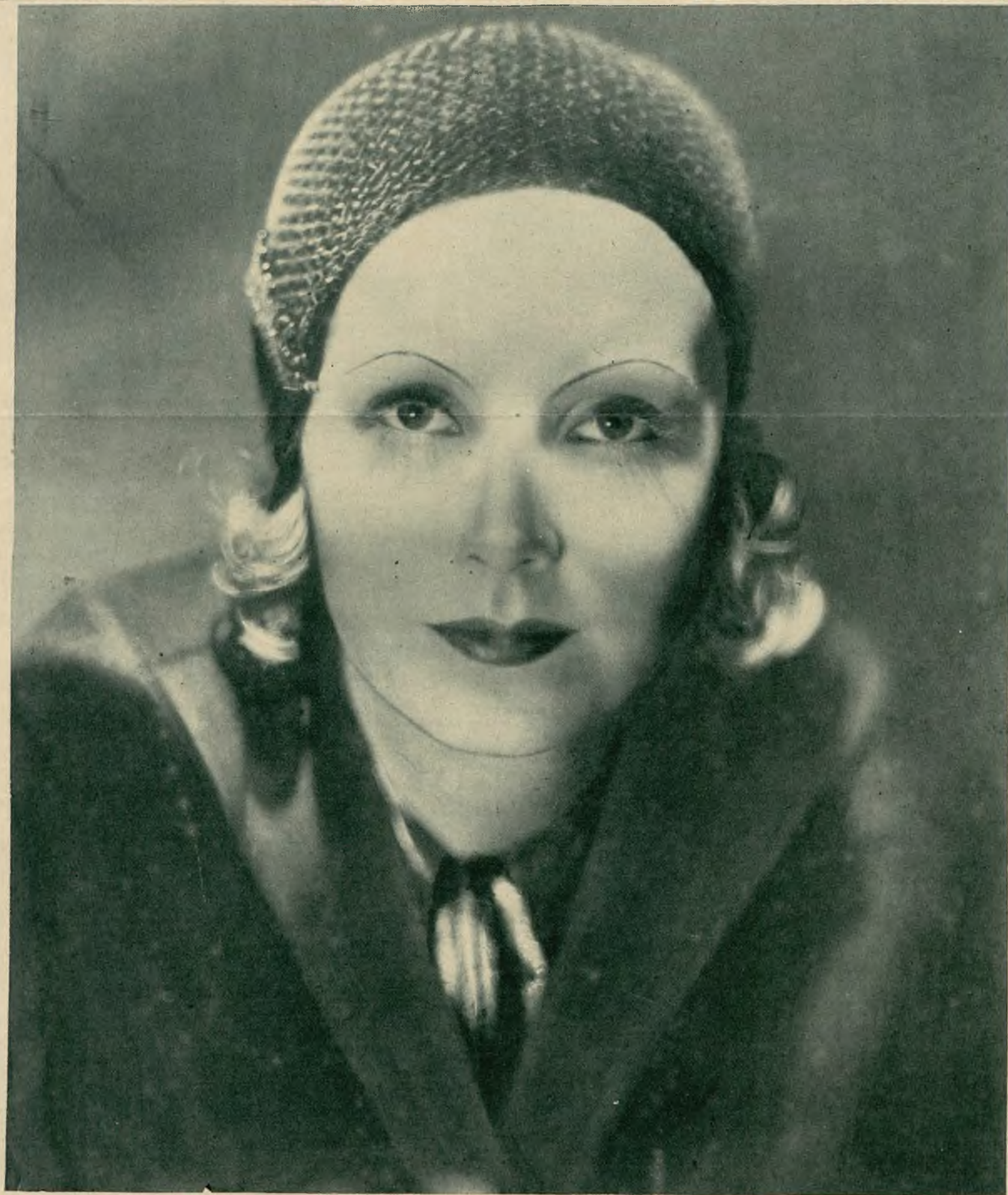
Greta Garbo — Władczyni ekranu.