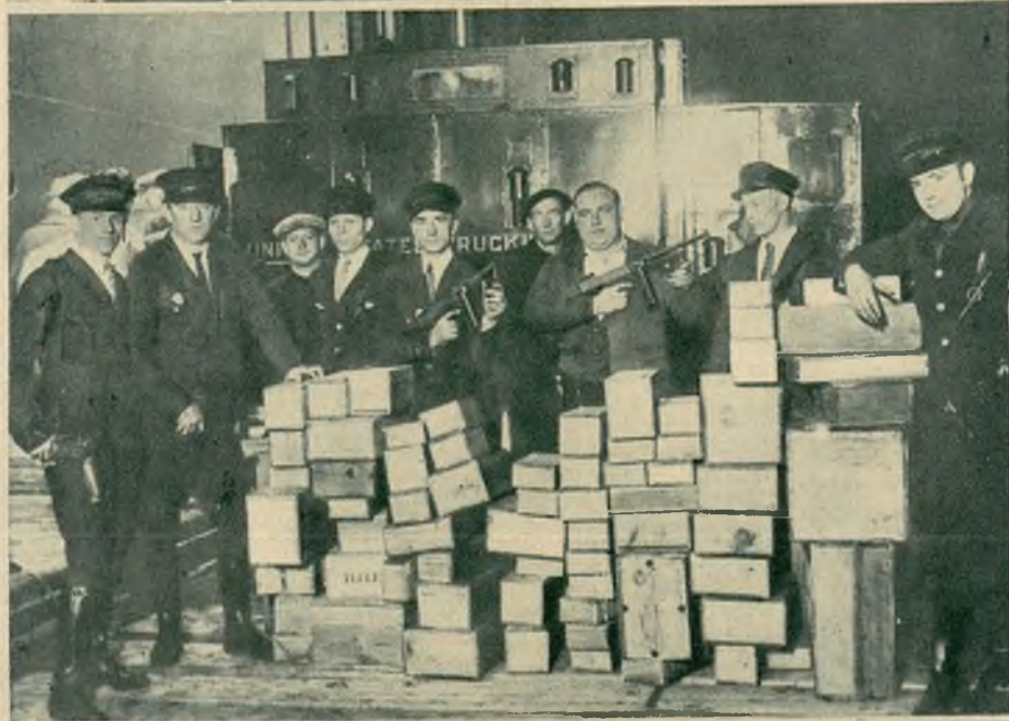
15 milionów dolarów w złocie w porcie N. Jorku ze stróżami bezpieczeństwa, skarb o posiadanie którego rząd Brazylii toczy spór z nowym rządem rewolucyjnym.