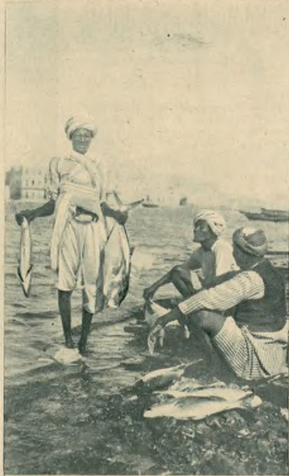
Na prawo: Obfity połów ryb mieszkańców miasta Suakin, portu położonego niedaleko od Sudanu (Afryka zachodnia).