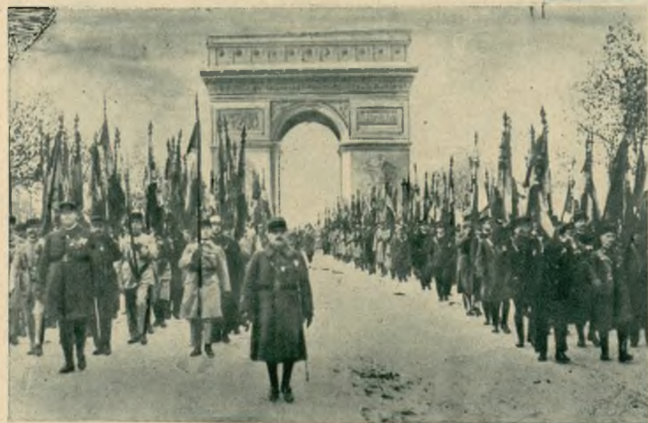
Kompanja chorążych w defiladzie na tle Łuku Tryumfalnego w Paryżu, w czasie dorocznej uroczystości 12-tej z rządu rocznicy zawieszenia broni.