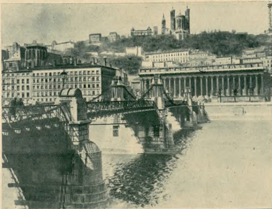
Na lewo: Widok miasta francusk. Lyonu na przedmieście Fourvières i katedrę, u stóp której kilka kamienie podmytych wodą zawaliło się grzebiąc 100 osób.