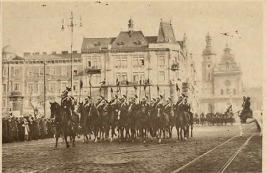
Obchód setnej rocznicy powstania listopadowego we Lwowie.