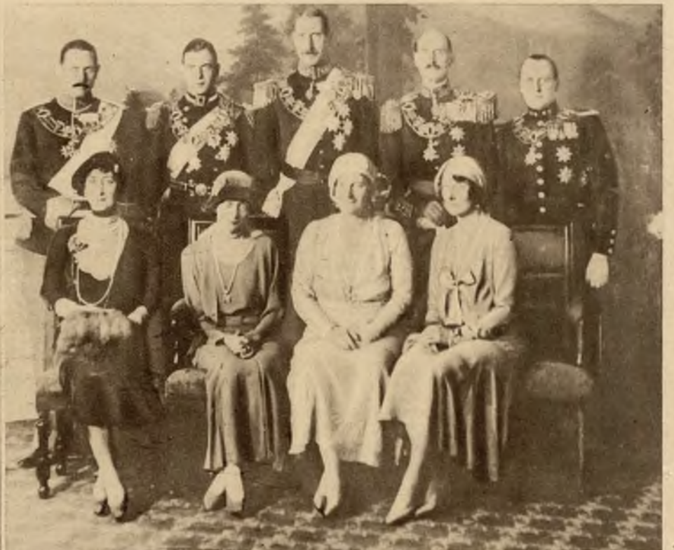
Poniżej: Fotografia rodziny króla Norwegii Haakona zdjęta w czasie uroczystości obchodu 25-lecia wstąpienia na tron. Od lewej ku prawej: ks. Gustaw, ks. Jerzy angielski, król Danii, król Haakon Norwegii i następcą tronu ks. Olaf. Od lewej do prawej: Królowa Norwegii, księżniczka duńska Tuza, królowa Danii i następczyni tronu księżniczka Martha.