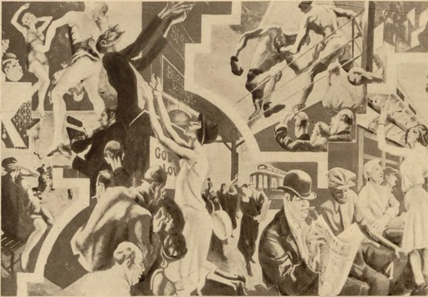
1. Obraz amerykańskiego malarza Tomasza Harta Benta, jeden z pośród cyklu: „Dzisiejsza Ameryka”. Poszczególne sceny malowane są według natury; osoby przedstawione istnieją.