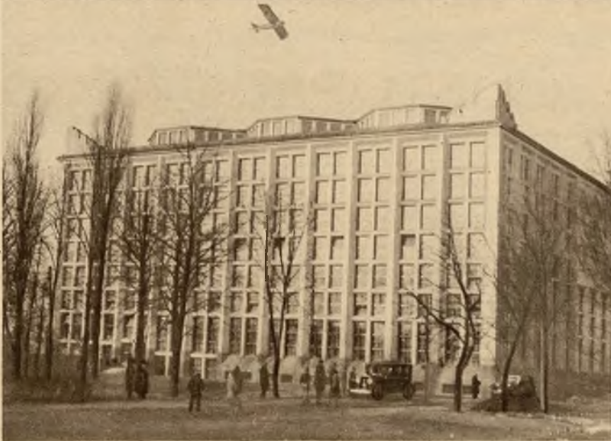
Gmach Wyższej Szkoły Handlowej w Warszawie w której mieści się nowo otwarta Biblioteka Narodowa.