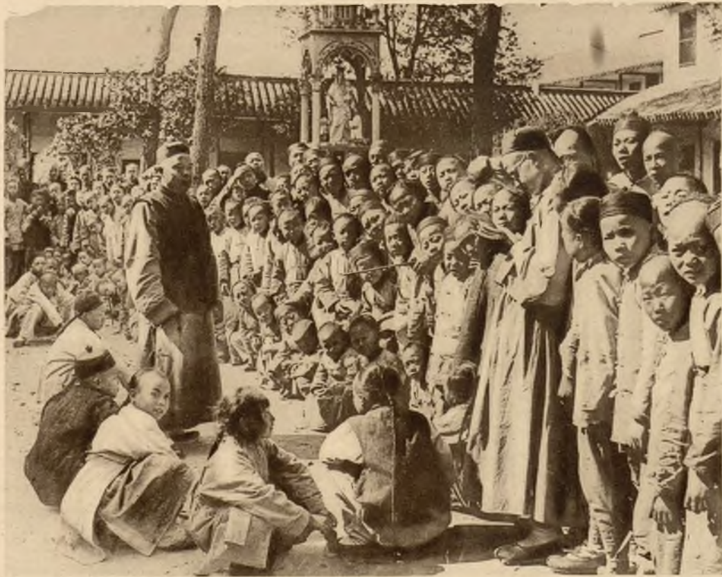
Katolicka szkoła na wolnem powietrzu w Szanghaju w Chinach.

Na prawo: Ras Tafari cesarz Etyopji w stroju koronacyjnym.