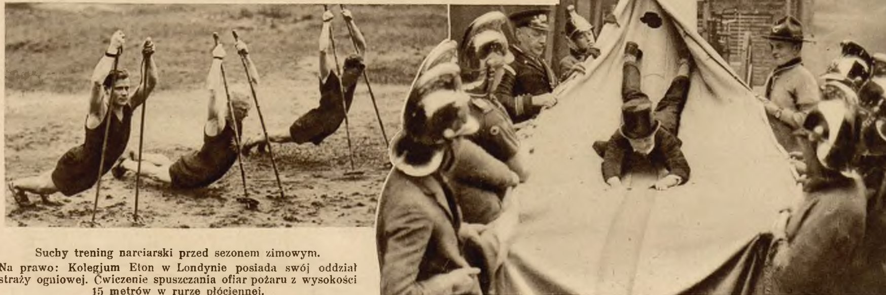
Suchy trening narciarski przed sezonem zimowym.

Na prawo: Kolegium Eton w Londynie posiada swój oddział straży ogniowej. Ćwiczenie spuszczenia ofiar pożaru z wysokości 15 metrów w rurze płóciennej.