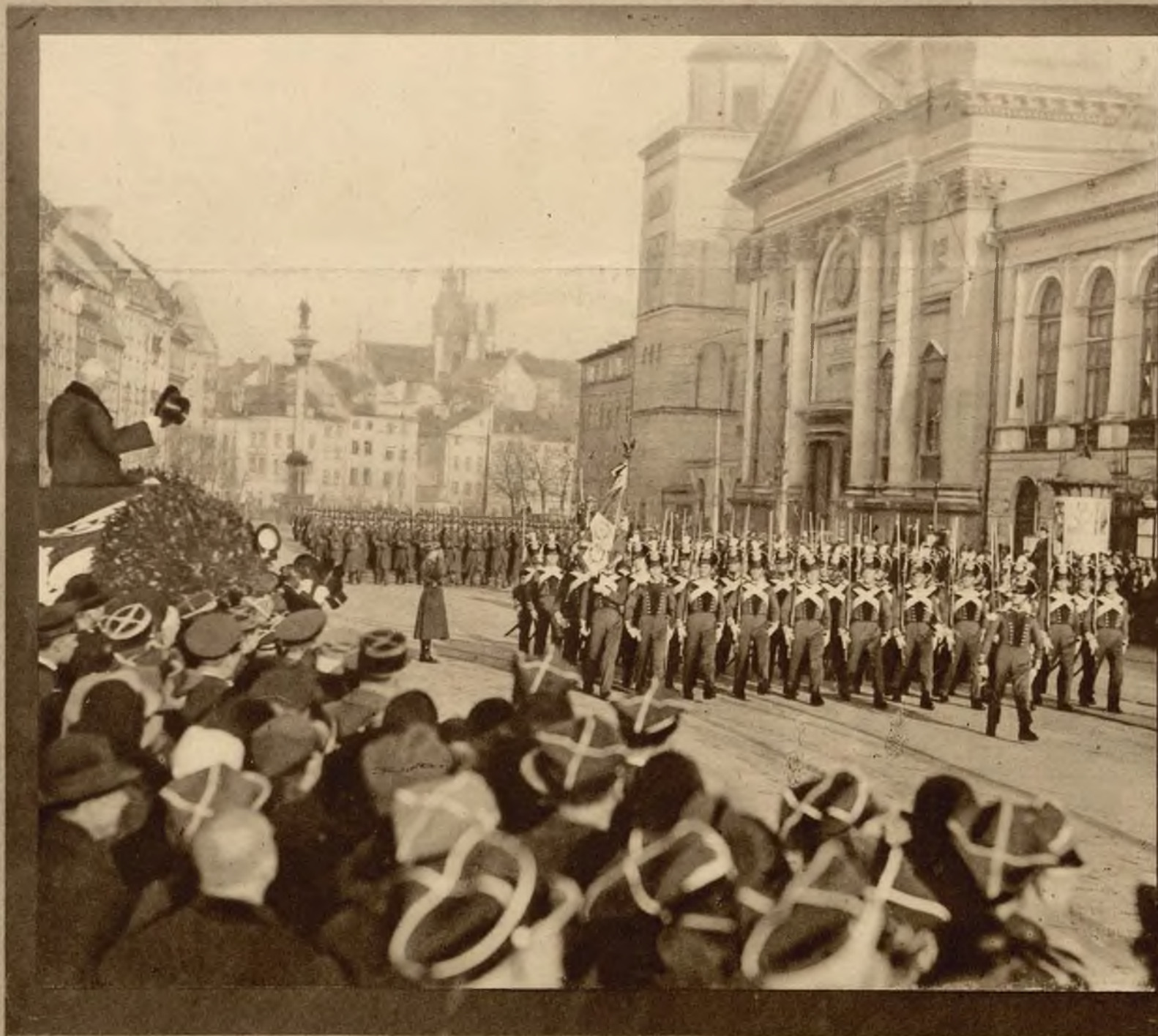
Zo specjalnej trybuny ustawionej na Krak. Przedmieściu w Warszawie p. Prezydent Rzplitej przyjął defiladę podchorążych. Obok trybuny p. Prezydenta stoją attaché wojskowi państw obcych. Fragment przemarszu plutonu podchorążych. W głębi widoczna Kolumna Zygmunta i wieża Katedry.