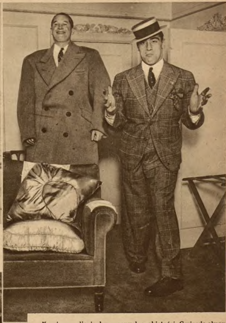
Komiczne zdjęcie dwu znanych osobistości. Gwiazda ekranu Maurice Chevalier w olbrzymim płaszczu włoskiego boksera Primo Carnera, który naśladuje charakterystyczną pozę artysty.