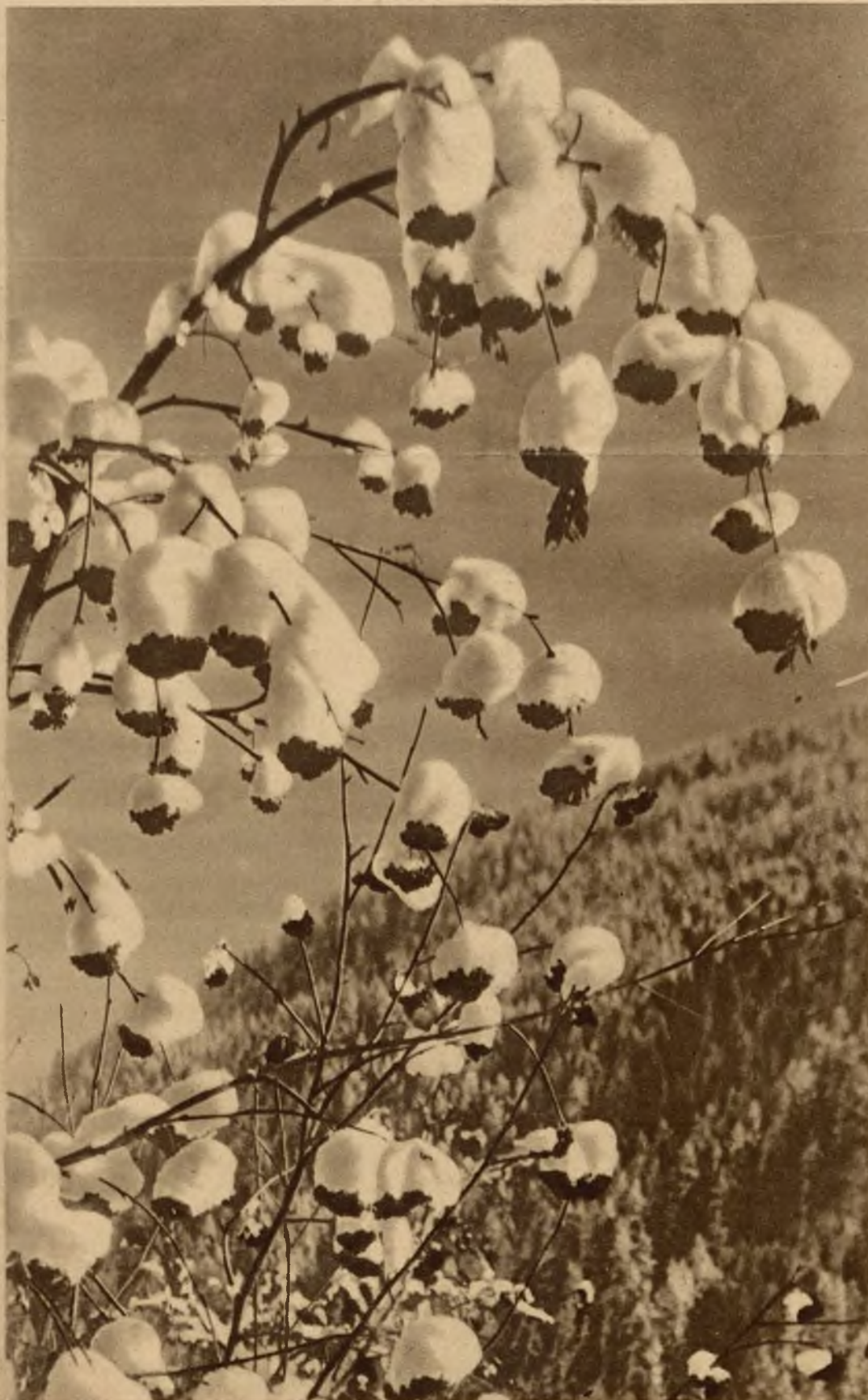
Przepych zimy w swojej prostocie przechodzi czasem powab wiosny. Dzwonki ciszy szczytów.