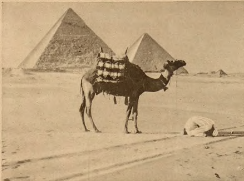
Modlitwa wieczorna beduina na pustyni na tle piramid.