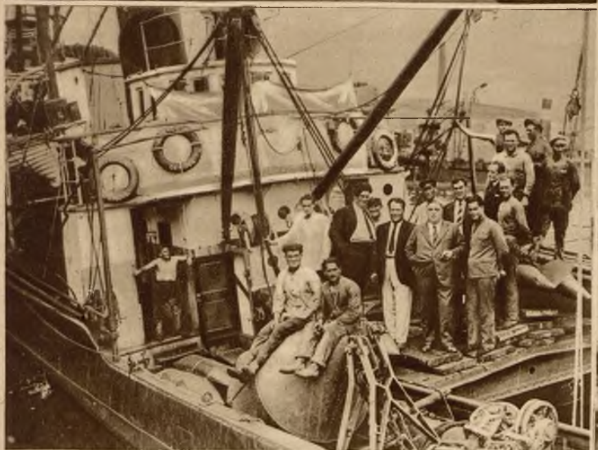
Załoga włoskiego okrętu „Artiglio“ zatopionego przy wylądowaniu „Egiptu“ leżącego od czasu wojny z ładunkiem złota na dnie morza.