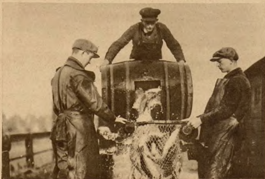
Na lewo: Karpie, tradycyjną rybę podawaną w czasie wilji B. Narodzenia przesypują robotnicy z beczek do sieci, stąd do wagonów basenów, którymi dostarcza się je do miast.