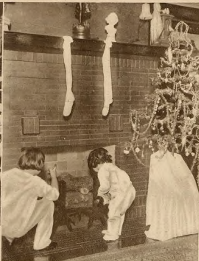
Na prawo: W Anglii w zwyczaju świętego Mikołaja leży napełnianie łakociami pończoszek, przygotowanych przez dzieci.