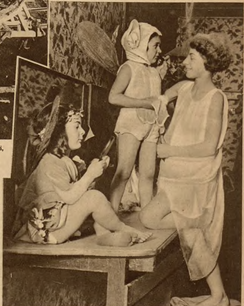
Dzieci-tancerki w całej Angli zaangażowano do pantomin, które odegrane będą przed świętami Bożego Narodzenia. Toaleta „artystek“.