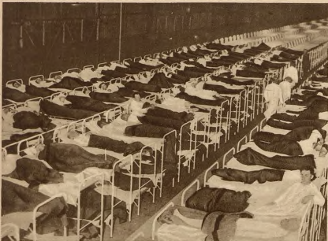
Największa hala noclegowa dla bezdomnych w Nowym Jorku mieszcząca 1500 łóżek, gdzie obecnie 5 do 8000 bezrobotnych otrzymuje codziennie gorący posiłek.