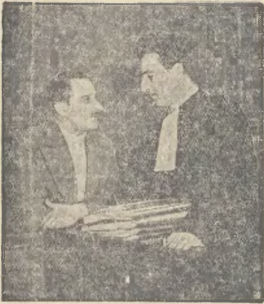
na sali rozpraw w sądzie paryskim wraz ze swoim adwokatem, przybrałym w togo...