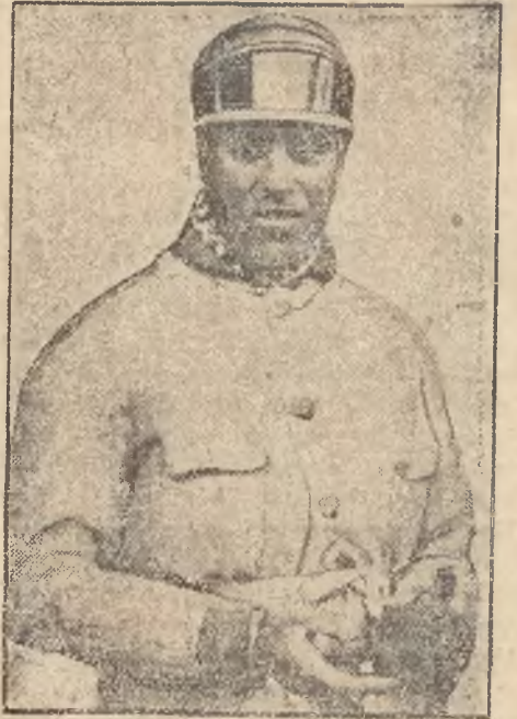
zwycięza w międzynarodowych wyścigach samochodowych w Brescia.

razów, których znaczenia umieszczamy podżej. Litery końcowe są początkami następnego wyrazu. Wyrazy czyta się w różnych kierunkach: poziomo, pionowo i wspak.