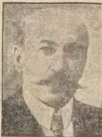
George Leygues. Od 1894 roku występował w każdym rządzie francuskim, kierując różnymi resortami.