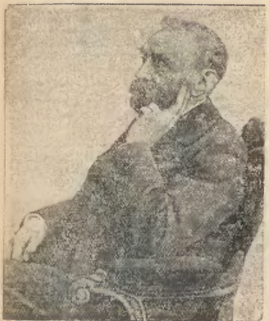
przypada w dniu 21-go października. Jest on założycielem słynnej fundacji jego nazwiska.