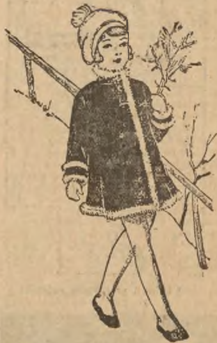
Kłoszowy płaszcz aksamitny dla dziewczynki.

umie należycie obchodzić. Sukienki i ubrania welwetowe można wyprać bądź to w wodzie z mydłem, bądź też