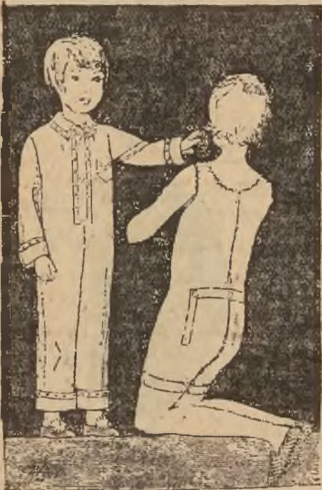
Trykotowa bielizna dla dzieci, którą można przerobić z przenoszonej bielizny dorosłych.

praktyczniejsze na ubranie domowe, bo są niedrogie, dziecko może posiadać ich więcej do zmiany, co ułatwia zawsze świeże wypranie ich i wyprasowanie.