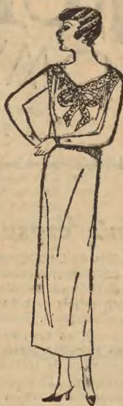
Wytworna koszula nocna z inkrustowanym koronkowym karczkiem.

Dla dziewczynek między 5 a 10 rokiem życia stosowne będą dwie podane przez nas sukienki. Jedna, w formie luźnego kitla, jest zrobiona z zielonego sukienka w różowe paski, wycięcie szyji, manszetki i brzeg sukienki ozdobione pliszą z różowego sukienka, aplikowanego w zęby z zielonego rypsu jedwabnego. — Dla starszej dziewczynki nadaje się dobrze sukienka z paskiem i patkami, przyozdobionymi w guziczki, co imituje modne dzisiaj dla dorosłych, suknie bluzkowe. Przy granatowej lub brązowej sukience ponosowy pasek zamszowy i odpowiednia w tonie krawatka, wprowadzają wesołą nutę. Wogóle należy zwrócić uwagę na to, że tajemnicą uroku stroju dziecięcego jest harmonijne dostosowanie