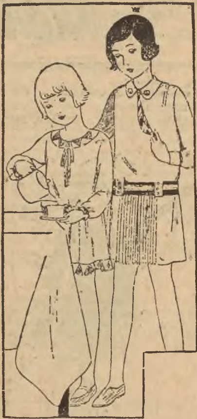
Dwie ładne i praktyczne sukienki.

wyczyścić benzyną lub naftą, a także, jeśli są zapruszone, skórą od chleba lub też skórą ze stoniny. Obok welwetów są wskazane na ubranka dziecięce niedrogie sukienka, barchany i flanelki. Te ostatnie dwa gatunki są naj