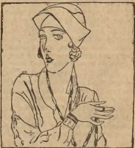
Elegancki kapelusz pilśniowy.