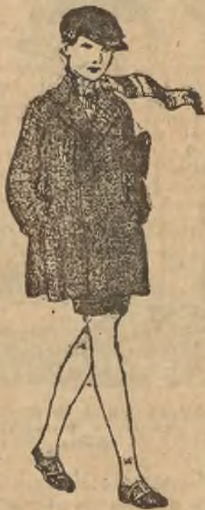
Ulster z grubego tweedu dla chłopczyka.