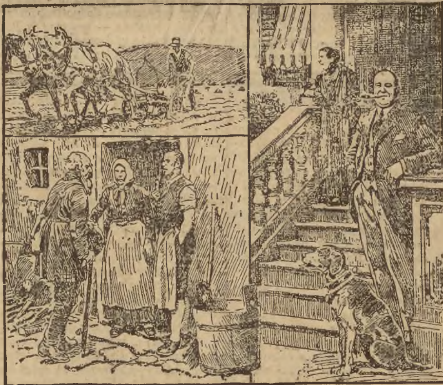
FARMER MILJONEREM. (Do artykułu na stronie 8-mej)

jest niefalszowane. jest higijennie i cznie wyrobiana, jest stale świeża ma najwyższy procent tłuszczu.