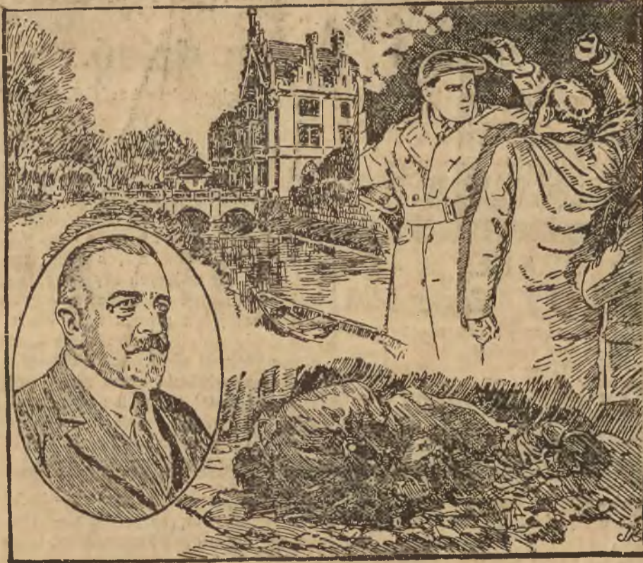
WYJAŚNIONA ZAGADKA. Do artykułu na stronie 8-mej.

Metody francuskie angielskie (Phyllis Earle) amerykańskie (Elizabeth Arden) Jedyny tego rodzaju Instytut w Polsce założ. po kilkuletniej praktyce w Paryżu i orady bezpłatnie. Codz. 10—1 i 3—7 Lwów, Potockiego 20, I. piętro.