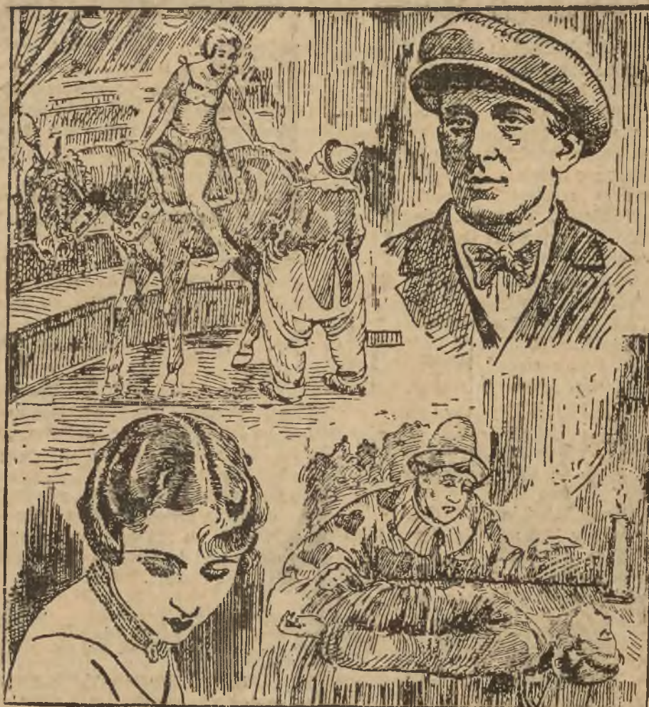
TRAGEDJA W CYRKU. (Do artykułu na str. 9-tej.)

Warszawa, 21. grudnia. (st) Uruchomienie państwowych zakładów azotowych w Mościcach pod Tarnowem nastąpi w pierwszej połowie stycznia. Zakłady te są prawie już całkowicie wykonane i w ostatnich dniach dostarczono do Warszawy próbki produkcji nowych zakładów. Wyroby zbadane przez fachowców uznane zostały za całkowicie odpowiadające wymogom stawianym przez najpoważniejsze autorytety w dziedzinie chemii. Obecnie odbywa się w Mościcach wykańczanie ostatnich już szczegółów montażu maszyn i urządzeń. W uroczystości uruchomienia tych wielkich zakładów weźmie udział p. Prezydent Rzpltej, który jest twórcą nowych zakładów oraz rząd, dyplomacja itd. Fabryka w Mościcach zdola już w pierwszym roku swej pracy zaspokoić wzrastające wciąż zapotrzebowanie na nawozy sztuczne w kraju, a ponadto na mocy odpowiednich umów międzynarodowych zdola wyeksportować znaczną część swej produkcji.