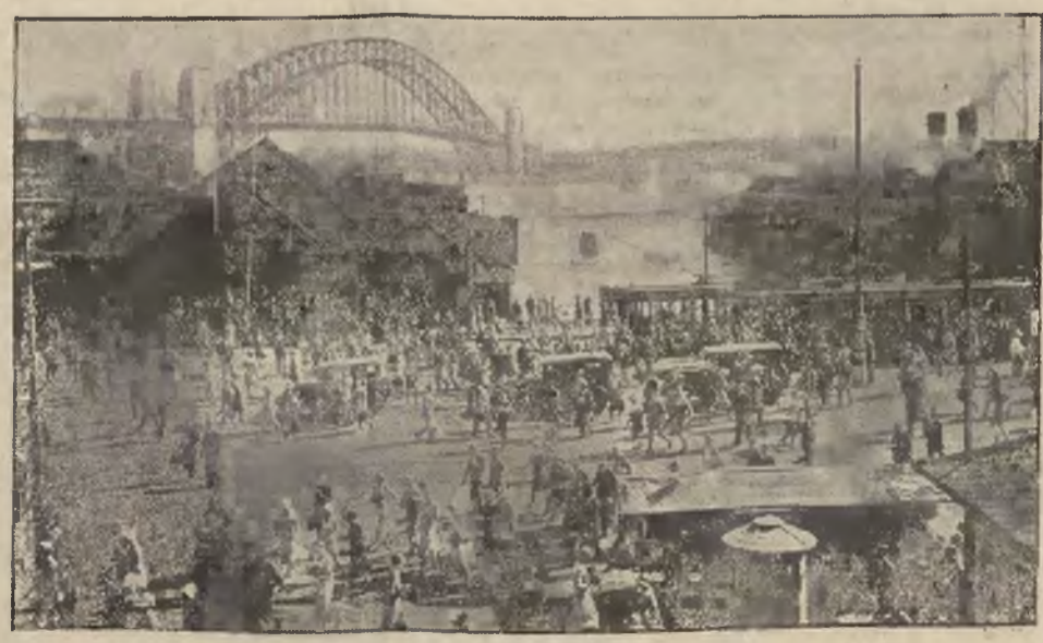
Port w Sidney (Australia) ze wspianym tym nowo zbudowanym mostem, nazwanym „Mostem samobójców“ z powodu częstych wypadków popełnianych na nim samobójstw przez rzucenie się do wody.

Najlepsze najtańsze OBUIE poleca najstarsza firma katolicka L. T. SKRZYPER