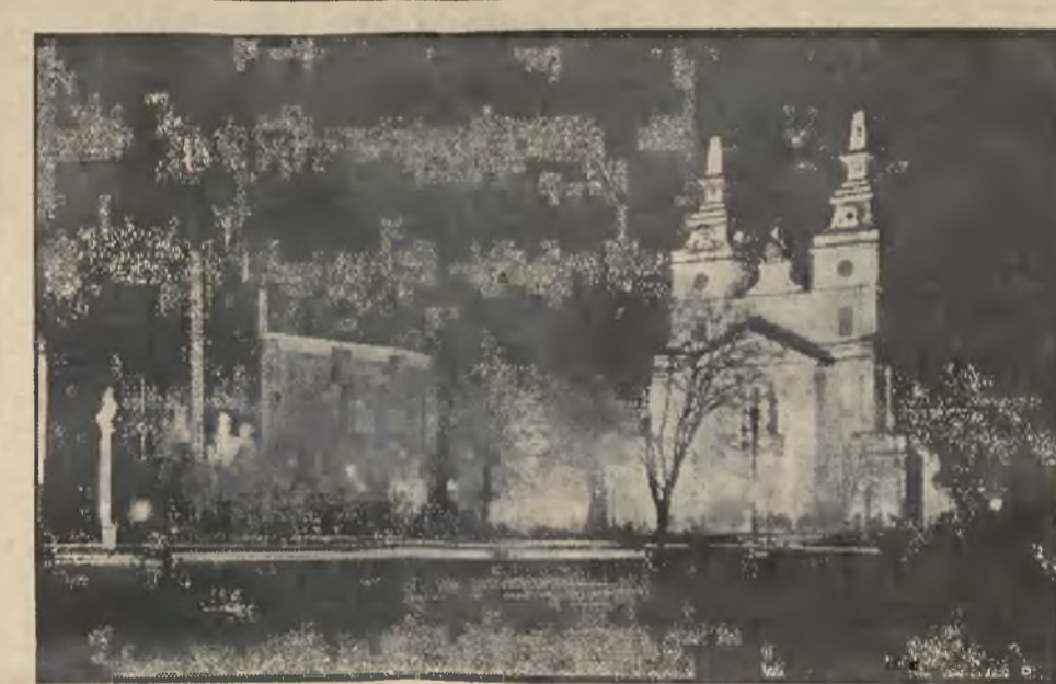
Piękny widok Katedry poznańskiej w świetle reflektorów

2 POKOJE z kuchnią, komfort I piętro, nowe, słoneczne i 2 pokoje nieumeblowane pewnym płatnikiem do wynajęcia Lwów, Listopada 1. 54 a. 25488