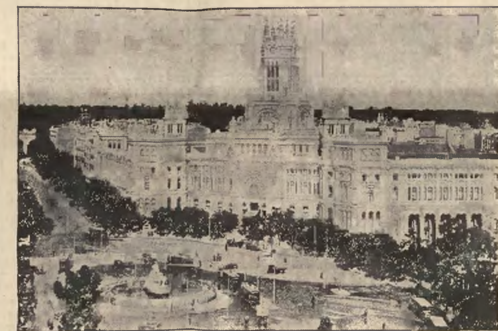
Nowoczesny, a jednak stylowy gmach ministerstwa poczty w Madrycie.

JEDEN pokój kuchnia, Lwów Sobieskiego 37, do wynajęcia, oglądać od 10—12. 26900