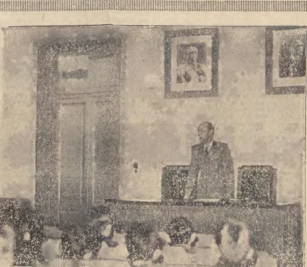
W znaku wojny. — Nawet w powszechnych szkołach odbywają się we Włoszech wykłady o wojnie i zagadnieniach obrony kraju, — przyczem nauczycielem i wykładowcą jest z reguły oficer w czynnej służbie.

DRZEWKA OWOCOWE i ozdobne po najniższych cenach polecają Zakłady Ogrodnicze Małop. Tow. Roln. we Fre-drowie poczta Rudki. Sprzedaż w Lwowie od 15 października, w Kopernika 20. tel. 200-88. 26943