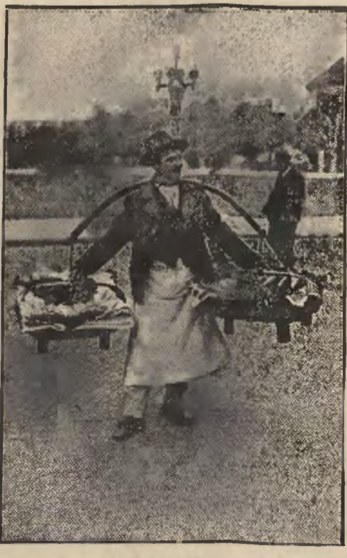
Obrazek z Bukaresztu. — Uliczny handlarz owoców.

UBRANIA robocze, dla uczniów, mundurki, mundury studenckie, rzepisowe, Przysp. Wojsk., harcerskie, kombinezony, wiatrówki, najtańsze źródło i wytwórnia „PALLIUM”, Lwów, ul. Hetmańska 22, obok Muzeum. 112A